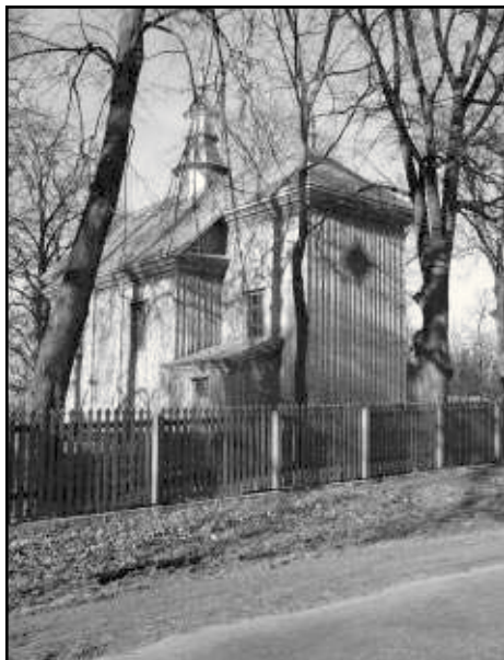
Kościół parafialny, dawna cerkiew unicka w Bezwoli.

„Gazecie w Lublinie”, Radio Lublin i Telewizji Lublin. Dotychczas oprócz publikacji prasowych zrealizowano reportaże radiowe i telewizyjne. Na stronie internetowej projektu: www.tnn.lublin.pl można znaleźć bieżące informacje o jego postępach.