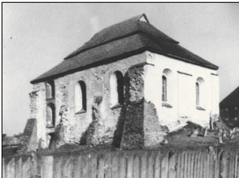
Synagoga w Kurówie, dwudziestolecie międzywojenne, fot. NN. |

Jednym z głównych efektów projektu będzie edukacyjny wortal internetowy „Pamięć Miejsca”, który umożliwi docieranie do informacji związanych z wielokulturowym dziedzictwem regionu. Pośród materiałów znajdują się teksty dotyczące historii poszczególnych miejscowości, informacje o zabytkach: świątyniach różnych wyznań, cmentarzach, kapliczkach; biogramy postaci związanych z konkretnym miejscem, opisy zwyczajów i obrzędów, zapisy legend i wierzeń, informacje demograficzne, zagadnienia gospodarcze. Oprócz tekstów w wortalu znajdują się przedwojenne fotografie dokumentujące ludzi i miejsca oraz relacje zebrane od osób pamiętających przedwojenną Lubelszczyznę, uzupełnione dźwiękami: wypowiedziami w różnych językach i dialektach, tradycyjną muzyką. Materiały będą umieszczone w zintegrowanych bazach: tekstowej, ikonograficznej i dźwiękowej. Wiązanie informacji z różnych dziedzin pozwoli użytkownikowi od-