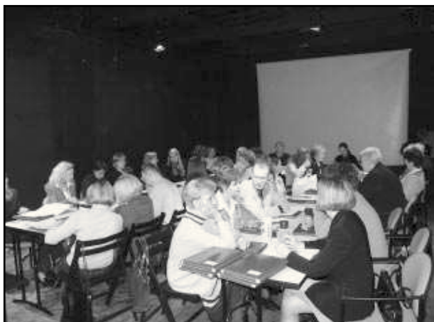
Warsztaty dla nauczycieli - opiekunów szkolnych klubów odkrywców „Ścieżkami pamięci”.