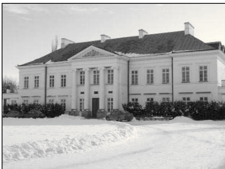
Pałac Jabłonowskich w Kocku. |

w regionie. Kolejnym etapem jest digitalizacja tekstów lub ich fragmentów i stopniowe udostępnianie ich w Internecie. W ramach Bazy Ikonograficznej gromadzone są fotografie przedstawiające przedwojenną Lubelszczyznę. Dotychczas udało się zgromadzić ponad sto fotografii przedstawiających Tomaszów Lubelski, Janowiec nad Wisłą, Zamość, Grabowiec, Kurów, Puławy. Są pośród nich wizerunki ulic, domów, placów, zdjęcia z uroczystości, portrety pojedynczych osób, rodzin i grup zawodowych. W ramach Bazy Dźwiękowej zbierane są relacje - opowieści o miejscach, ludziach, smakach i zapachach świata, którego już nie ma. Podczas wyjazdów studyjnych tworzona jest również dokumentacja fotograficzna wybranych miejsc i zabytków. Powstaje lista tematów związanych z wielokulturowością regionu przekazywana do wykorzystania mediom: