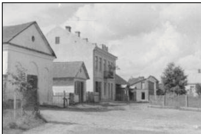
Rynek w Wojślawicach, lata 30. XX wieku, fot. NN. |

Powojenne, w dużej mierze polonocentryczne spojrzenie na historię Lubelszczyzny spowodowało obecny brak informacji na temat kultur zamieszkujących niegdyś region lubelski 1 . Analiza tematów podejmowanych przez historyków, historyków sztuki, regionalistów i etnografów w publikacjach związanych z regionem pokazała, że w większości podejmowano