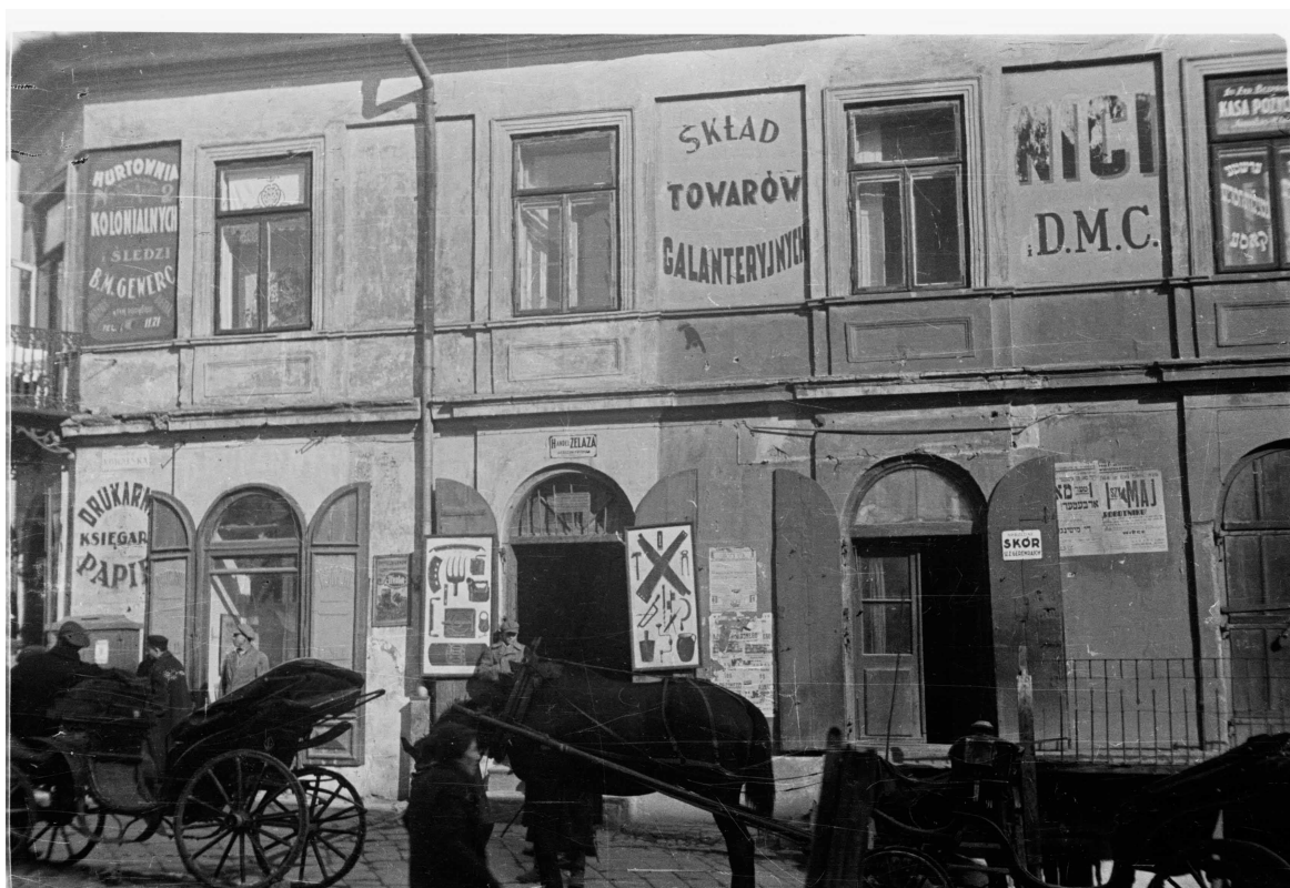
Kowalska 2, autor Stefan Kielsznia, 1938, zbiory fotografii Jerzego Kielszni.