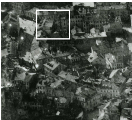
Fragment panoramy Lublina, lata 30., ul. Kowalska/A fragment of panorama of Lublin in the 1930s, Kowalska street,