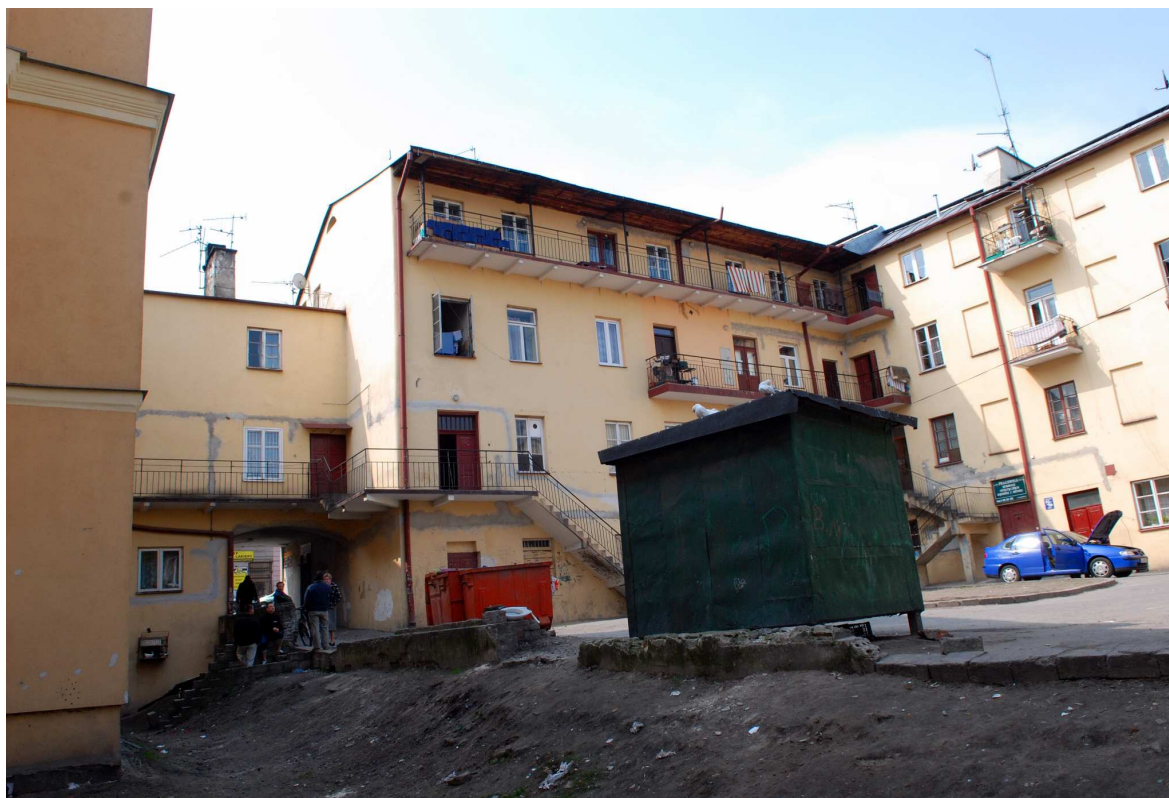
Elewacja tylna, Kowalska 2, fot. Marcin Moszyński, 2010.