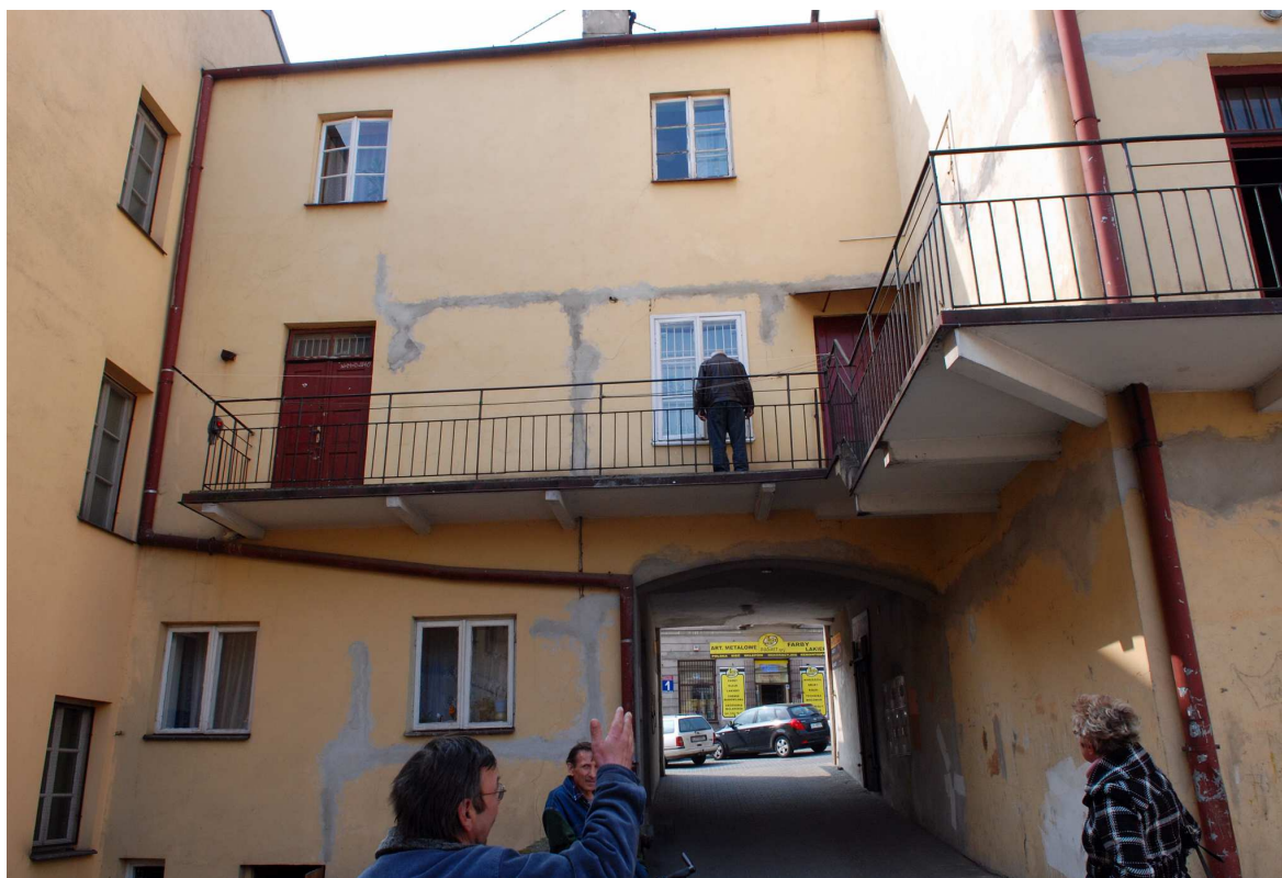
Elewacja tylna, Kowalska 2, fot. Marcin Moszyński, 2010.