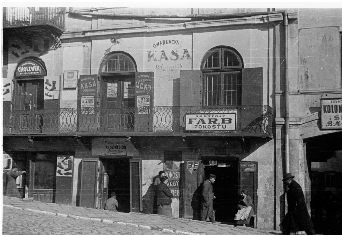
Kowalska 2, autor Stefan Kielsznia, 1938, zbiory fotografii Jerzego Kielszni.