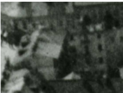
Fragment panoramy Lublina, lata 30., Kowalska 2/A fragment of panorama of Lublin in the 1930s, Kowalska 2,