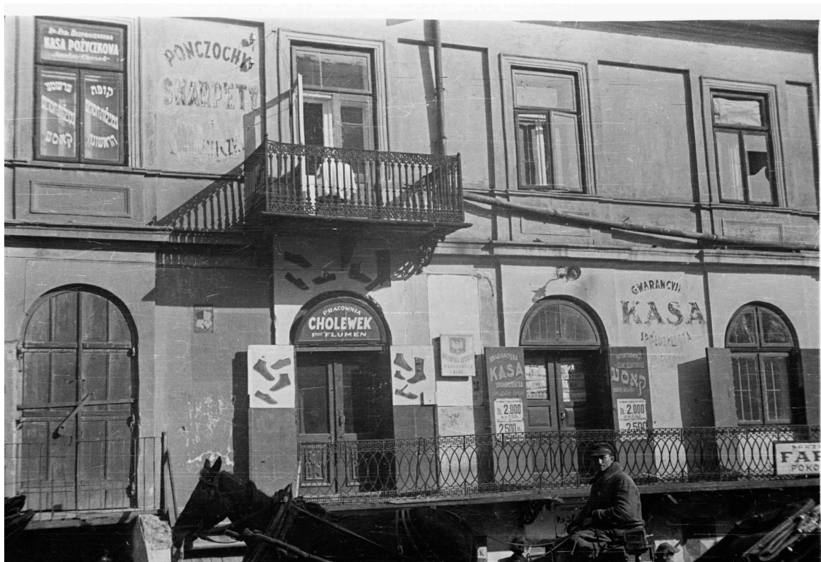
Kowalska 2, autor Stefan Kielsznia, 1938, zbiory fotografii Jerzego Kielszni.