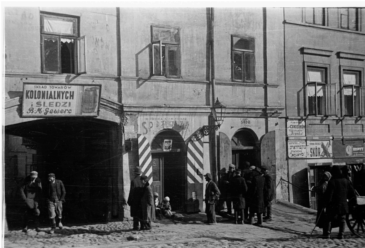
Kowalska 2, autor Stefan Kielsznia, 1938, zbiory fotografii Jerzego Kielszni.