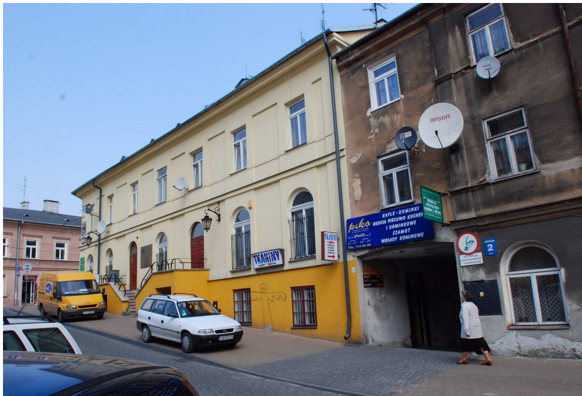
Fasada, Kowalska 2, fot. Marcin Moszyński, 2010.