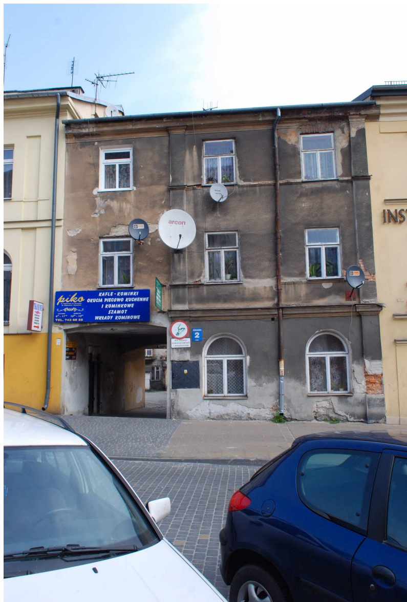
Fasada, Kowalska 2, fot. Marcin Moszyński, 2010.