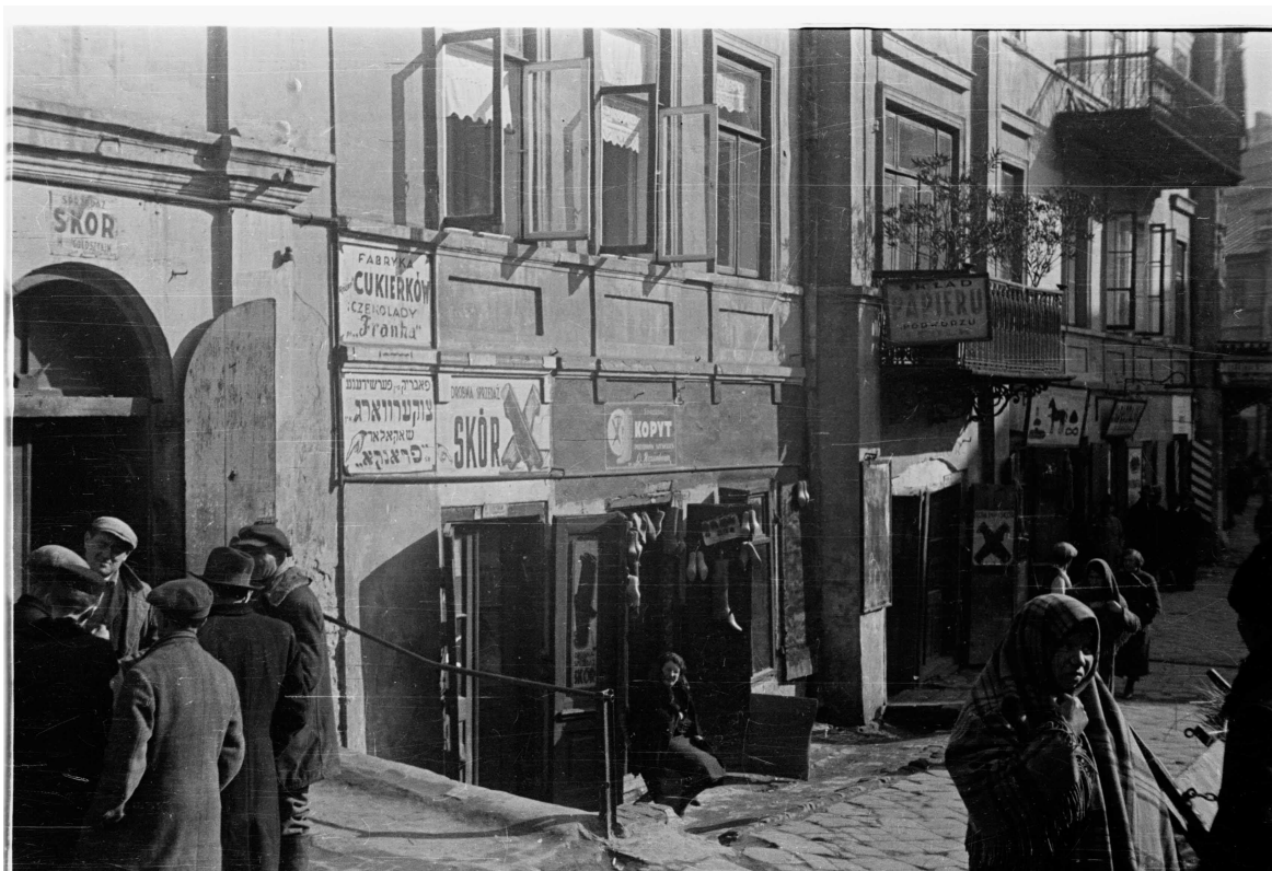
Kowalska 2, autor Stefan Kielsznia, 1938, zbiory fotografii Jerzego Kielszni.