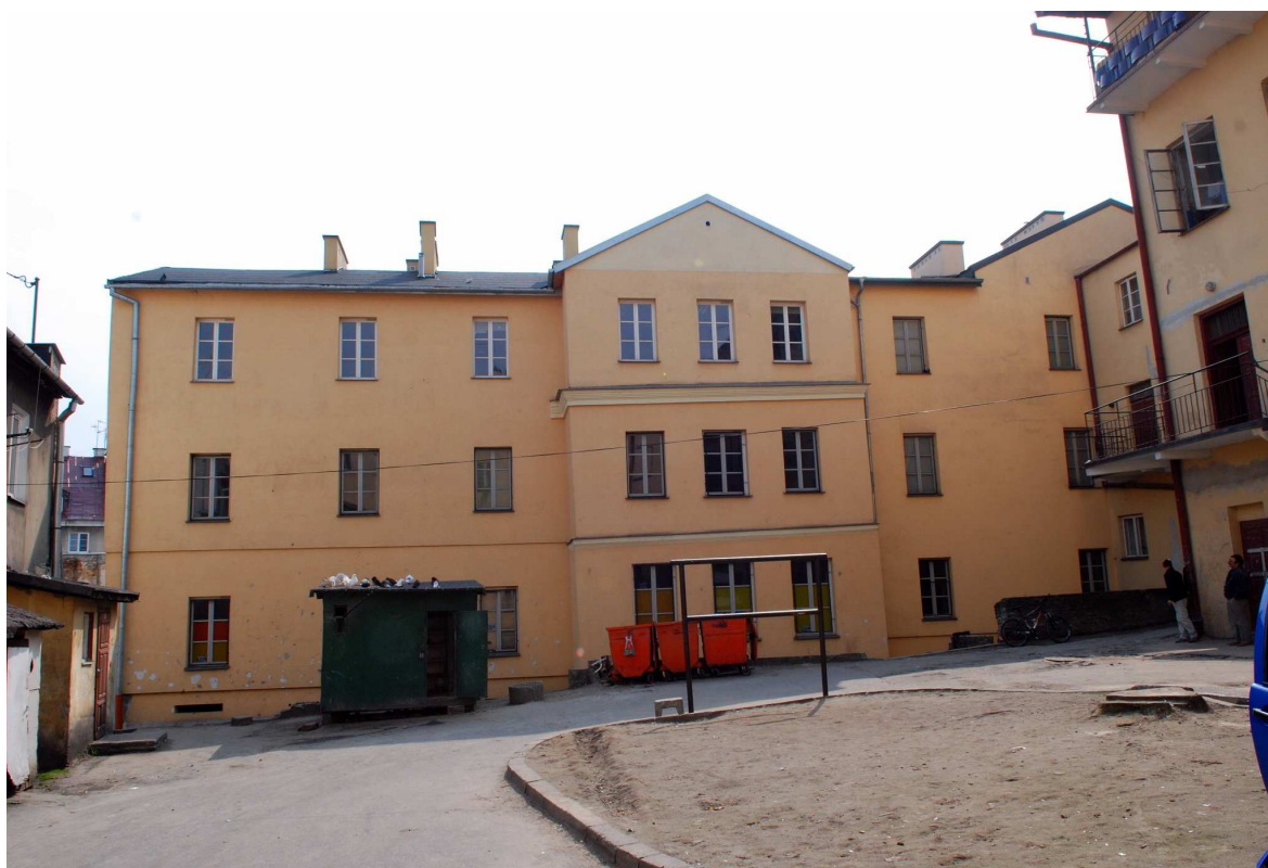
Elewacja tylna, Kowalska 2, fot. Marcin Moszyński, 2010.