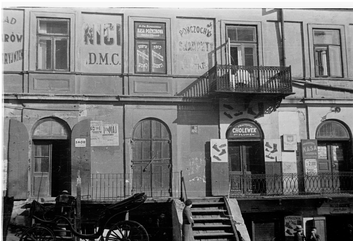
Kowalska 2, autor Stefan Kielsznia, 1938, zbiory fotografii Jerzego Kielszni.