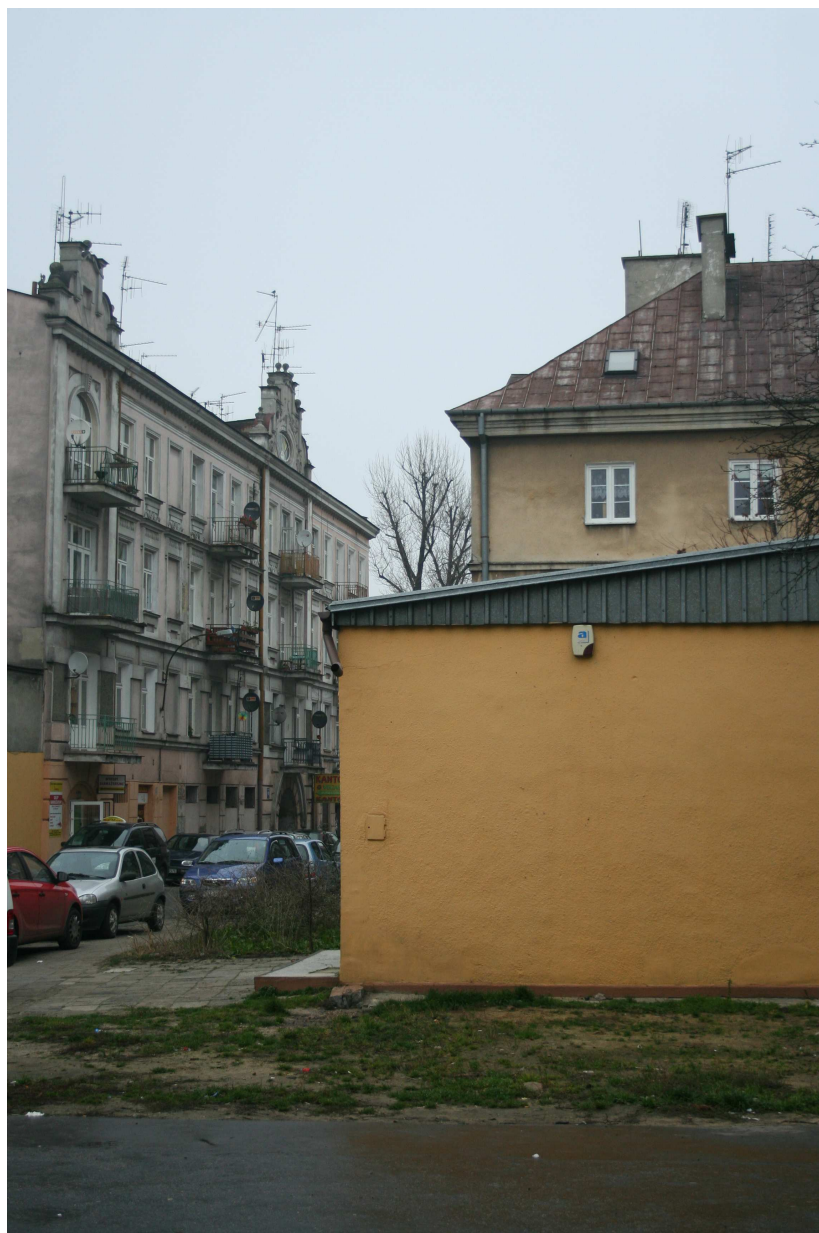
Elewacja frontowa, Cyrulicza 8, fot. Marcin Fedorowicz, 2010.