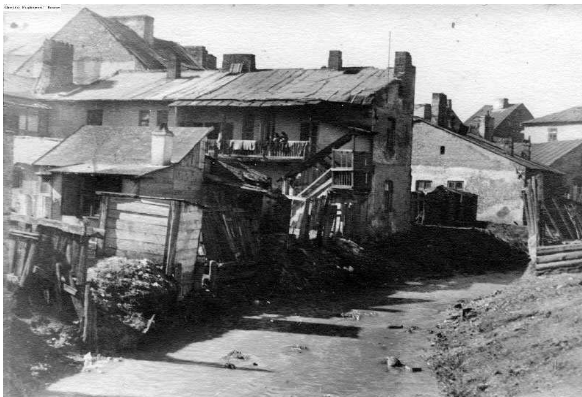
Jateczna 22, bożnica (na drugim planie), widok nieruchomości od rzeki Czechówki, autor nieznanym,