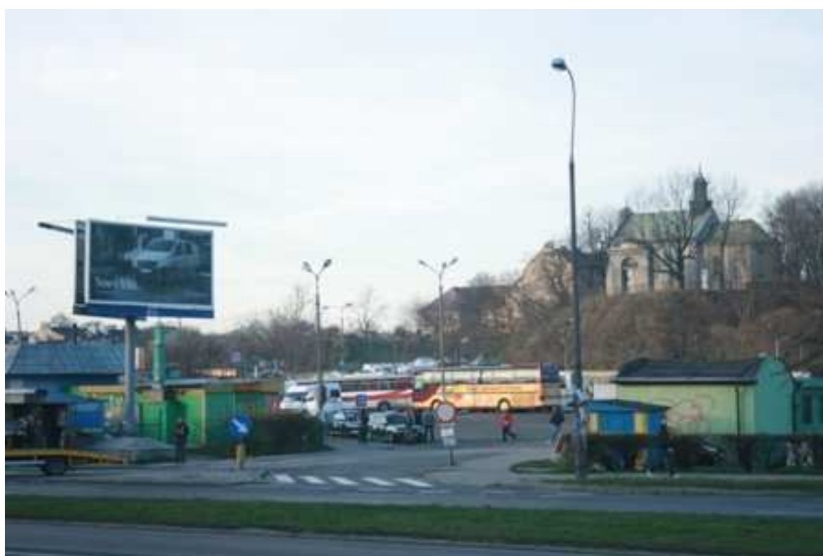
Jateczna 22, fot. Marcin Fedorowicz, 2010.