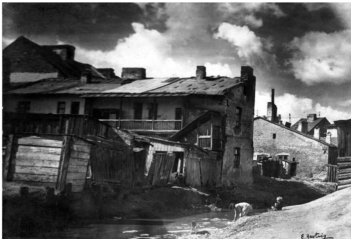
Jateczna 22, bożnica (na drugim planie), widok nieruchomości od rzeki Czechówki, autor Edward Hartwig.