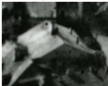
Fragment panoramy Lublina, lata 30., Jateczna 22./A fragment of panorama of Lublin in the 1930s, Jateczna 22,