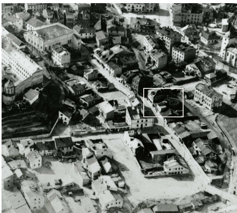
Fragment panoramy Lublina, lata 30., ul. Jateczna/A fragment of panorama of Lublin in the 1930s, Jateczna street,