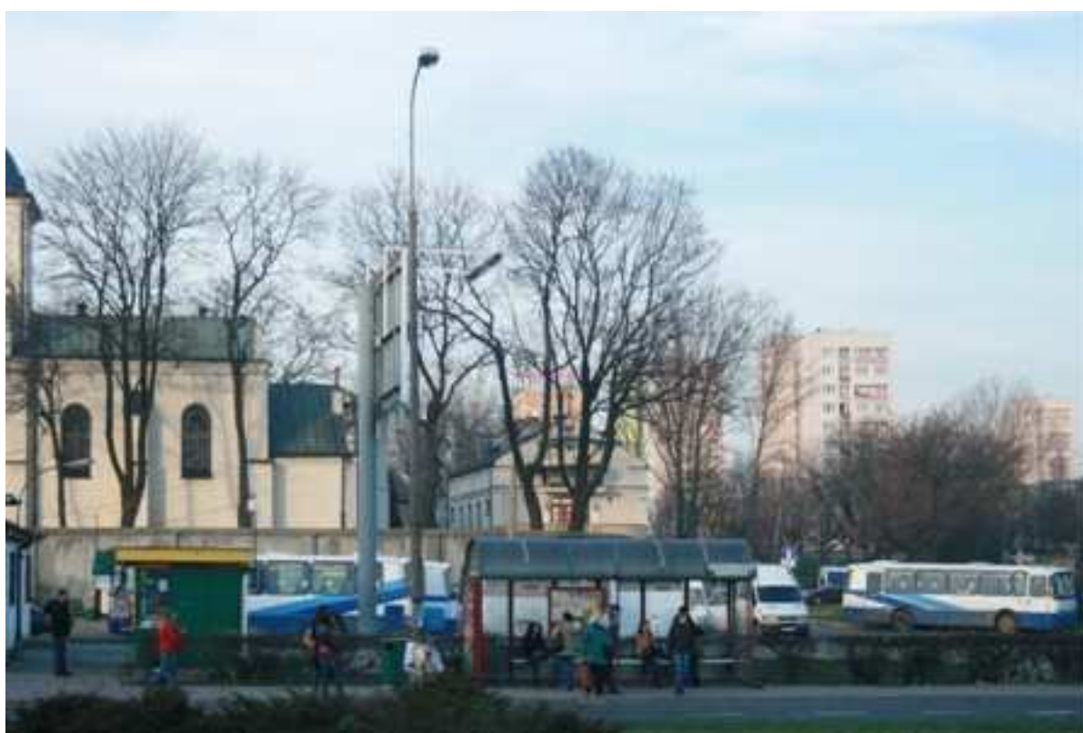
Jateczna 38, fot. Marcin Fedorowicz, 2010.