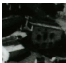
Fragment panoramy Lublina, lata 30., Jateczna 38/A fragment of panorama of Lublin in the 1930s, Jateczna 38,