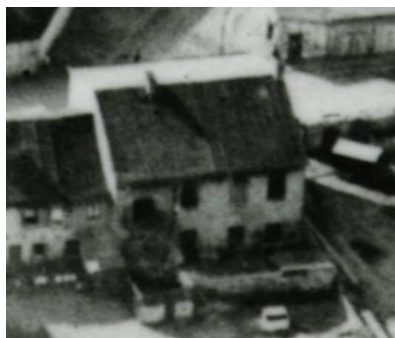
Fragment panoramy Lublina, lata 30., Krawiecka 49/A fragment of panorama of Lublin in the 1930s, Krawiecka 49,