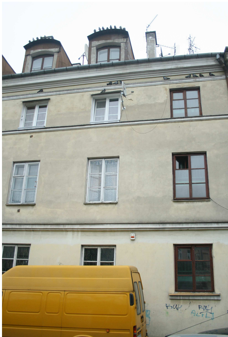
Fasada, Nadstawna 3, fot. Marcin Fedorowicz, 2010.