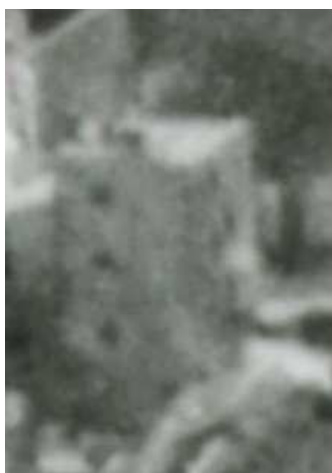
Fragment panoramy Lublina, lata 30., Nadstawna 3/ A fragment of panorama of Lublin in the 1930s, Nadstawna 3,