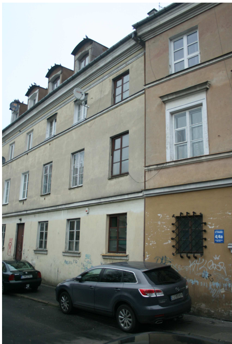
Fragment elewacji głównej, Nastawna 3, fot. Marcin Fedorowicz, 2010.