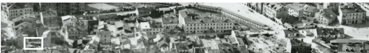
Fragment panoramy Lublina, lata 30., ul. Nadstawna/ A fragment of panorama of Lublin in the 1930s, Nadstawna street,