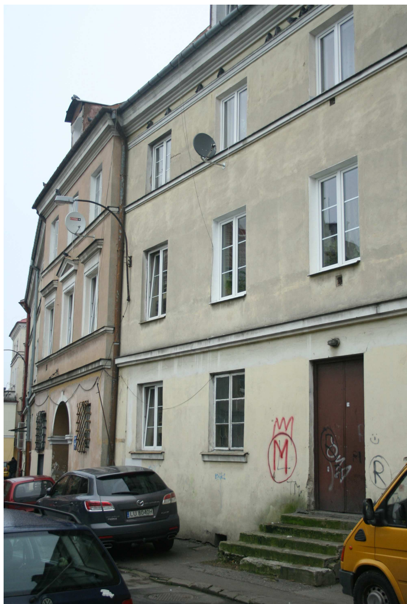
Nastawna 5, fot. Marcin Fedorowicz, 2010.