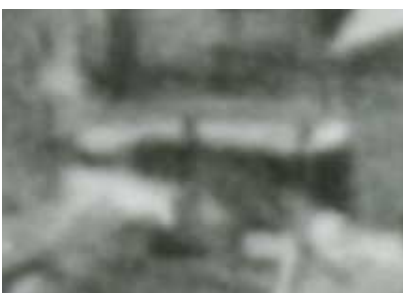
Fragment panoramy Lublina, lata 30., Nadstawna 5/ A fragment of panorama of Lublin in the 1930s, Nadstawna 5,