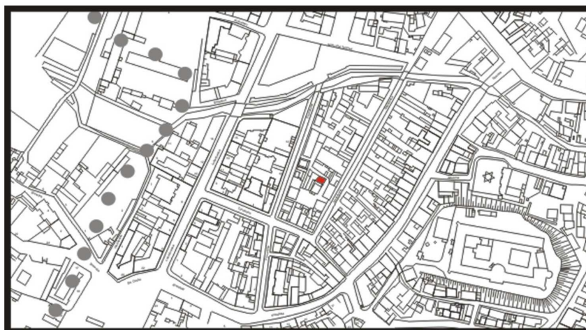
LOKALIZACJA NIERUCHOMOŚCI - Nadstawna 6 LOCATION OF THE PROPERTY - Nadstawna 6