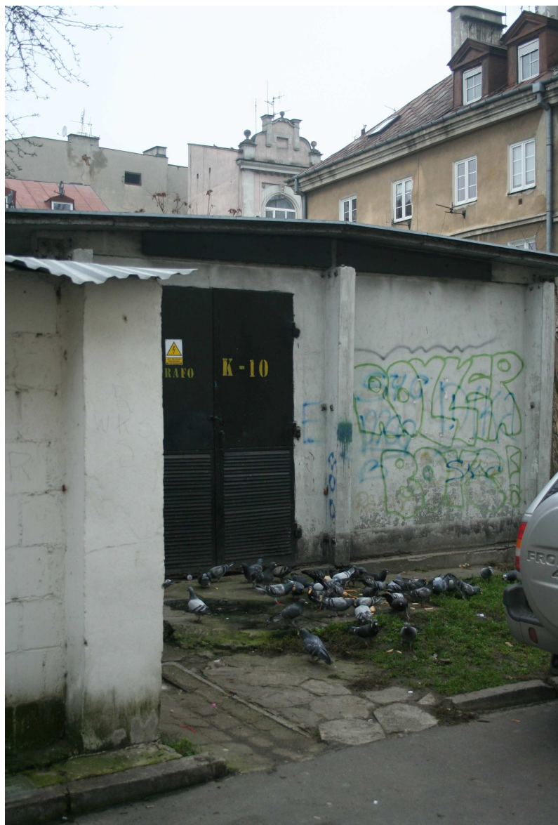
Nastawna 6, fot. Marcin Fedorowicz, 2010.