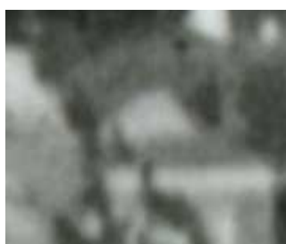
Fragment panoramy Lublina, lata 30., Nadstawna 6/ A fragment of panorama of Lublin in the 1930s, Nadstawna 6,