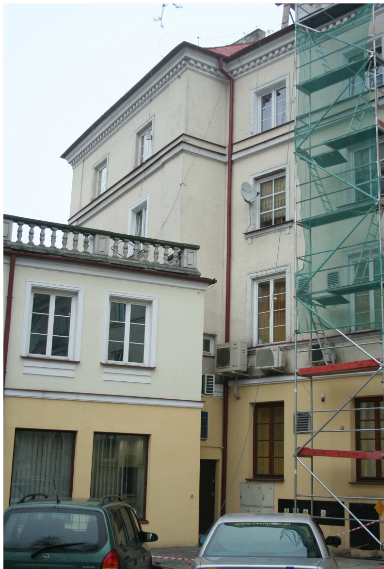
Nastawna 27, fot. Marcin Fedorowicz, 2010.