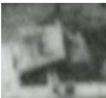
Fragment panoramy Lublina, lata 30., Nadstawna 27/ A fragment of panorama of Lublin in the 1930s, Nadstawna 27,