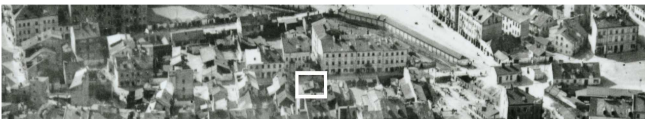
Fragment panoramy Lublina, lata 30., ul. Nadstawna/ A fragment of panorama of Lublin in the 1930s, Nadstawna street,