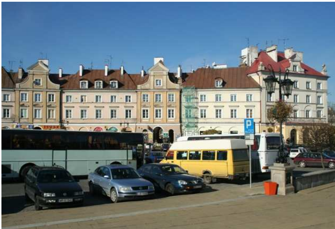
Szeroka 16, fot. Marcin Fedorowicz, 2010.