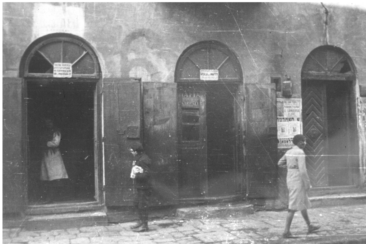
Szeroka 16, fragment kamienicy, autor Stefan Kielsznia, ok. 1938, własność Jerzego Kielszni.