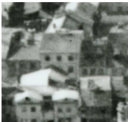
Fragment panoramy Lublina, lata 30., Szeroka 16/A fragment of panorama of Lublin in the 1930s, Szeroka 16,