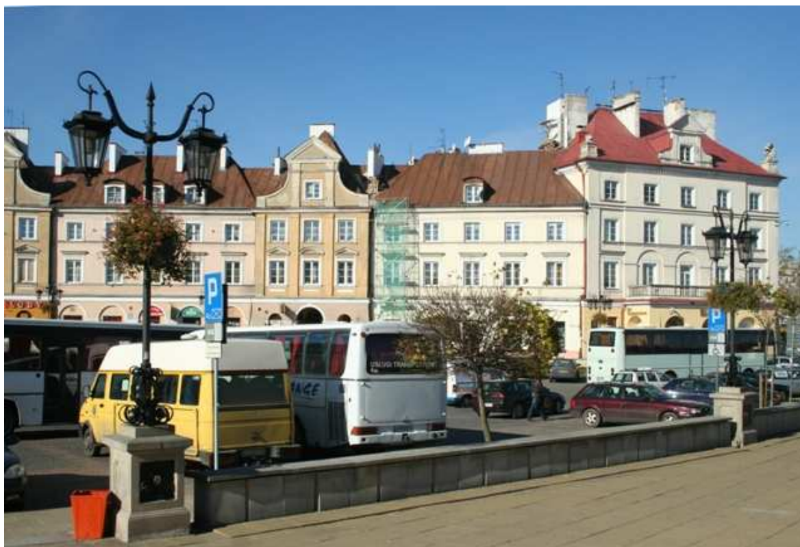
Szeroka 20, fot. Marcin Fedorowicz, 2010.