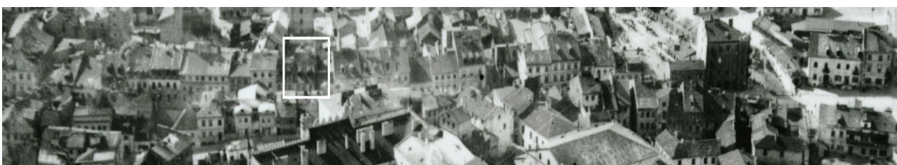
Fragment panoramy lublina, lata 30., ul. Szeroka/A fragment of panorama of Lublin in the 1930s, Szeroka street,