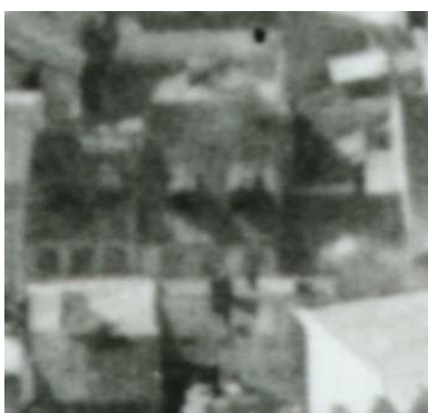
Fragment panoramy lublina, lata 30., Szeroka 20/A fragment of panorama of Lublin in the 1930s, Szeroka 20,