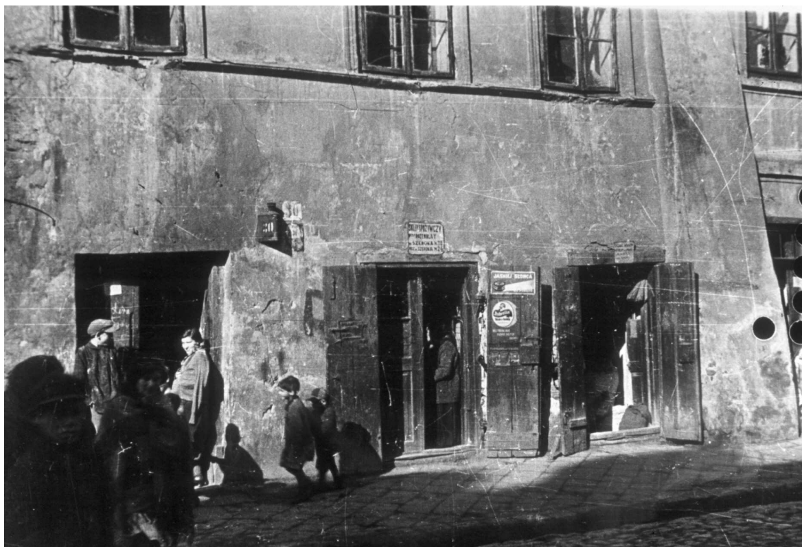
Szeroka 30, fragment kamienicy, autor Stefan Kielsznia, ok. 1938, własność Jerzego Kielszni.