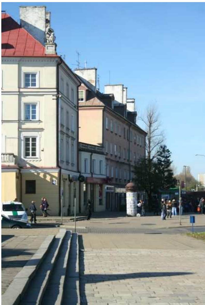
Szeroka 30, fot. Marcin Fedorowicz, 2010.