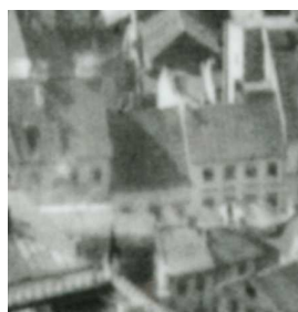
Fragment panoramy Lublina, lata 30., Szeroka 30/ A fragment of panorama of Lublin in the 1930s, Szeroka 30,