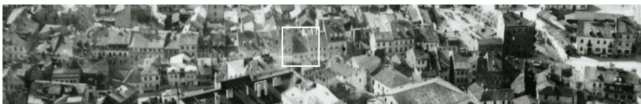
Fragment panoramy Lublina, lata 30., ul. Szeroka/ A fragment of panorama of Lublin in the 1930s, Szeroka street,