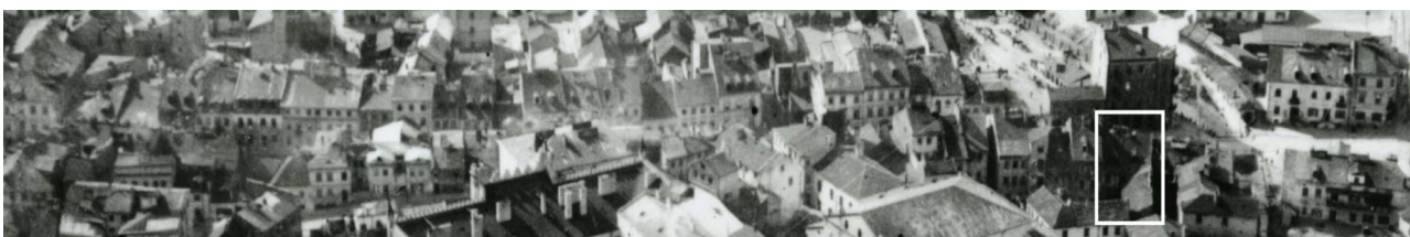
Fragment panoramy Lublina, lata 30., ul. Szeroka/A fragment of panorama of Lublin in the 1930s, Szeroka street,