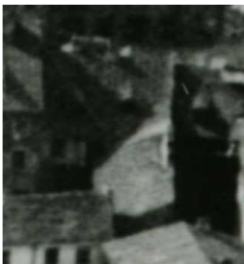
Fragment panoramy Lublina, lata 30., Szeroka 39/A fragment of panorama of Lublin in the 1930s, Szeroka 39,