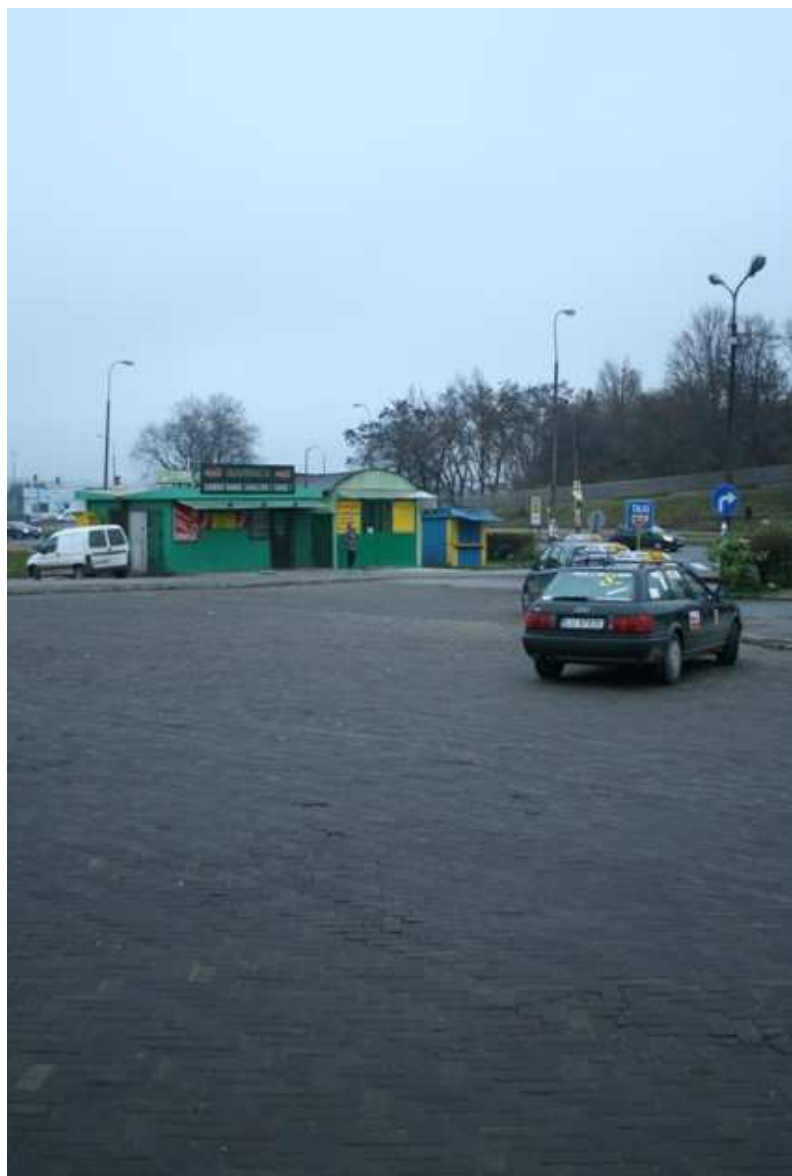
Szeroka 39, fot. Marcin Fedorowicz, 2010.