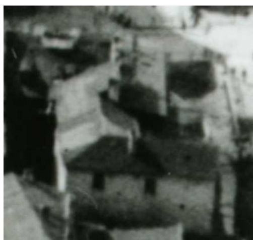
Fragment panoramy Lublina, lata 30., Szeroka 41/A fragment of panorama of Lublin in the 1930s, Szeroka 41,