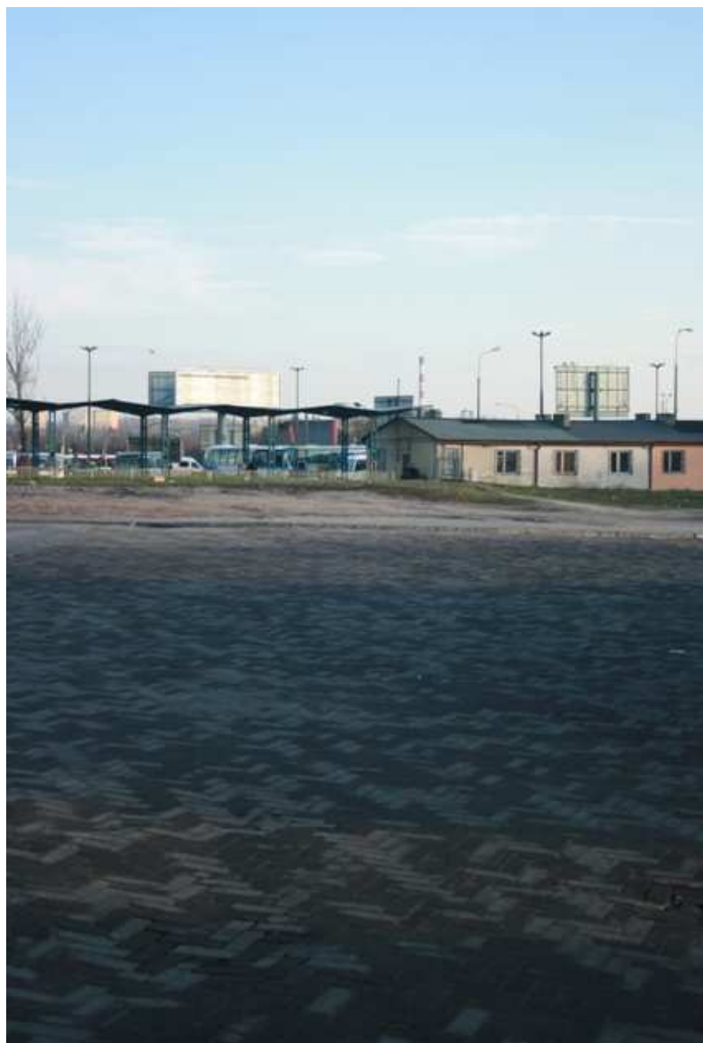
Szeroka 41, fot. Marcin Fedorowicz, 2010.