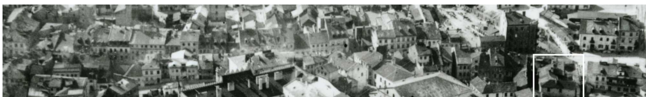
Fragment panoramy Lublina, lata 30., ul. Szeroka/A fragment of panorama of Lublin in the 1930s, Szeroka street,