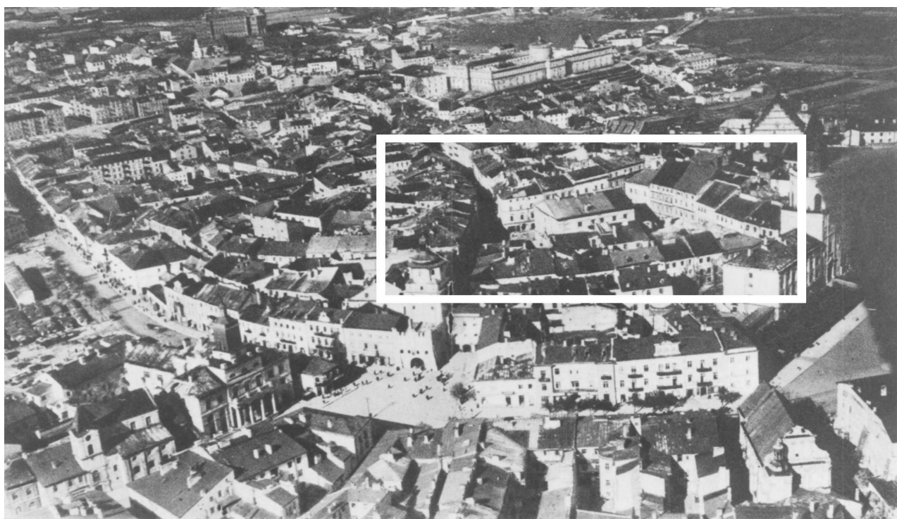
Panorama Lublina, lata 30./Panorama of Lublin in the 1930s,