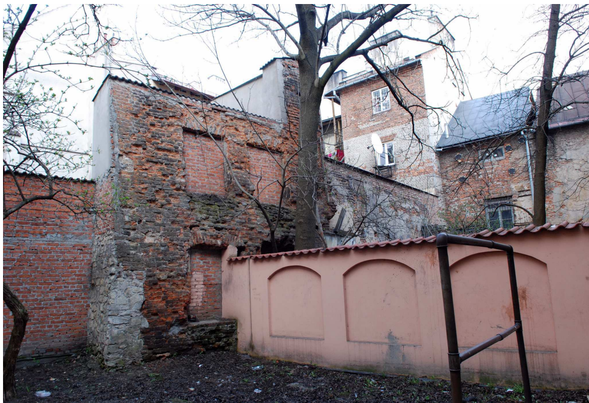
Podwórko, Rynek 11, 2010.