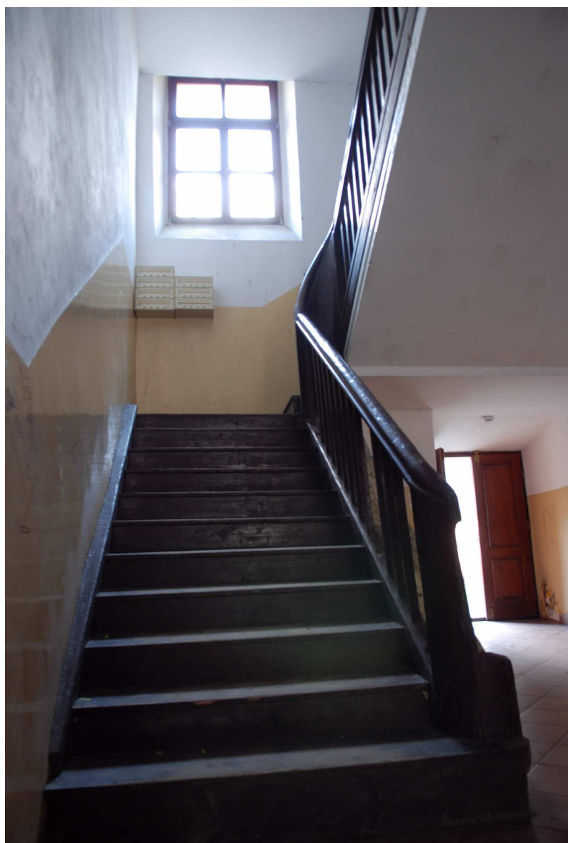
Klatka schodowa, Rynek 11, fot. Marcin Moszyński, 2010.