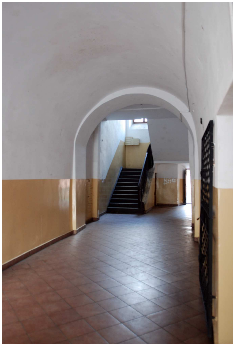
Klatka schodowa, Rynek 11, fot. Marcin Moszyński, 2010.