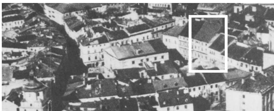
Fragment panoramy Lublina, lata 30., ul. Rynek/A fragment of panorama of Lublin in the 1930s, Rynek street,