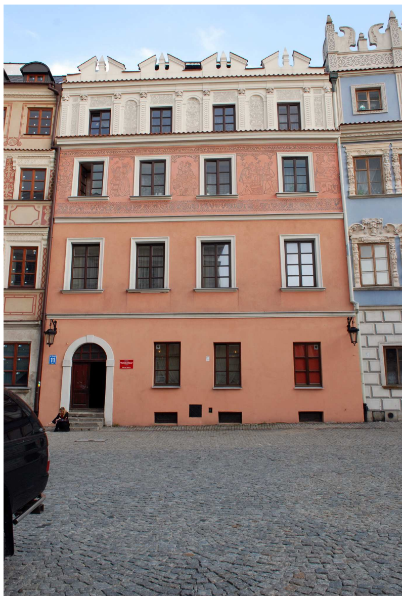
Fasada, Rynek 11, fot. Marcin Moszyński, 2010.