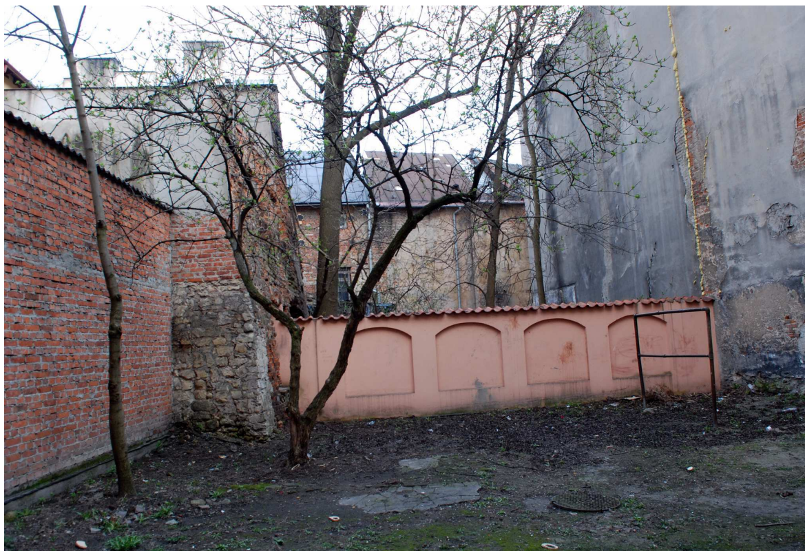
Podwórk, Rynek 11, fot. Marcin Moszyński, 2010.