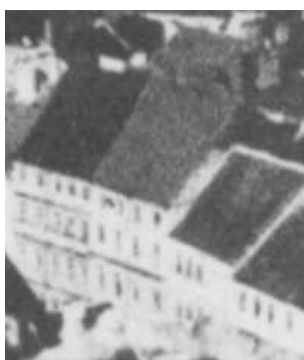
Fragment panoramy Lublina, lata 30., Rynek 11/A fragment of panorama of Lublin in the 1930s, Rynek 11,