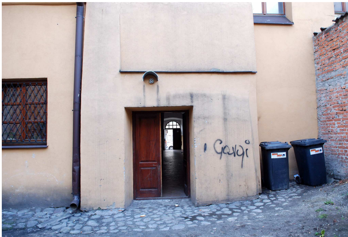
Podwórko, Rynek 11, fot. Marcin Moszyński, 2010.