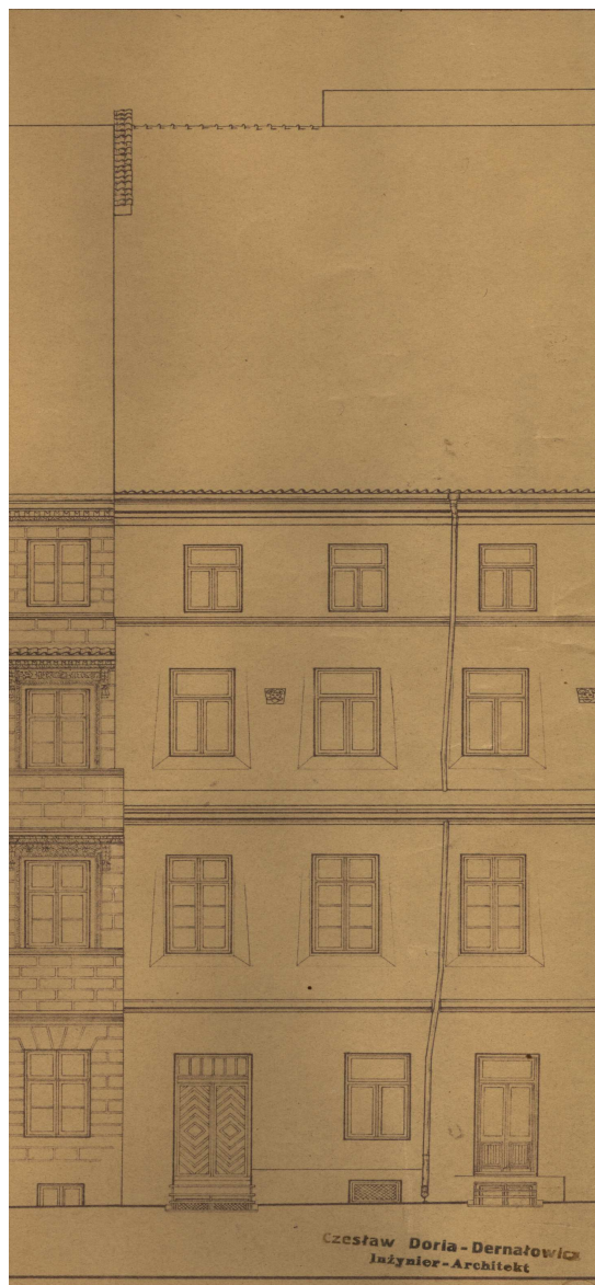
Rynek 11, autor Czesław Doria-Dernałowicz, 1936, własność rodziny, w depozycie Biblioteki Głównej Politechniki Lubelskiej.