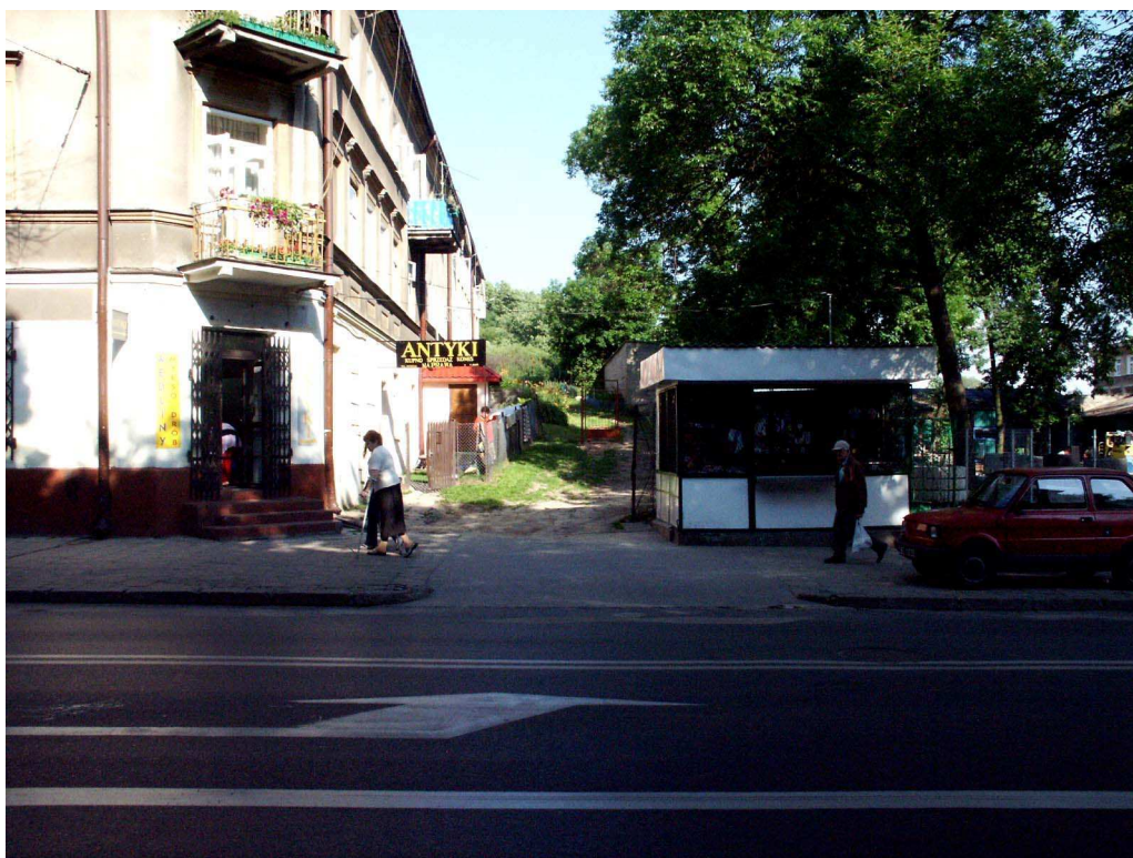
Fasada, Lubartowska 55, fot. Piotr Sztajdel, 2003.