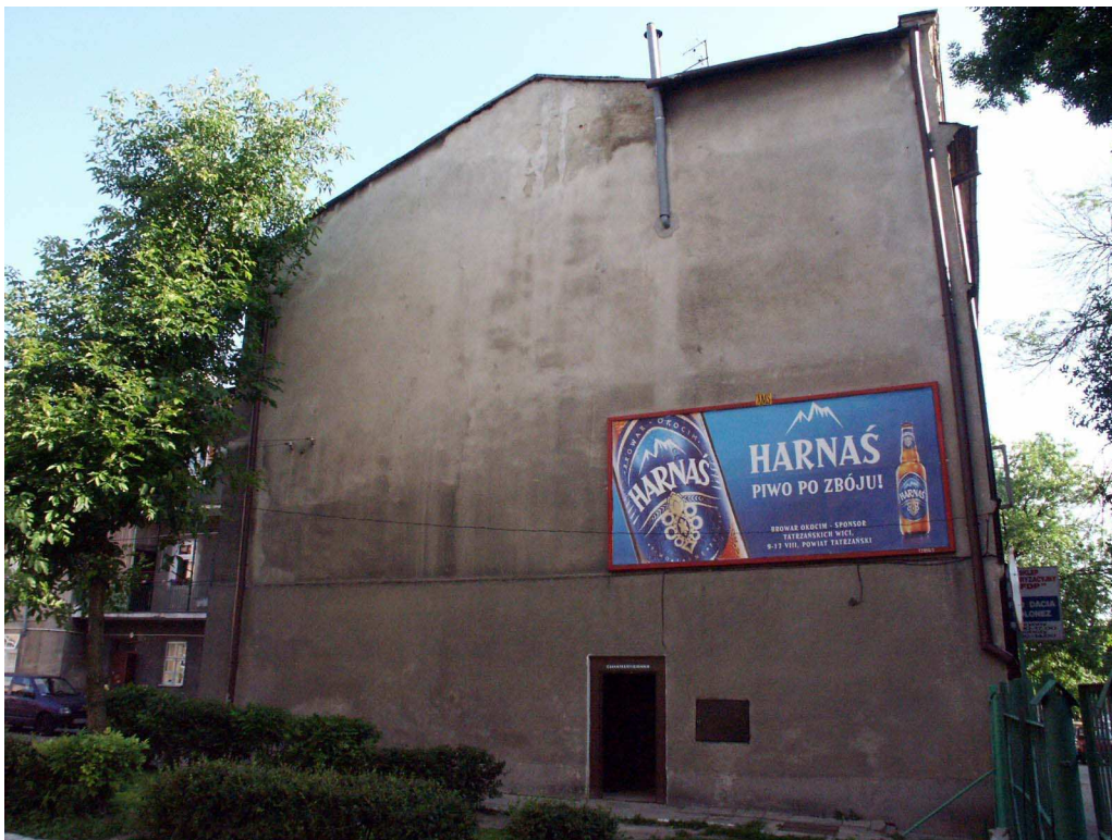
Lubartowska 55, fot. Piotr Sztajdel, 2003.