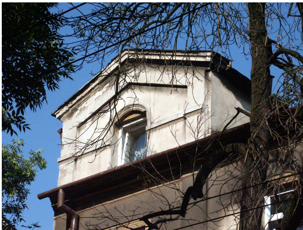
Fasada fragment, Lubartowska 55, fot. Piotr Sztajdel, 2003.