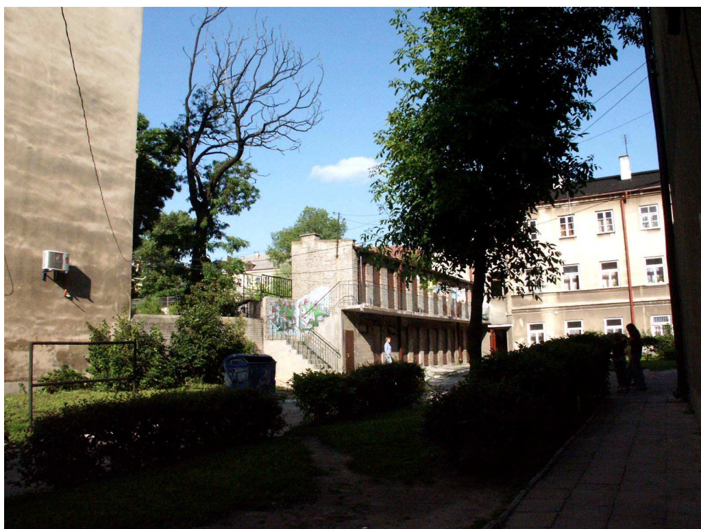
Podwórko, Lubartowska 55, 2003.