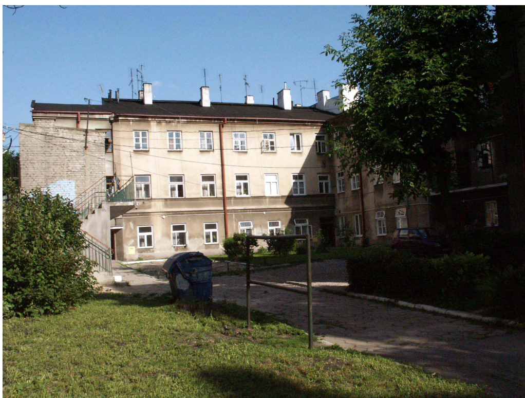
Podwórko, Lubartowska 55, 2003.