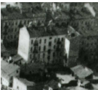
Fragment panoramy Lublina, lata 30., Lubartowska 29/A fragment of panorama of Lublin in the 1930s, Lubartowska 29,