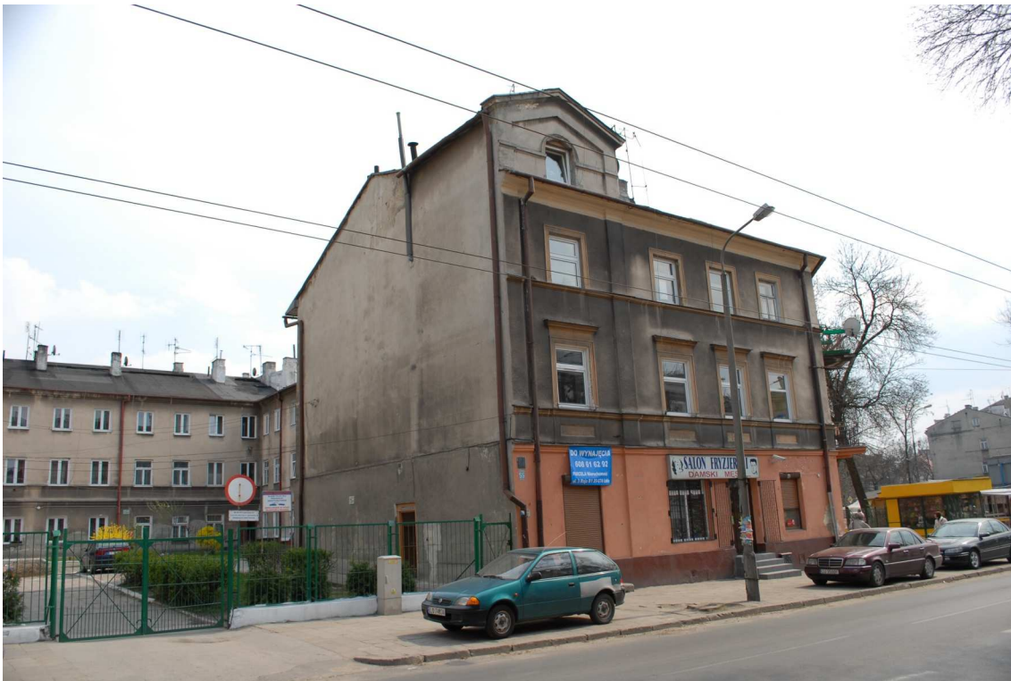
Fasada, Lubartowska 55, fot. Piotr Sztajdel, 2010.