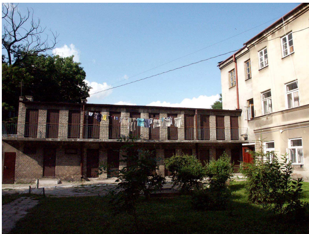
Podwórko, Lubartowska 55, fot. Piotr Sztajdel, 2003.