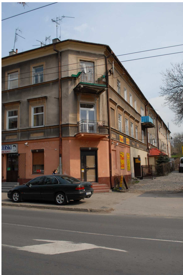
Fasada, Lubartowska 55, fot. Piotr Sztajdel, 2010.