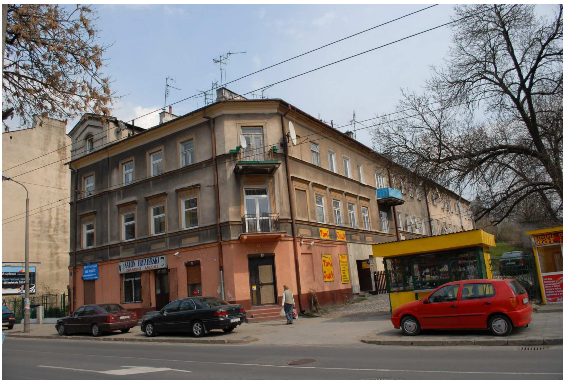
Fasada, Lubartowska 55, fot. Piotr Sztajdel, 2010.