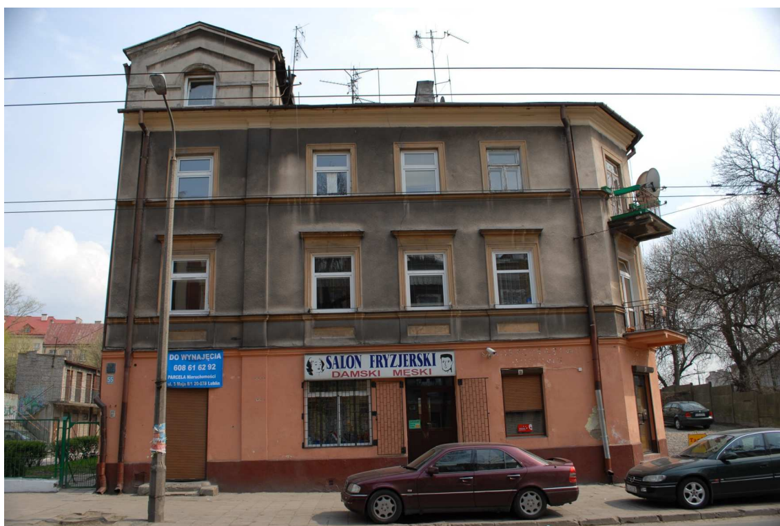
Fasada, Lubartowska 55, fot. Piotr Sztajdel, 2010.