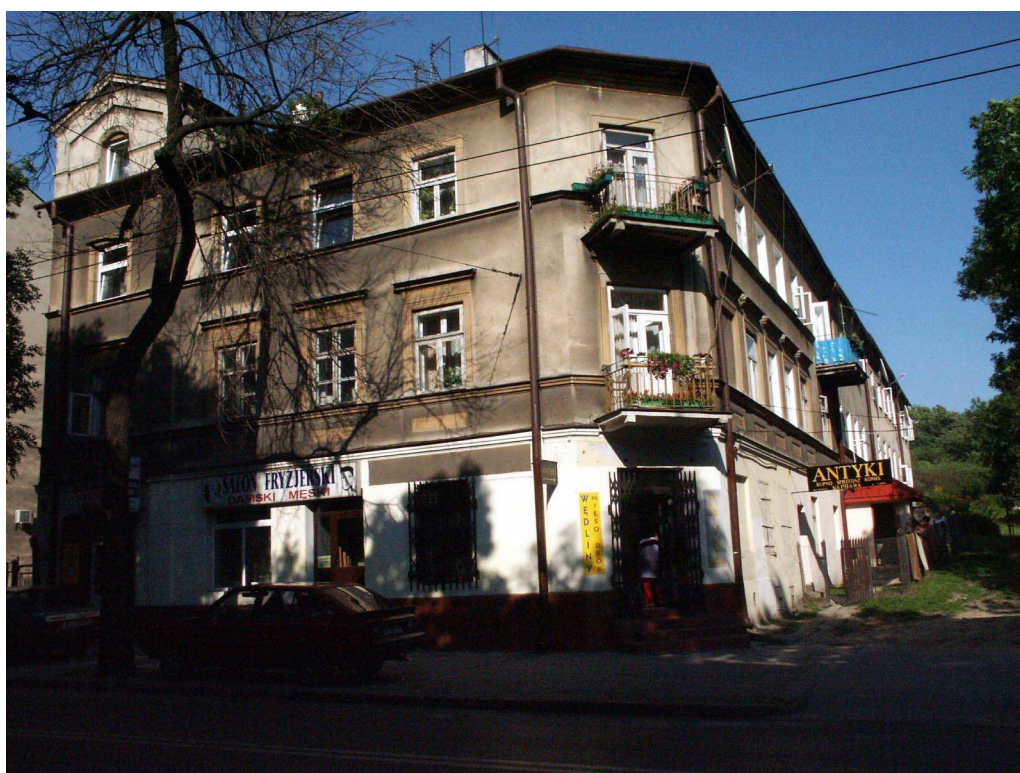
Fasada, Lubartowska 55, 2003.