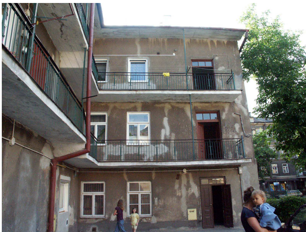
Podwórko, Lubartowska 55, fot. Piotr Sztajdel, 2003.