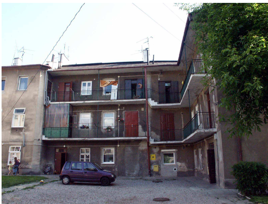
Podwórko, Lubartowska 55, fot. Piotr Sztajdel, 2003.