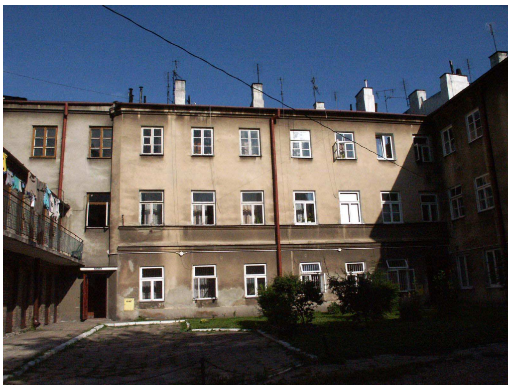
Podwórko, Lubartowska 55, 2003.