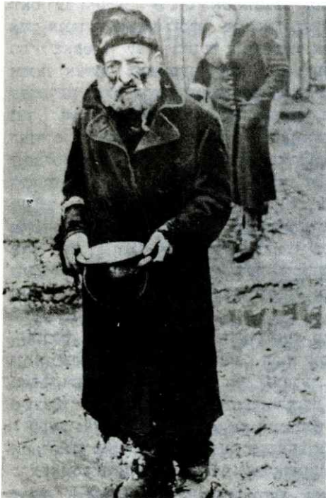
יהודי בגיטו לובלין (מתוך האלבוים "מקומות המרטרולוגיה והלחימה של יהודים על אדמת פולין, בשנים 1939 — 1945).