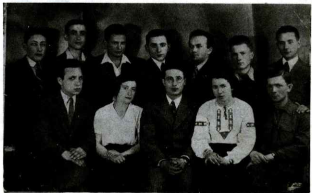
מועצת התרבות של החלוץ בלובלין, 1930. קולטור-ראט פון החלוץ אין לובלין, 1930.

די געשריייען און געלעכטער האָט מען געהערט אזש אויף דער גאס. דער רבי האָט אָפּגעצייילט וויפיל יעדער חסיד האט געכאפט — און אים געהייסן באצאָלן 5 זלאַטס פאר א שטיק. אזוי ארום האָט ער אָנגעזאמלט א גרויסע געלט-סומע אין מוזמן. ווער ס'האָט נישט געהאט קיין גרייט געלט, האָט אויסגעשטעלט א וועקסל, צאָלבאר דעם זעלבן טאָג. די וואָס האָבן באצאָלט