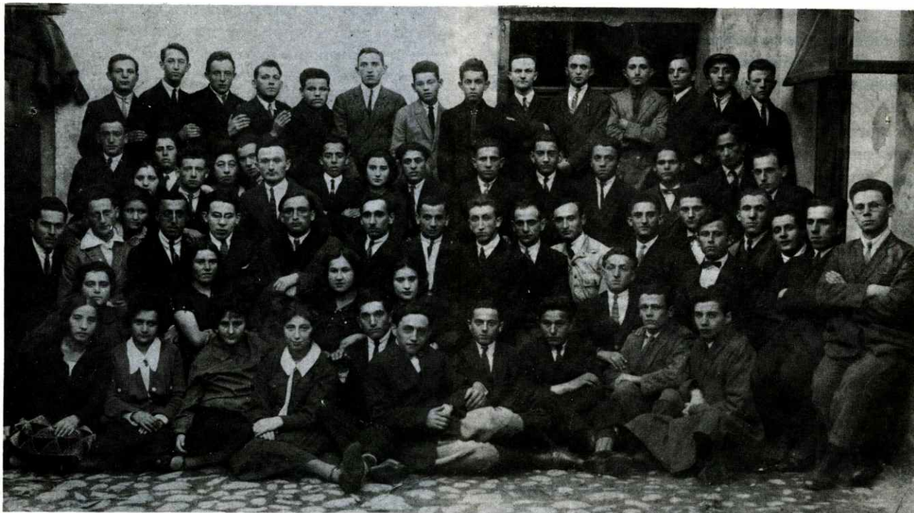
כנס חלוצים ל"הכשרה" בלובלין, 1925. ☆ חלוצים צו "הכשרה" אין לובלין, 1925.

געלויבט איז דער בורא-עולם פארן רוח-ממרום, דער געדאנק פון יח"ל שתחינו! און פארן געבן כוח און אויסהאלט און אויסדויער אויפן שווערן וועג פון רעאליזאציע, וקימנו!!! און פארן צוברענגען אונז צום גליקלעכן היינטיקן טאָג, ווען יח"ל ווערט געעפענט — והגיענו לזמן הזה!!!