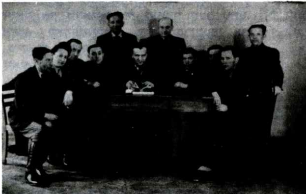
הוועד היהודי המחוזי בלובלין לאחר המלחמה. יידישער וואָיעוואָדישער קאָמיטעט אין לובלין נאָך דער באַפרייונג.

דאָס זענען נישט געווען די ערשטע, און אויך נישט די לעצטע מאָרדן פון דער שארית הפליטה אין לובלין, וועלכע ס'האָבן אזוי קאלטבליטיק און אכזר-יותדיק אדורכגעפירט די פוילישע אַנטי-סעמיטן.