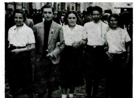
הפגנת ה'ו במאי של הליגה למען א"י העובדת 1932.

1 טע מאי דעמאָנסטראציע אין 1932 פון דער ליגע פארן ארבעטנדיקן ע"י אין לובלין.