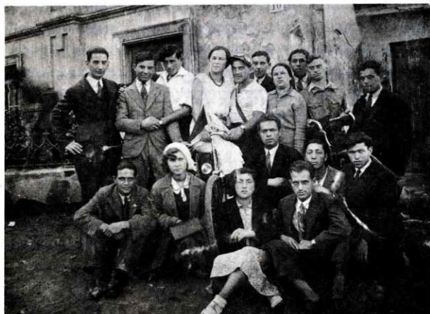
רוכבֿ-אופּניים מאַרץ-ישראל הגיע לחצר סטאַשיצא 10, בלובלין. אַ ראַוועריסט פון א״י אויף סטאַשיצא גאס 10, אין לובלין.

ביים סוף פון דער יידן-גאס האָט זיך אָנגעהויבן די ראַשע-גאס (רוסקא), וואָס האָט געפירט צו דער לעווערטאָווער גאס (לובאַרטאָווסקא) — די לענגסטע גאס פֿון דער יידישער געגנט, די גרעסטע האַנדלס-גאס פון דער יידישער באַפעלקער־