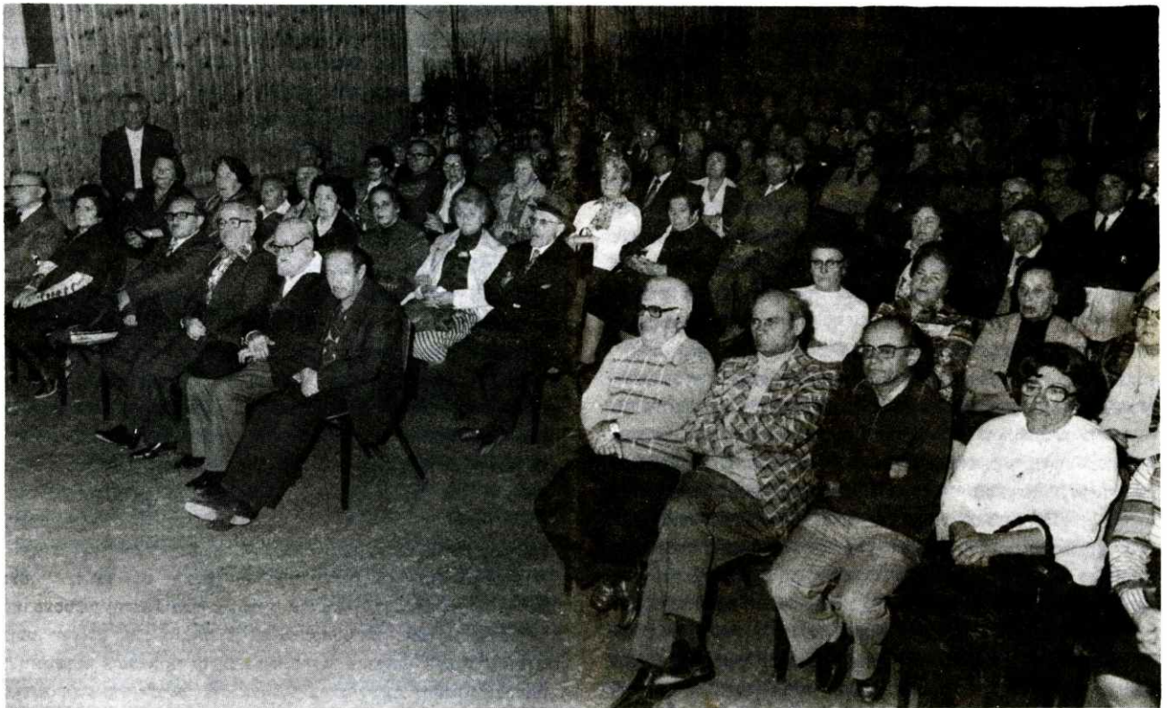
חלק מן הקהל באזכרה לקדושי לובלין ב-21.11.78 בתל-אביב, א טייל פון לובלינער עולם אויפן יזכור-אָוונט אין תל-אביב, 21.11.78.

3 וואָכן האָט געדויערט די אויסזידלונג פון די געכאפטע יידן. טאָג-טעגלעך זענען אין די וואַגאָנען ארויסגעפירט געוואָרן אין בעלושעץ 1,500 קרבנות. די 0.0-באנדיטן האָבן זיך באנוצט מיט דער הילף פון דעם אלפאָנס שמאי גרייער, פון וויצע-פרעזענט פון יודענראט קעסטענבערג און מיטגליד פון יודענראט עדעלשטיין. זיי פלעגן באַרוואַקן די פארבליבענע יידן, אז די ארויסגעשיקטע געפונען זיך אין ראָוונע, פּינסק און אין אנדערע שטעט אויף די קרעסן, וווּ די אָרטיקע יודענראטן האָבן זיי איינגעאַרדנט אויף ארבעט און אפילו געבראכט "לעבעדיקע" גרוסן פון די אויסגעזידלטע, אז שולדיק אין דער אקציע איז... דער לובלינער יודענראט, וועלכער האָט נישט אויסגעפירט