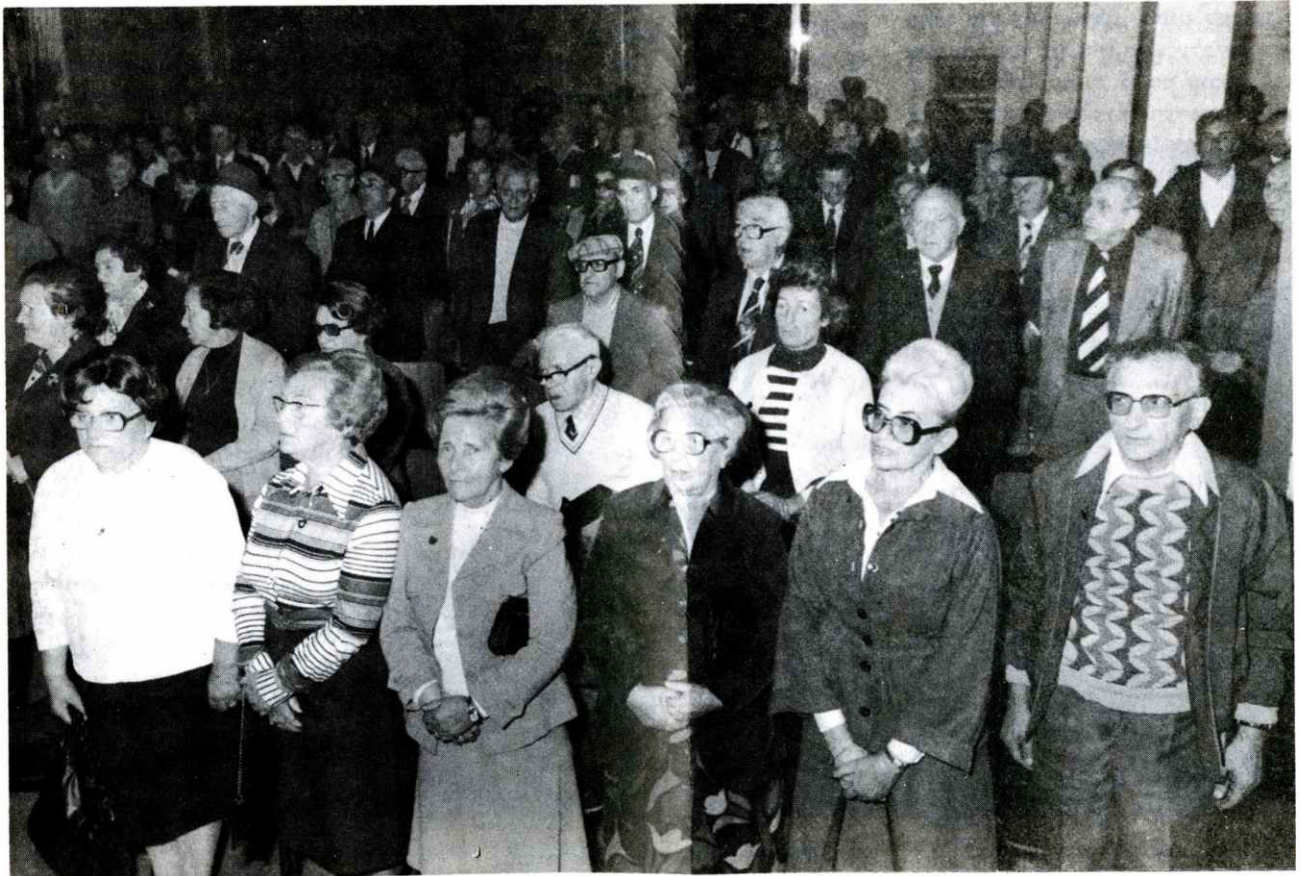
חלק מן הקהל באזכרה לקדושי לובלין ב־21.11.78 בתל-אביב. א טייל פון לובלינער עולם אויפן יזכור-אָוונט אין תל-אביב, 21.11.78