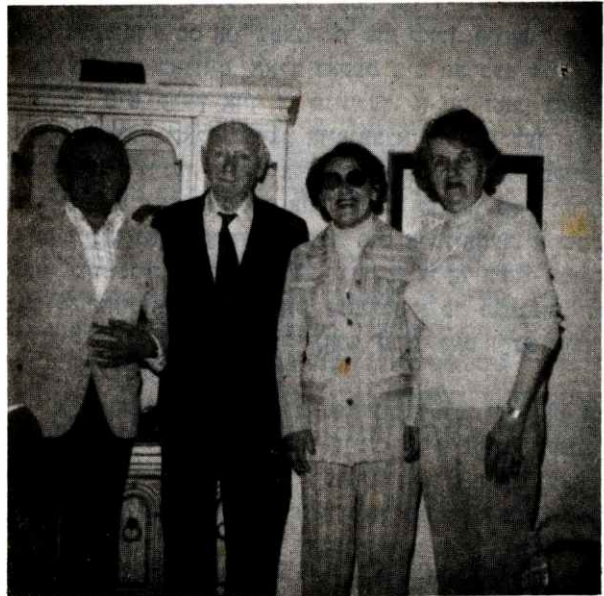
דער נאכעל-פרייז טרעגער יצחק באשעוויס-זינגער (דער צווייטער לינקס) מיט זיין פרוי (די ערשטע רעכטס) האבן זיך געטראפן מיט א צייט צוריק מיט אונדזרע בני-יעיר באלטשע און ישראל אייזענבערג אין מיאמי.