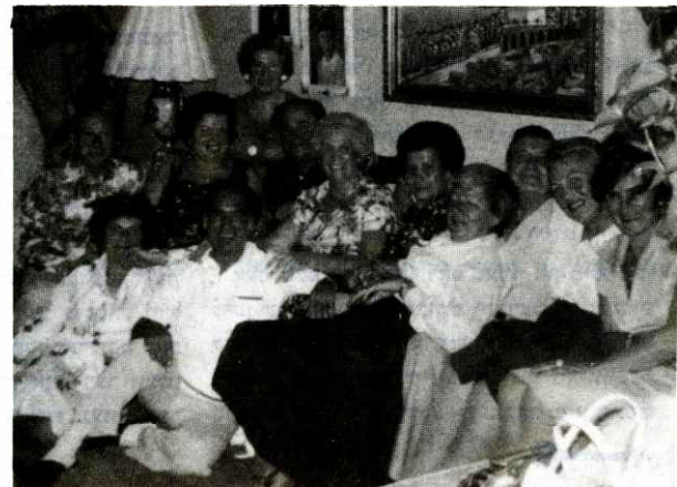
אויפנאמע פאר פאָלע און סוכער פאכטשאש אין מאָנטרעאל (אויפן בילד רעכטס) און אין טאָראָנטאָ