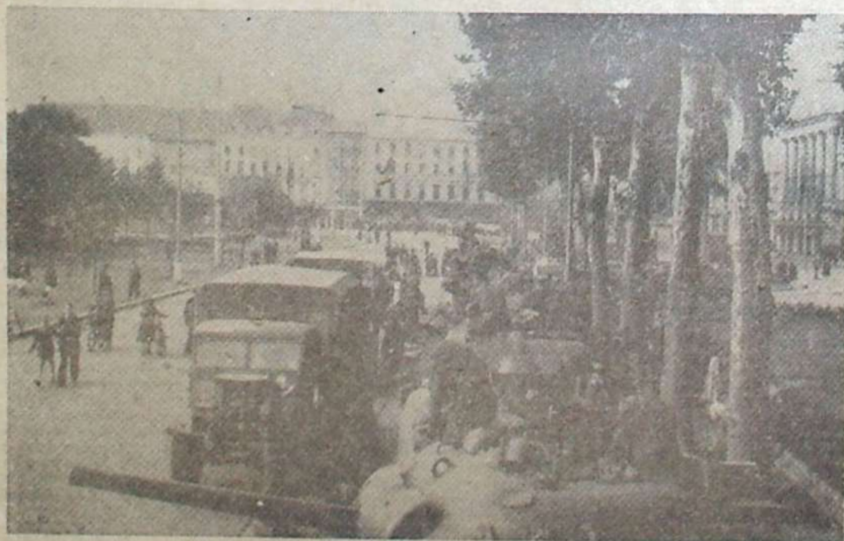
Czołgi 24 pułku ulanów na ulicach Gandawy