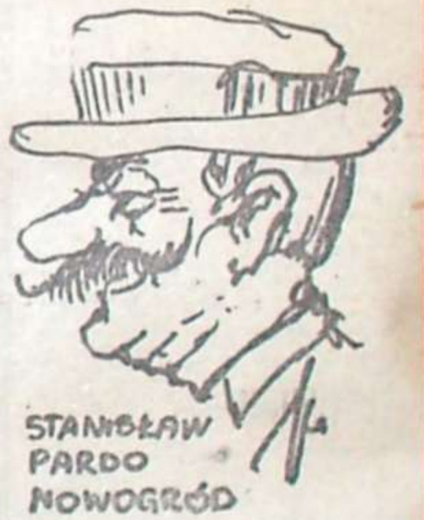
STANISŁAW PARDO NOWOGRÓD