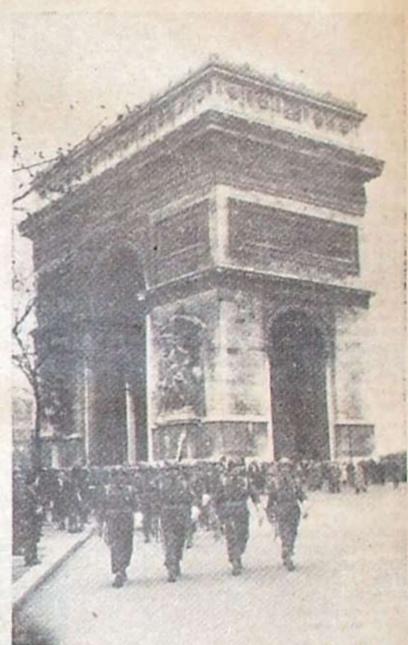
Szwadron honorowy 24 pułku ulanów reprezentował 1 D Panc. na defiladzie zwycięstwa w Paryżu

Rejon walk zamienił się w straszliwe pobojowisko, o którym dziennikarz angielski w wojskowym piśmie brytyjskim „Tank” napisał: Spośród pol bi-