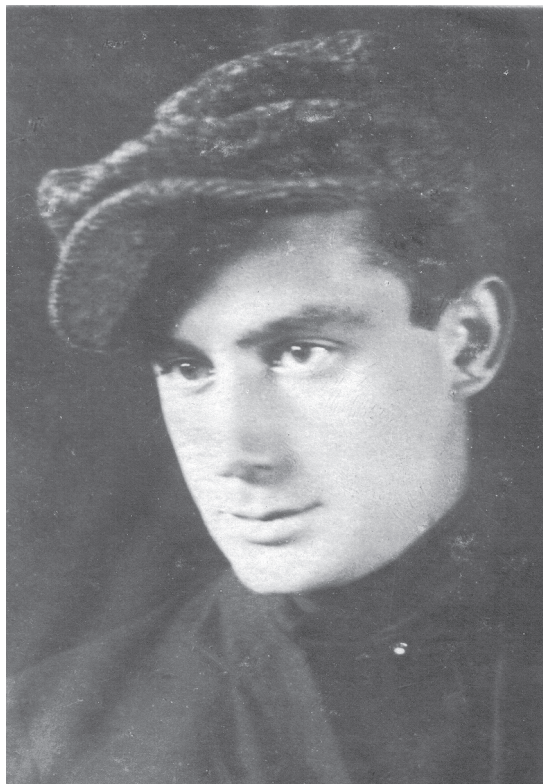
3. Władysław Ukleja, lata 20. XX wieku.

Ukleja wielokrotnie portretował Wandę. Na jednym z portretów z 1939 roku (ryc. XXXI – kolorowa wkładka) w mistrzowski sposób ukazał jej urodę, subtelność, a nade wszystko własny do niej stosunek, pełen tkliwości i uczucia. Artysta zatrzymał na płótnie jej zamyśloną, pełną powagi, subtelną twarz i zgrabną siedzącą postać. Mimo akordu turkusowo-błękitnego ubioru, stanowiącego centrum kompozycji, uwagę widza przyciąga oblicze dziewczyny i jej tajemnicze, zamyślane spojrzenie. Błękitne, smutne oczy, wyraźnie podkreślone łukami regularnych brwi, spoglądające w dal, jak gdyby ponad otaczającą ją rzeczywistością, wyrażają na-