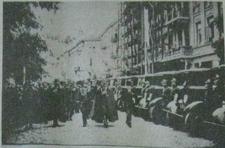
uroczyście przekazanie wojsku 2 kolon samochodów sanitarnych ufundowanych przez Zarząd Okręgu Lubelskiego PCK, od prawej wojewoda lubelski J. de Tramboort, marszałek E. Śmigły-Rydz, d-ca Okręgu Korpusu nr II gen. M. Smorawiński, ul. Narutowicza, Lublin 4 VI 1939 r.