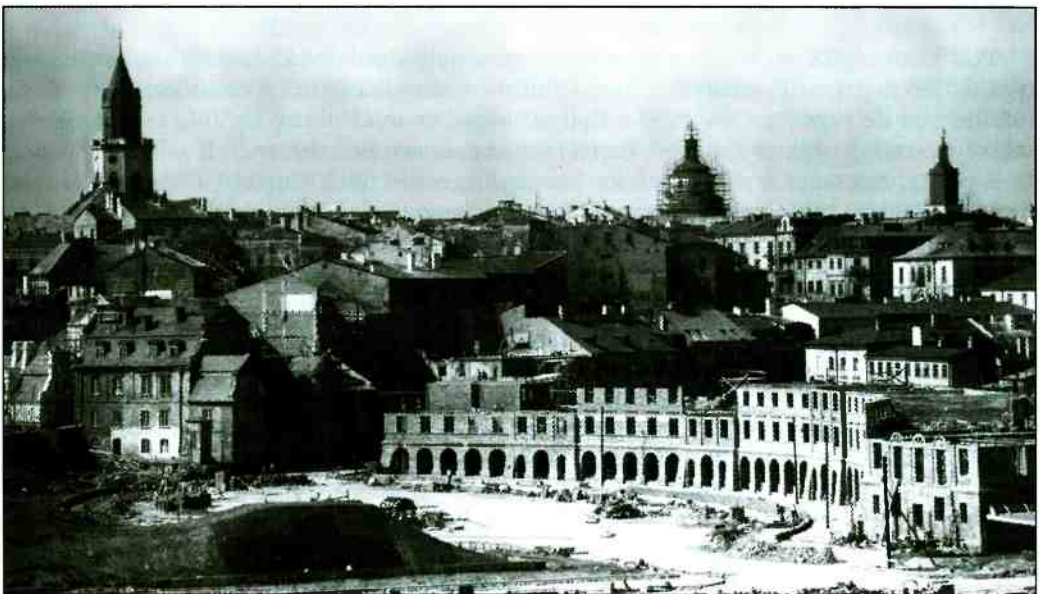
Przebudowa Placu Zamkowego w 1954 r.