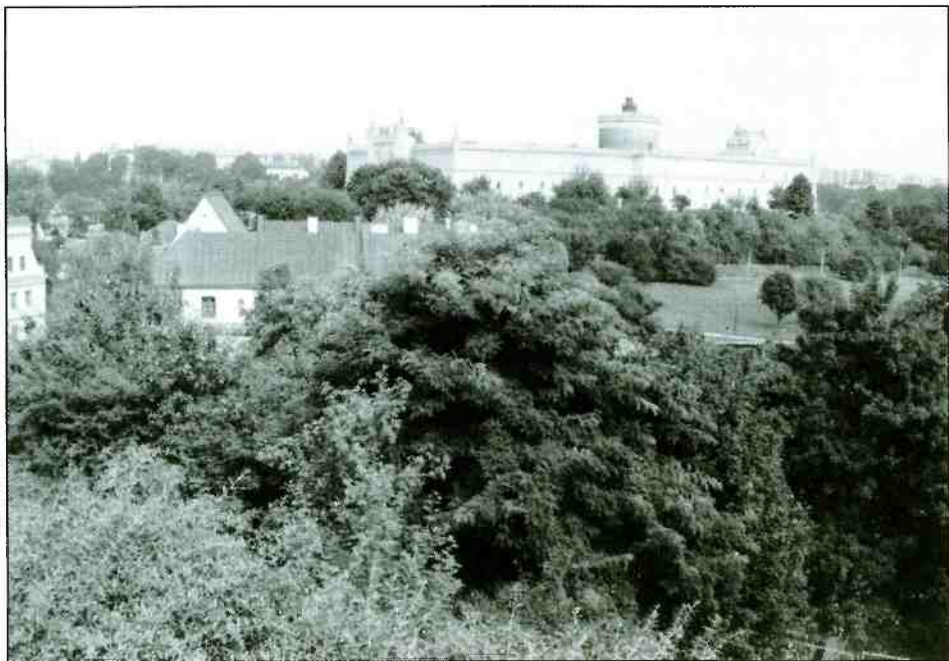
Podzamcze, lata 90.