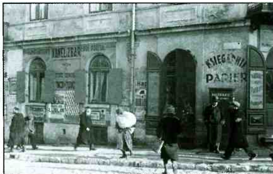
Lublin, ul. Nowa, 1938 r.