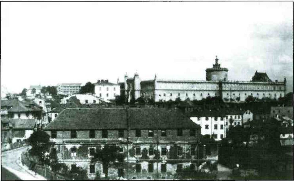
Podzamcze, lata 30., autor nieznanym

2. Jakie różnice zauważasz pomiędzy przedstawioną na dwóch różnych zdjęciach tą samą dzielnicą miasta?