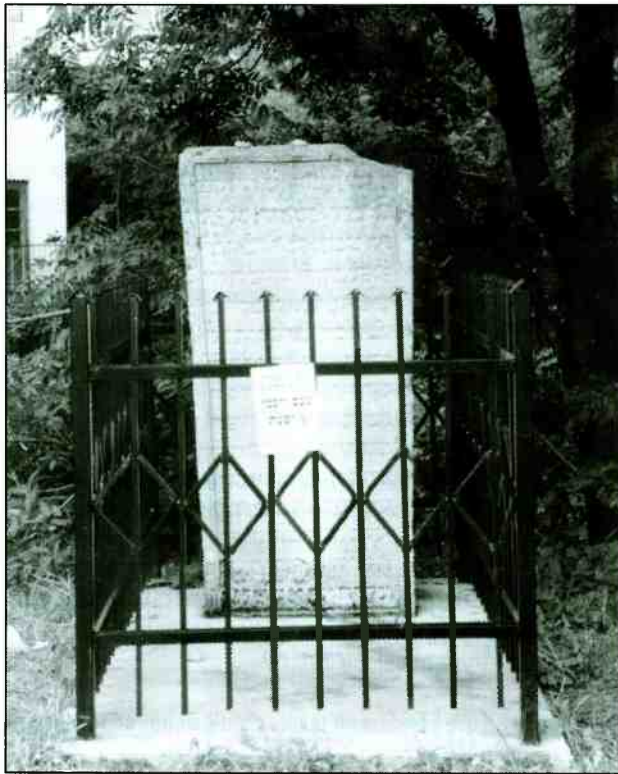
Stary Kirkut na Kalinowszczyźnie, nagrobek rabina Kopelmana, stan obecny

Stary kirkut odwiedzają rokrocznie liczne rzesze turystów, pielgrzymujące do grobu Jaakowa Icchaka Horowitza zwanego Widzącym z Lublina (1745-1815), cadyka, którego zwolennicy przypisywali mu zdolność jasnowidzenia i przepowiadania przyszłości. Tutaj można odnaleźć liczne kwitlech , pisane w różnych językach. To tutaj znajduje się najstarsza kamienna macewa w Polsce, pochodząca z 1541 r., na grobie wielkiego talmudysty Jaakowa Kopelmana. Sąsiaduje z nią nagrobek kantora Abrahama ben Uszaja, zmarłego w 1543 r. Innym cennym nagrobkiem jest macewa założyciela i rektora jesziwy lubelskiej rabina Szaloma Szachny (z 1558 r.). Pochówki odbywały się tutaj od XVI w. do ok. 1868 r., później - już tylko na nowym cmentarzu przy ulicy Walecznych. Dewastacja obiektu rozpoczęła się jeszcze w czasie zaborów, ale na dużą skalę - dopiero od czasów drugiej wojny. Większość nagrobków została bezpowrotnie zniszczona.