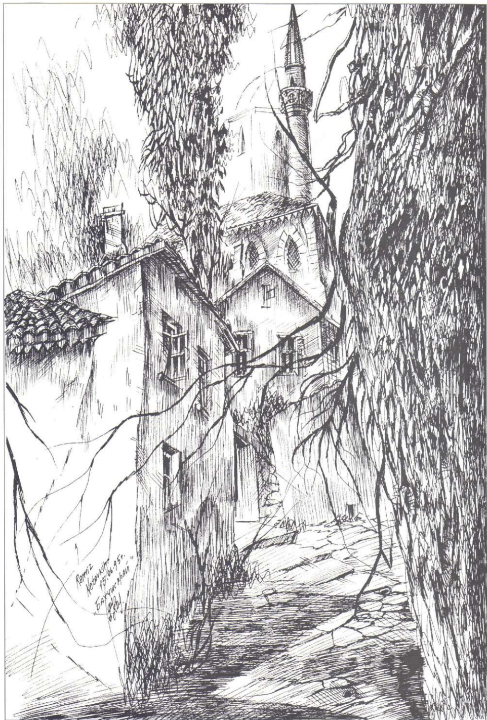
ULICZKA W BACHCHYSARAJU