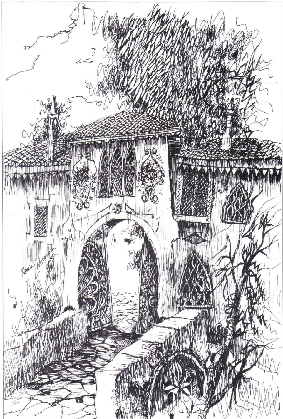
BRAMA PALACU CHANA