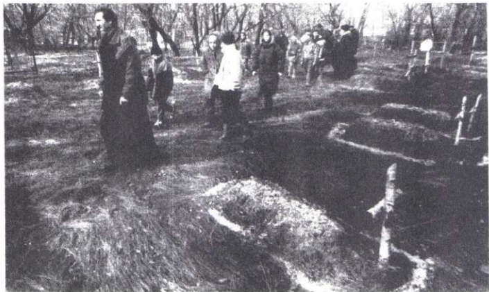
Cmentarz w Starobielsku