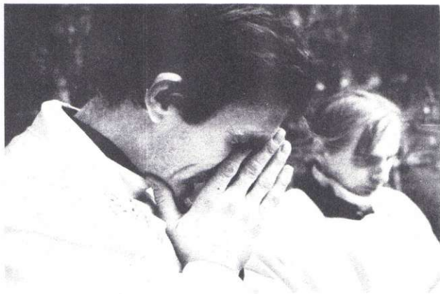
Cmentarz w Starobielsku