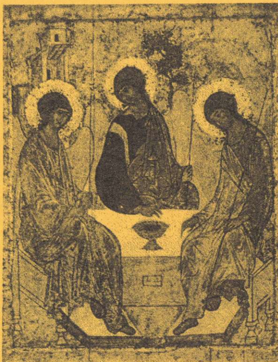
Andriej Rublow, Św. Trójca