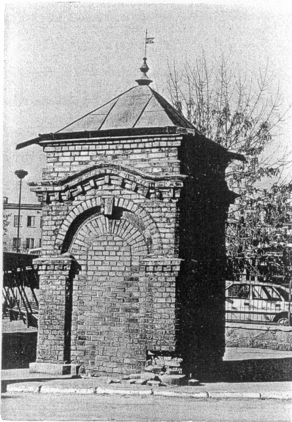
3. Zdrój na placu dworcowym PKS, widok od wschodu. Fot. J. Studziński, 1995; neg. w posiad. PSOZ.