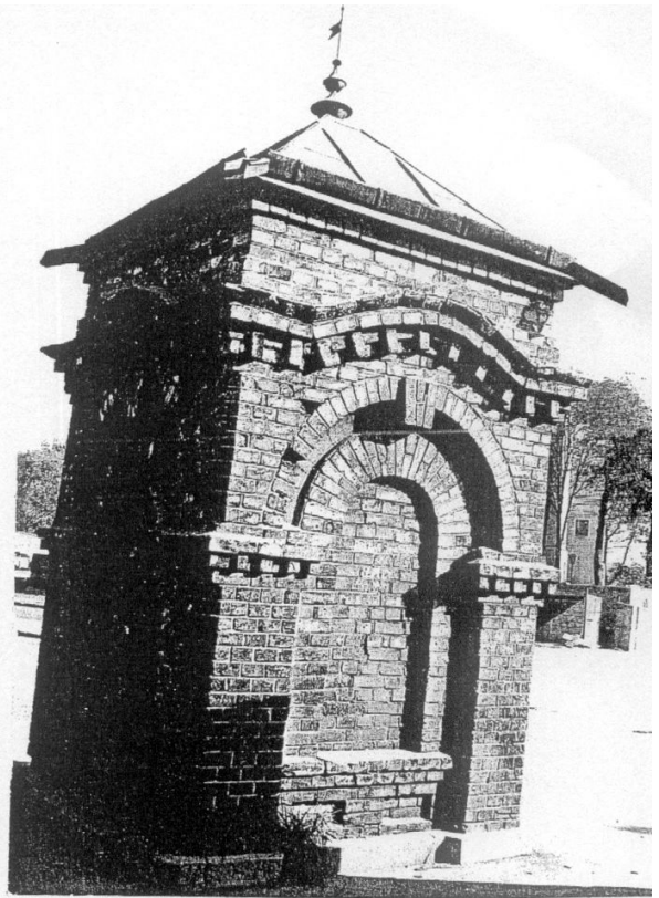
2. Zdrój na placu dworcowym PKS z 1865 r., widok od pld. zachodu. 1995