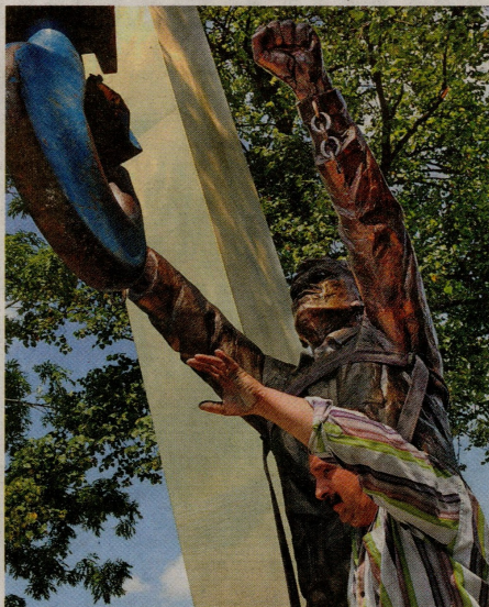
Nowy pomnik Wdzięczności przy dawnych LZNS