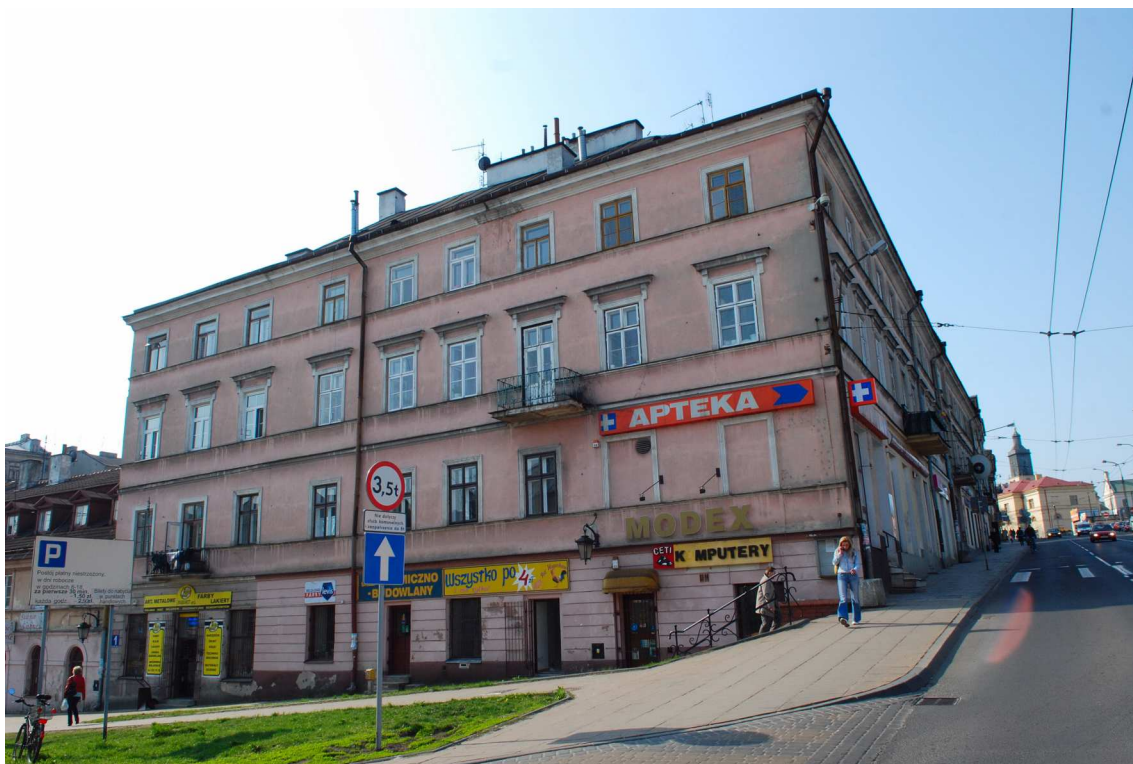
Fasada, Kowalska 1, fot. Marcin Moszyński, 2010.