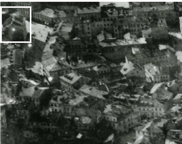
Fragment panoramy Lublina, lata 30., ul. Kowalska/A fragment of panorama of Lublin in the 1930s, Kowalska street,