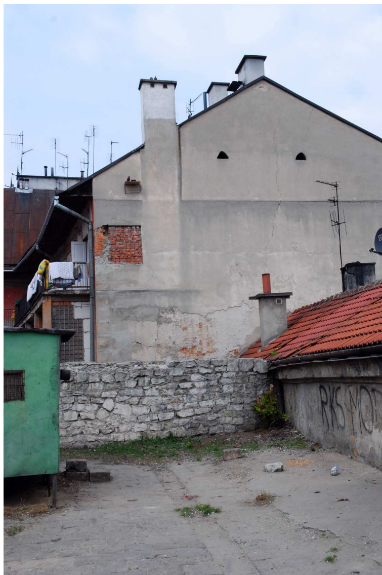
Kowalska 1, fot. Marcin Moszyński, 2010.