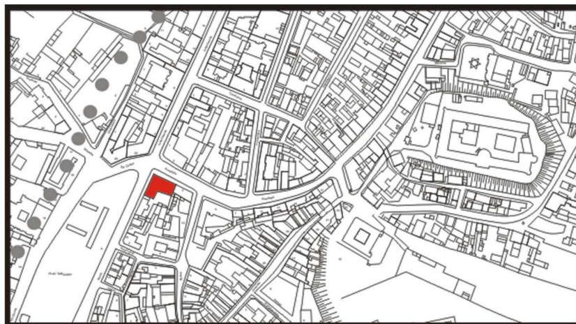
LOKALIZACJA NIERUCHOMOZCI - Kowalska 1 LOCATION OF THE PROPERTY - Kowalska 1