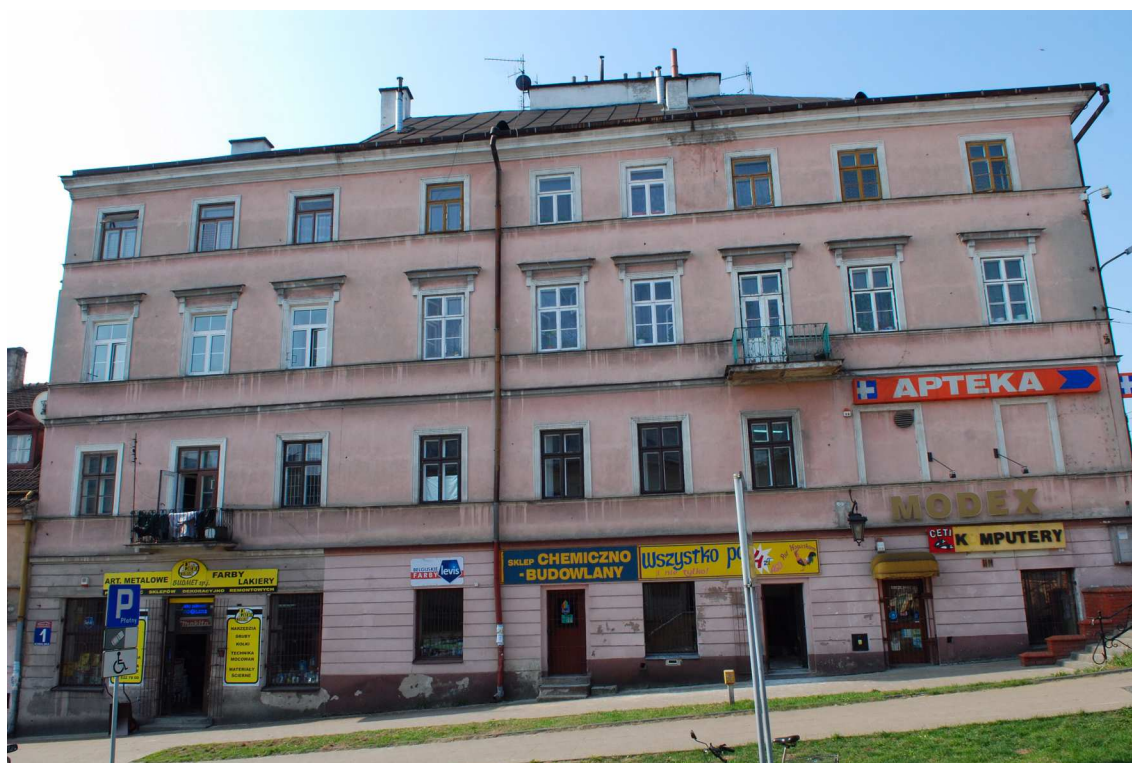
Fasada, Kowalska 1, 2010.