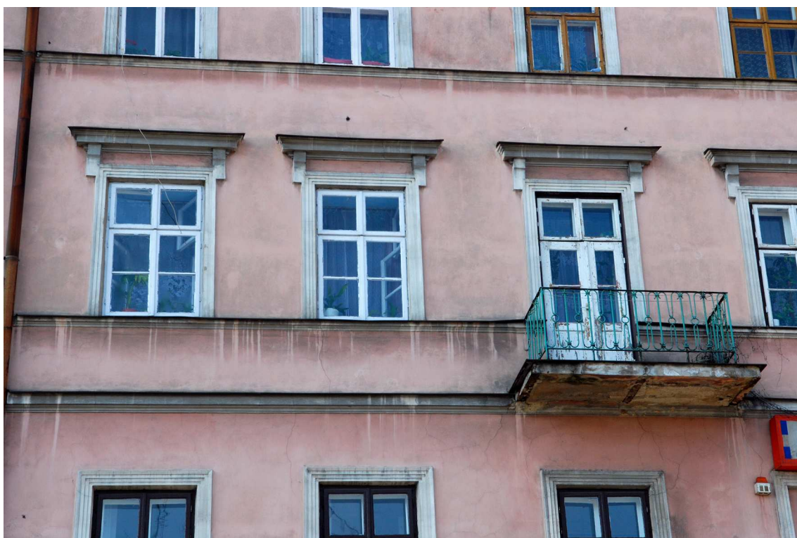
Fasada fragment, Kowalska 1, fot. Marcin Moszyński, 2010.