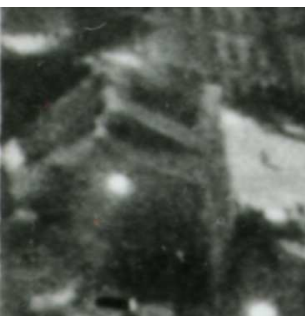
Fragment panoramy Lublina, lata 30., Kowalska 1/A fragment of panorama of Lublin in the 1930s, Kowalska 1,