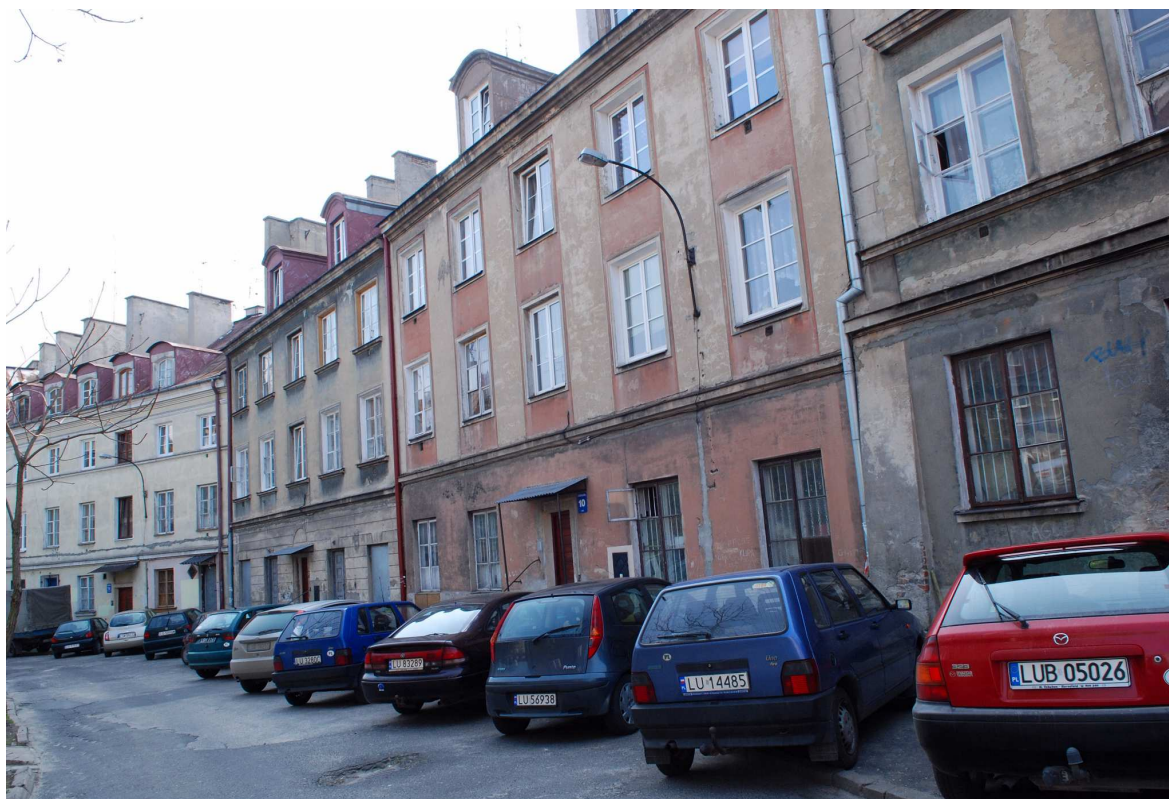
Elewacja tylna, Kowalska 10, fot. Marcin Moszyński, 2010.