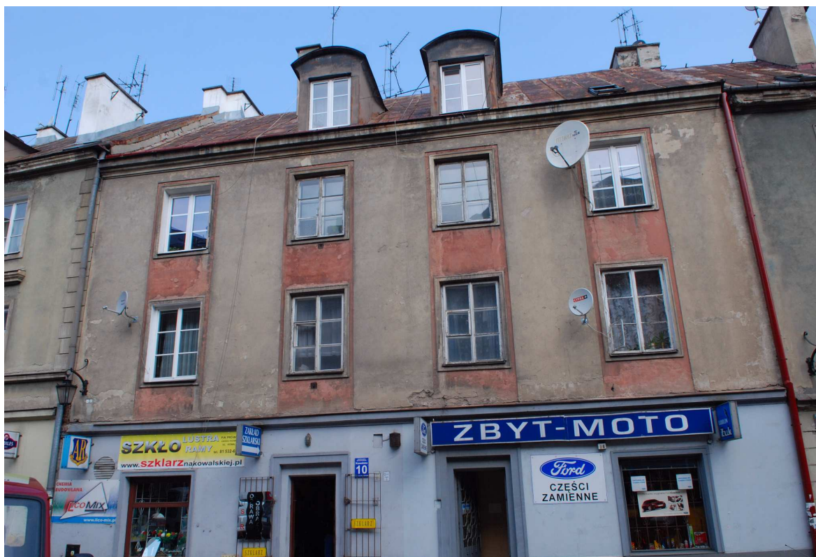
Fasada, Kowalska 10, fot. Marcin Moszyński, 2010.