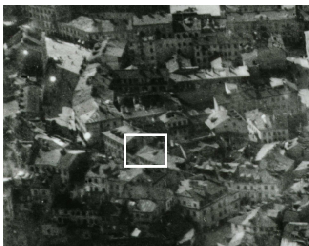
Fragment panoramy Lublina, lata 30., ul. Kowalska/A fragment of panorama of Lublin in the 1930s, Kowalska street,