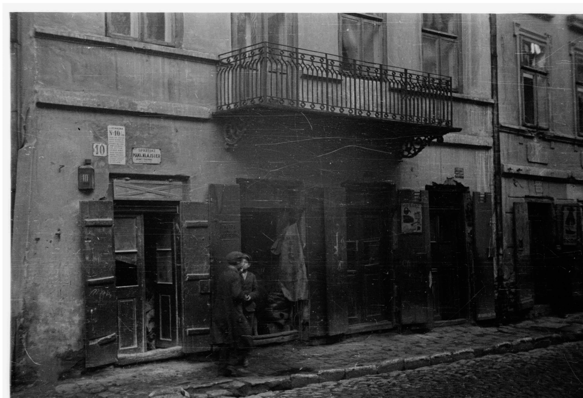
Kowalska 10, autor Stefan Kielsznia, 1938, zbiory fotografii Jerzego Kielszni.