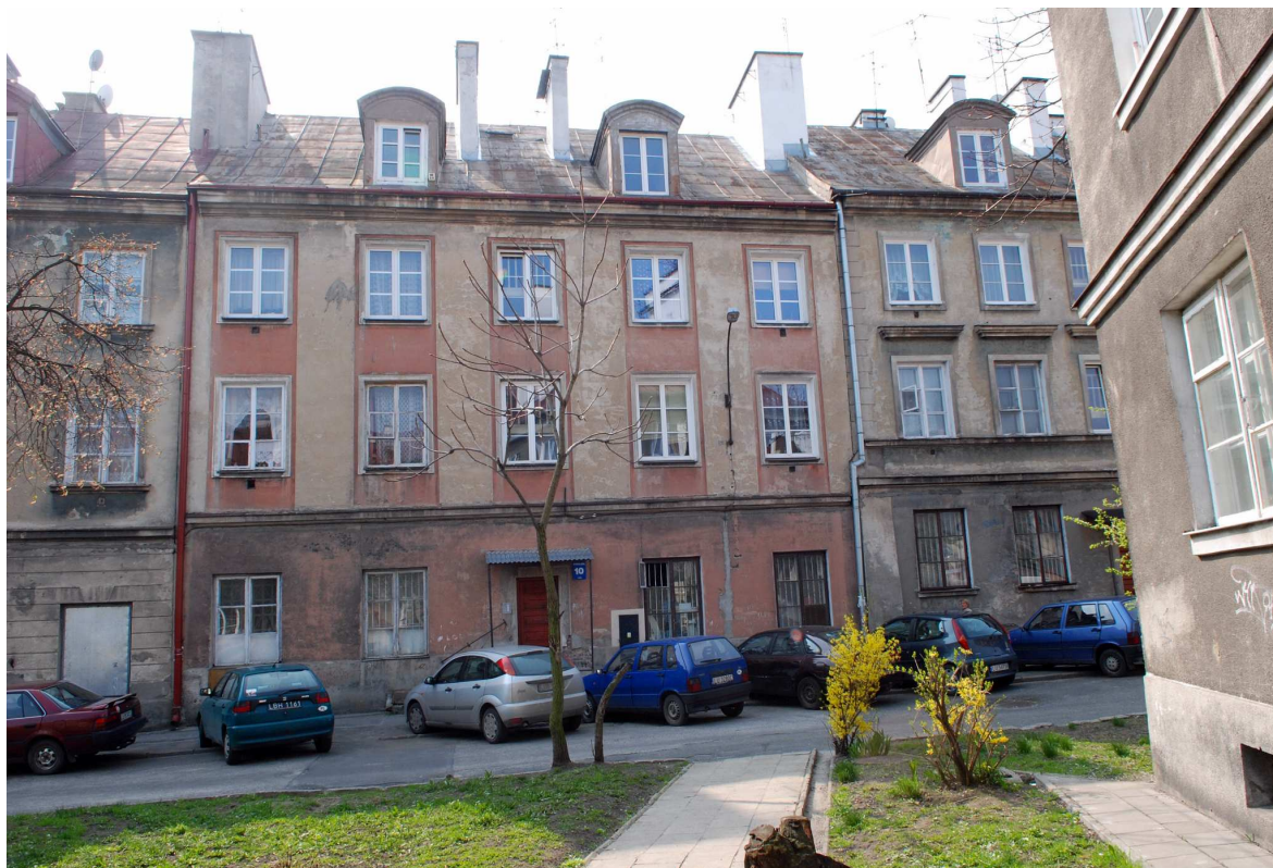
Elewacja tylna, Kowalska 10, fot. Marcin Moszyński, 2010.