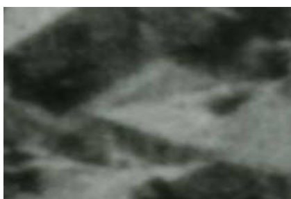
Fragment panoramy Lublina, lata 30., Kowalska 10/A fragment of panorama of Lublin in the 1930s, Kowalska 10,