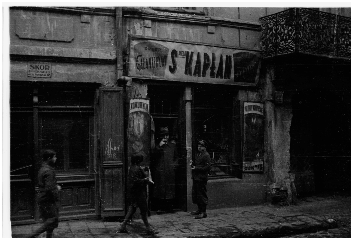
Kowalska 12, autor Stefan Kielsznia, 1938, zbiory fotografii Jerzego Kielszni.