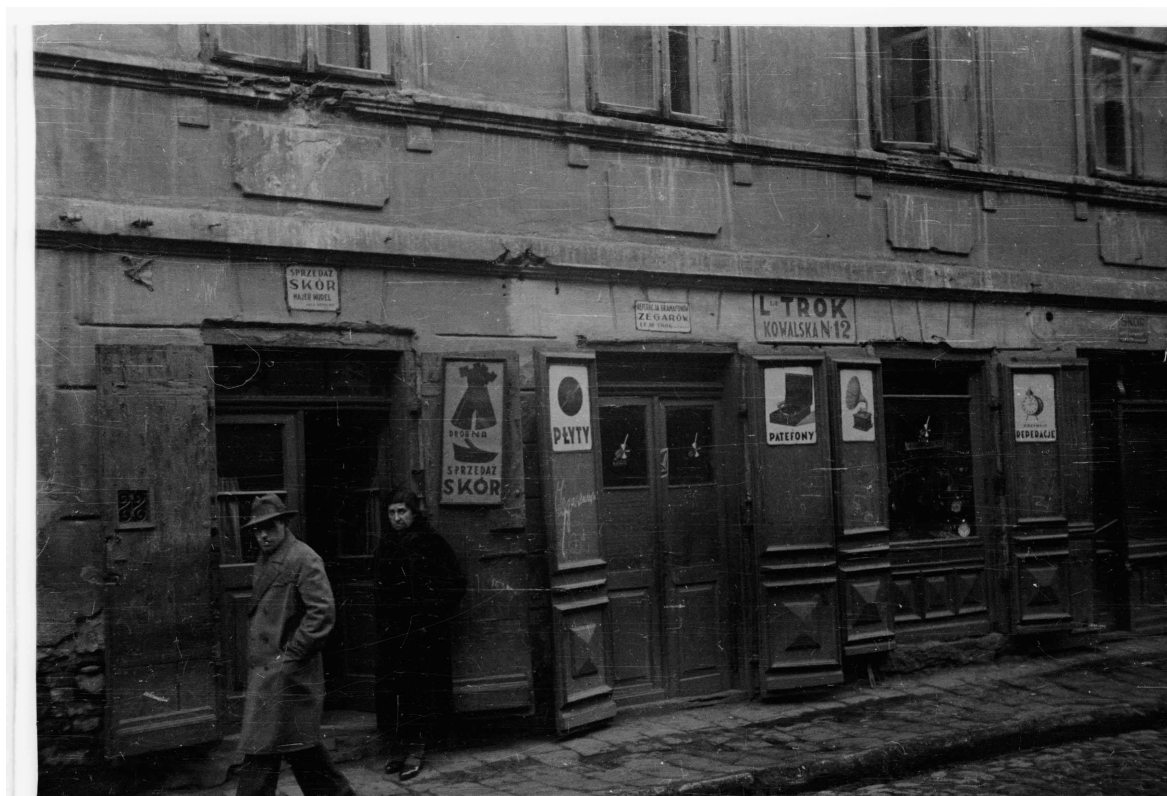
Kowalska 12, autor Stefan Kielsznia, 1938, zbiory fotografii Jerzego Kielszni.