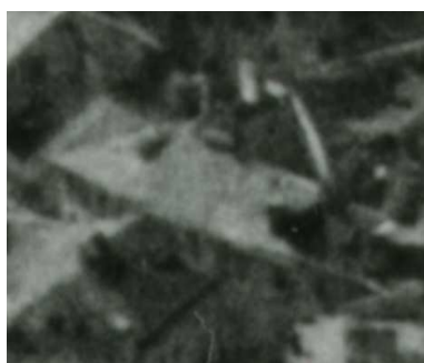
Fragment panoramy Lublina, lata 30., Kowalska 12/A fragment of panorama of Lublin in the 1930s, Kowalska 12,