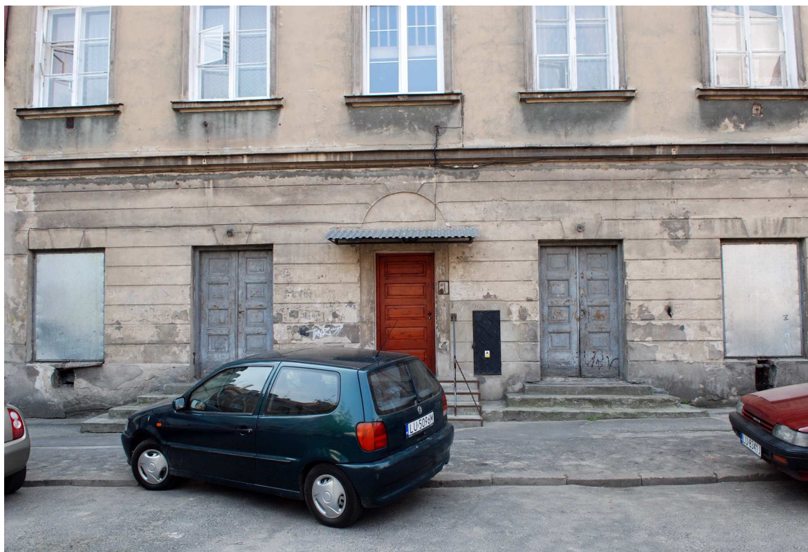
Elewacja tylna, przyziemie, Kowalska 12, 2010.