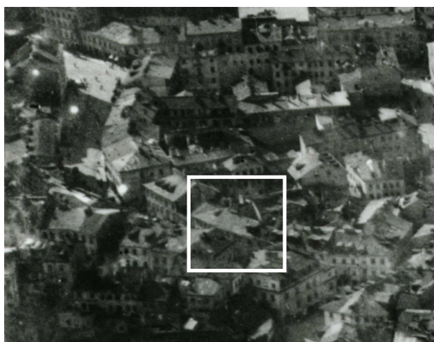
Fragment panoramy Lublina, lata 30., ul. Kowalska/A fragment of panorama of Lublin in the 1930s, Kowalska street,