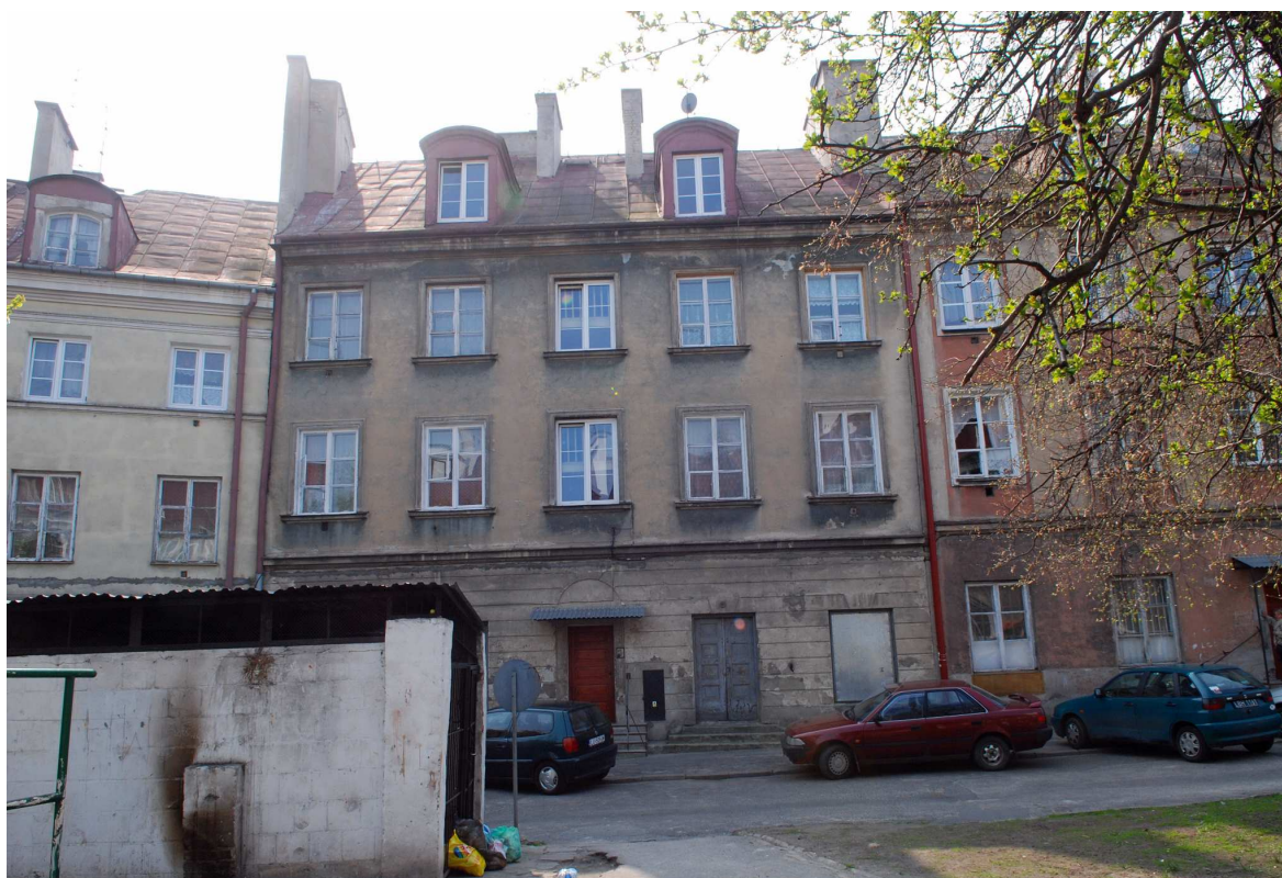
Elewacja tylna, Kowalska 12, fot. Marcin Moszyński, 2010.