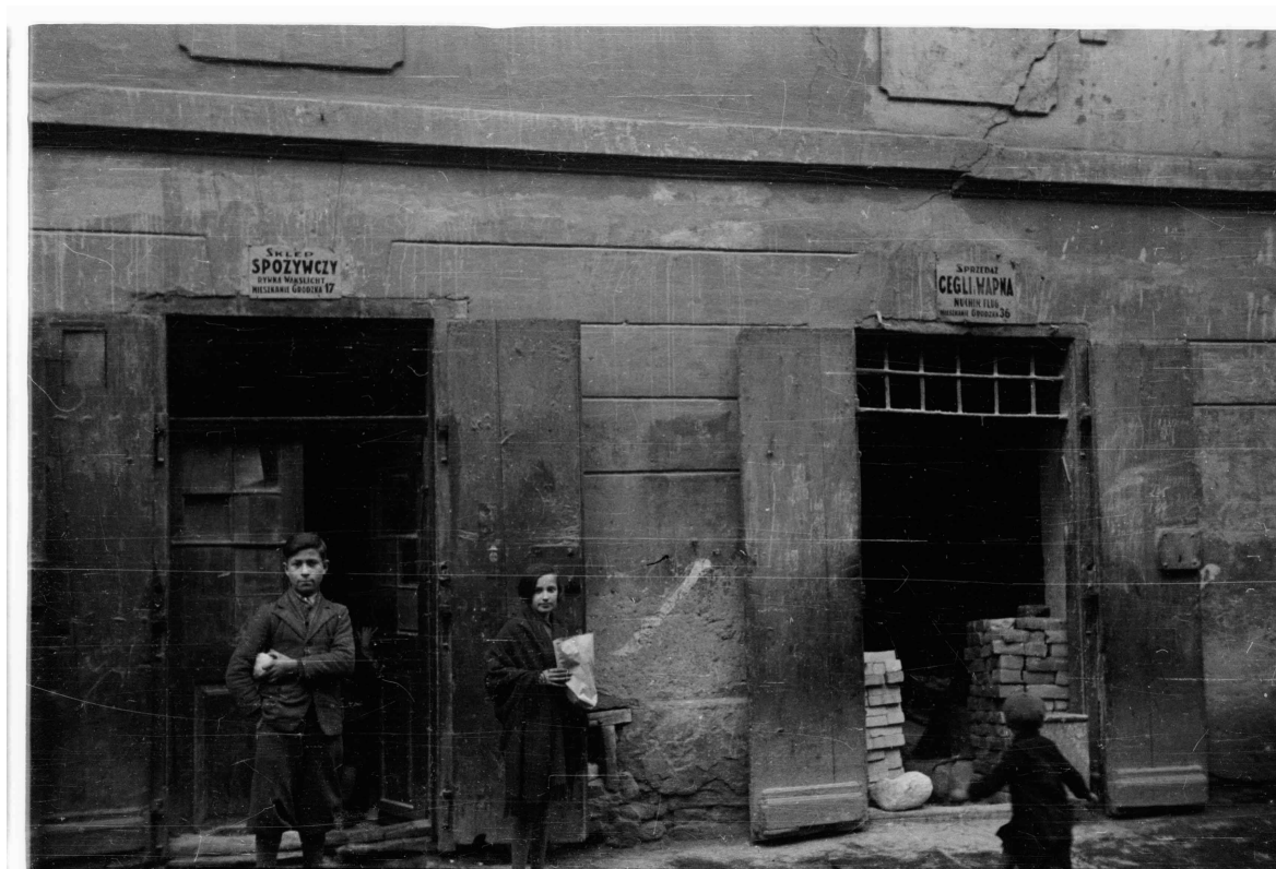
Kowalska 12, autor Stefan Kielsznia, 1938, zbiory fotografii Jerzego Kielszni.