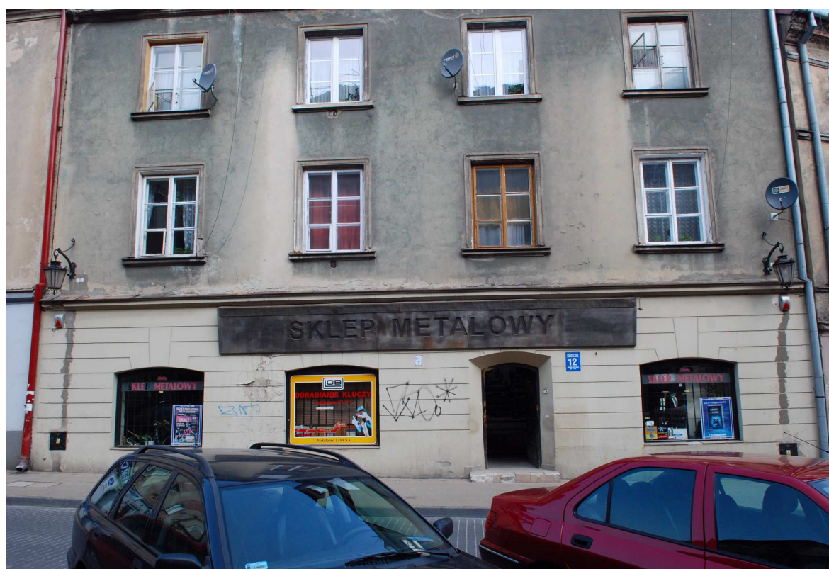
Fasada, Kowalska 12, fot. Marcin Moszyński, 2010.