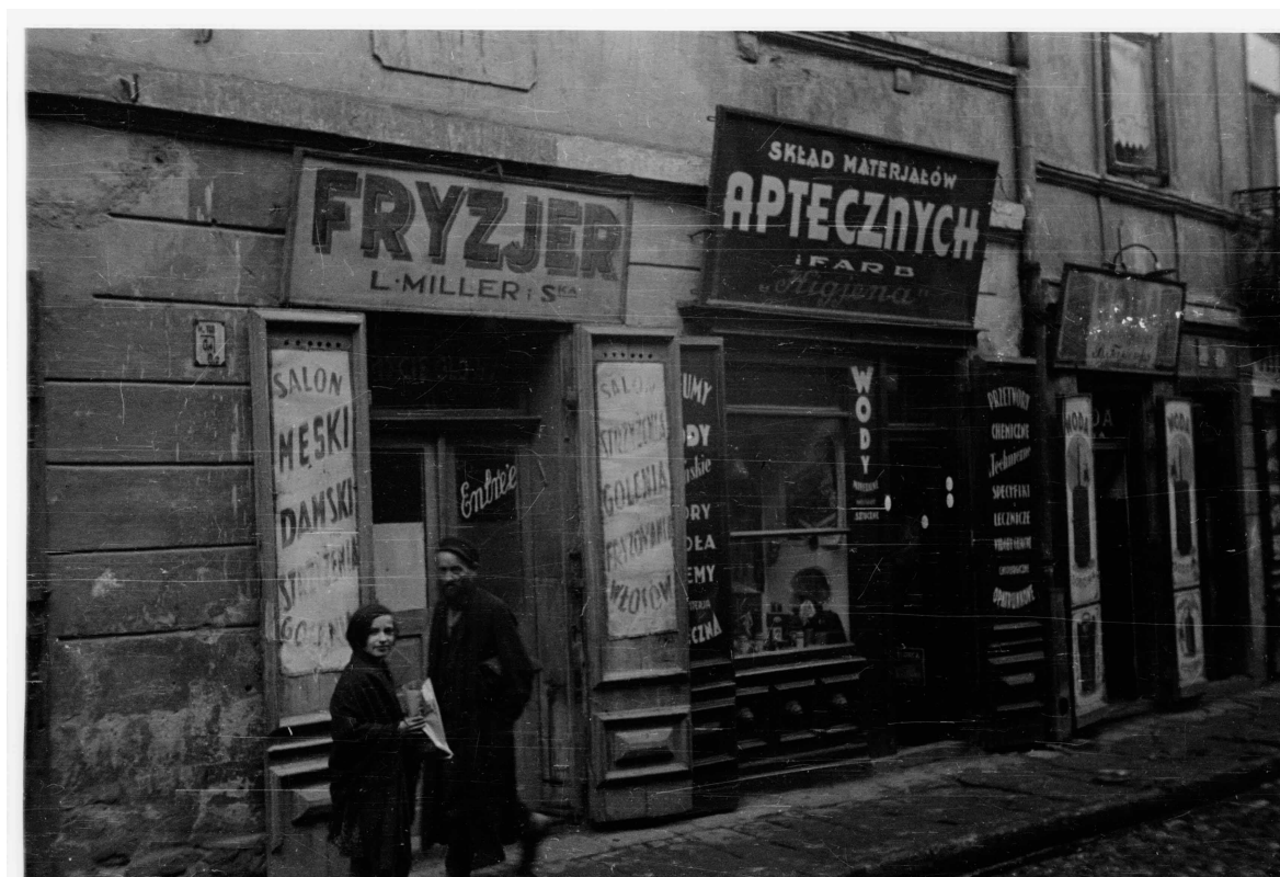
Kowalska 12, autor Stefan Kielsznia, 1938, zbiory fotografii Jerzego Kielszni.