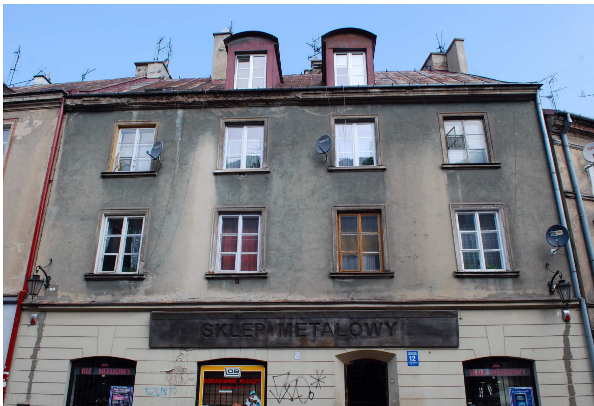
Fasada, Kowalska 12, fot. Marcin Moszyński, 2010.