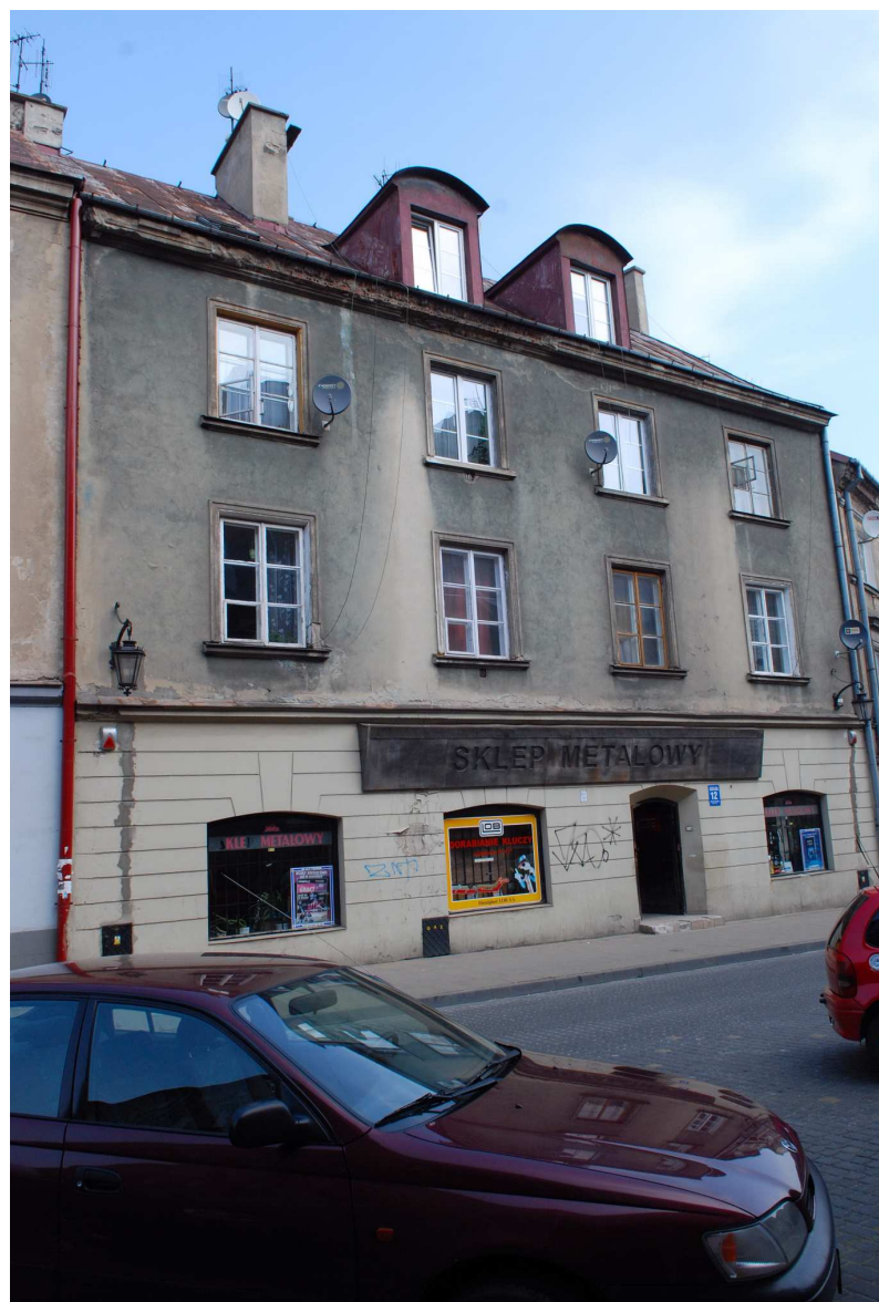
Fasada, Kowalska 12, fot. Marcin Moszyński, 2010.