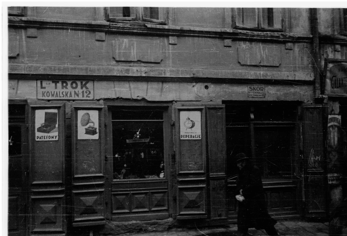
Kowalska 12, autor Stefan Kielsznia, 1938, zbiory fotografii Jerzego Kielszni.