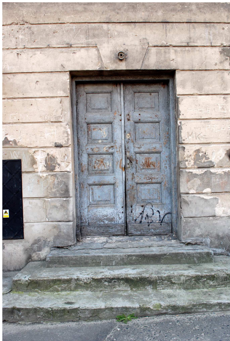
Detal, Kowalska 12, fot. Marcin Moszyński, 2010.