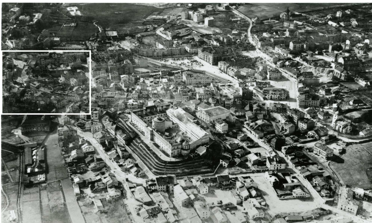
Panorama Lublina, lata 30./Panorama of Lublin in the 1930s,