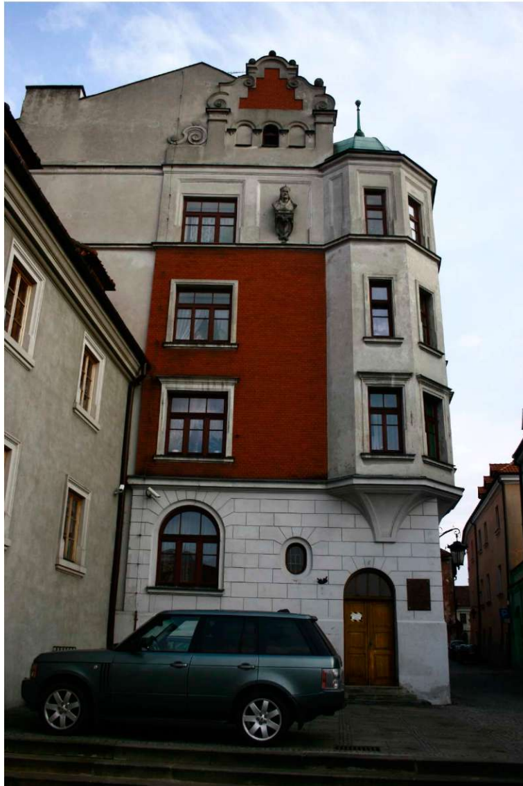
Elewacje, Archidiakońska 7, fot. Marta Sarzyńska, 2010.