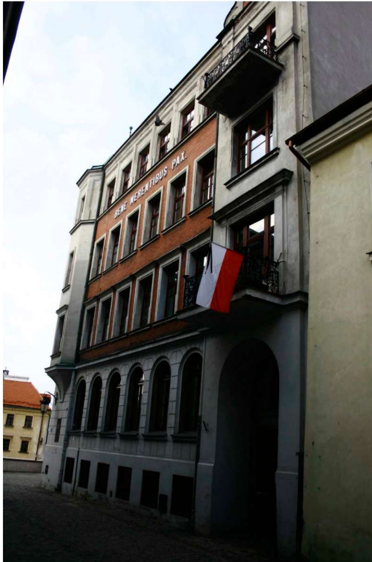
Elewacje, Archidiakońska 7, fot. Marta Sarzyńska, 2010.