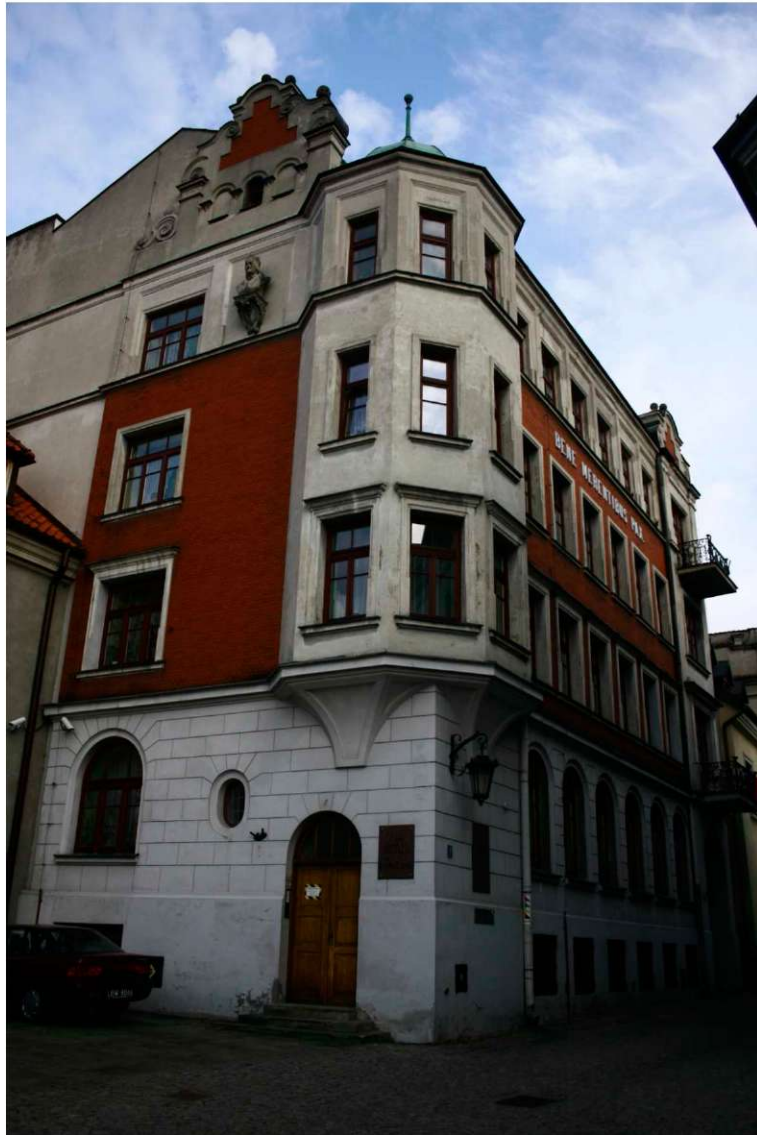
Elewacje, Archidiakońska 7, fot. Marta Sarzyńska, 2010.