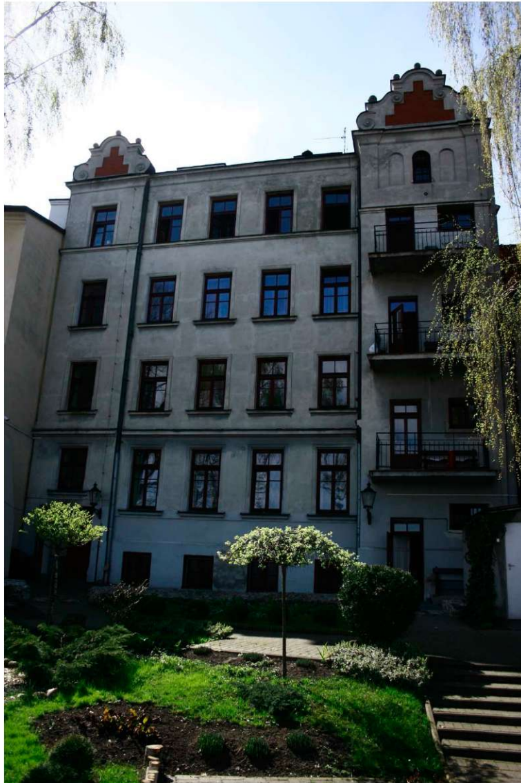
Podwórko wewnętrzne, Archidiakońska 7, fot. Marta Sarzyńska, 2010.