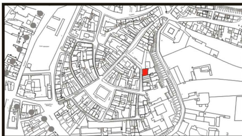
LOKALIZACJA NIERUCHOMOŚCI - Archidiakońska 7 LOCATION OF THE PROPERTY - Archidiakońska 7