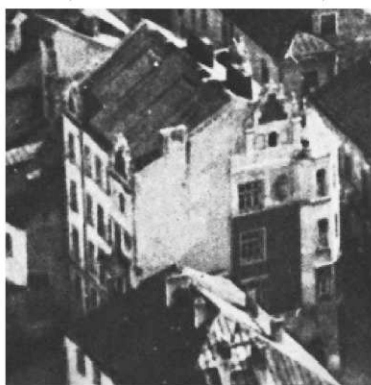
Fragment panoramy Lublina, lata 30., Archidiakońska 7/A fragment of panorama of Lublin in the 1930s, Archidiakońska 7,