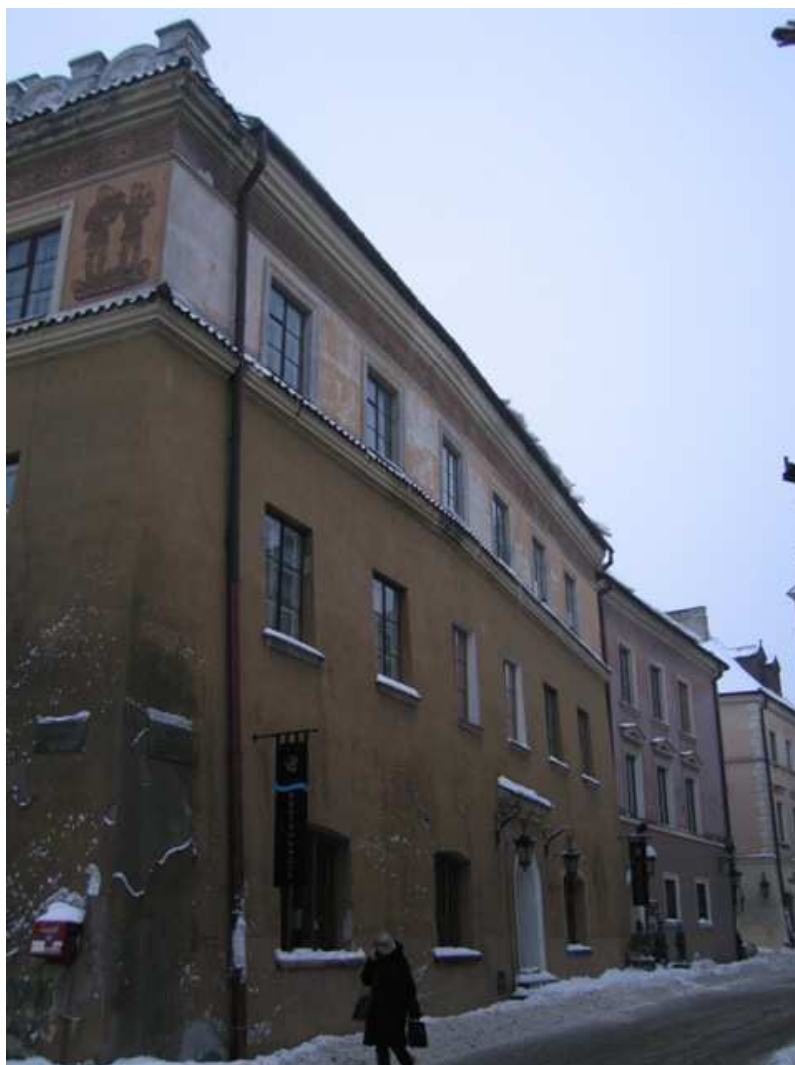
Bramowa 5, fot. Alicja Magiera, 2010.