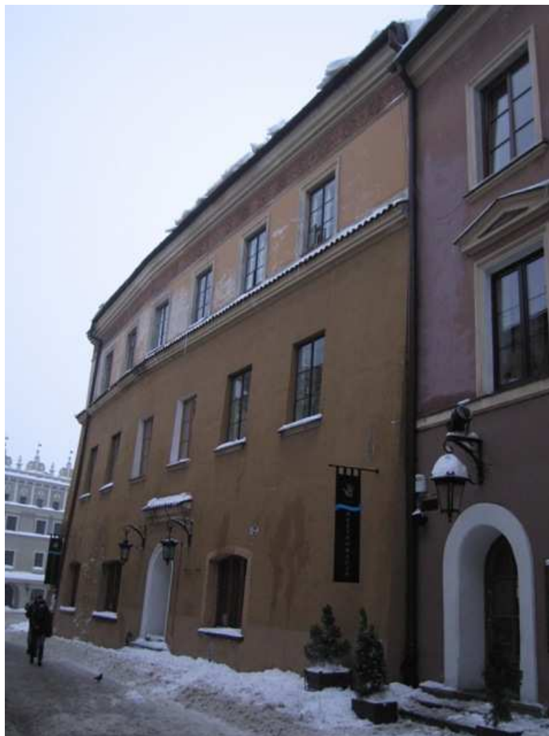
Bramowa 5, fot. Alicja Magiera, 2010.