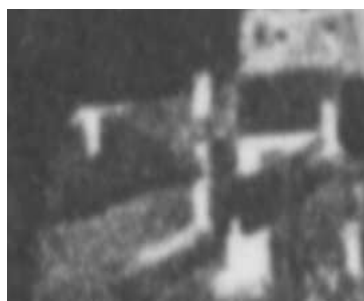
Fragment panoramy Lublina, lata 30., Bramowa 5/A fragment of panorama of Lublin in the 1930s, Bramowa 5,