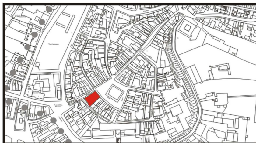
LOKALIZACJA NIERUCHOMOŚCI - Bramowa 5 LOCATION OF THE PROPERTY - Bramowa 5