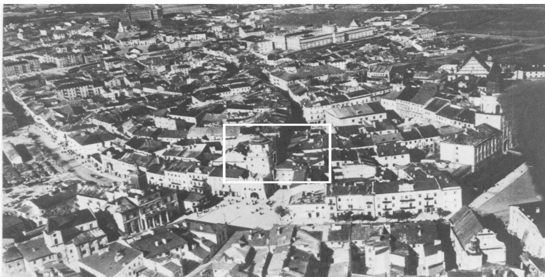
Panorama Lublina, lata 30./Panorama of Lublin in the 1930s,