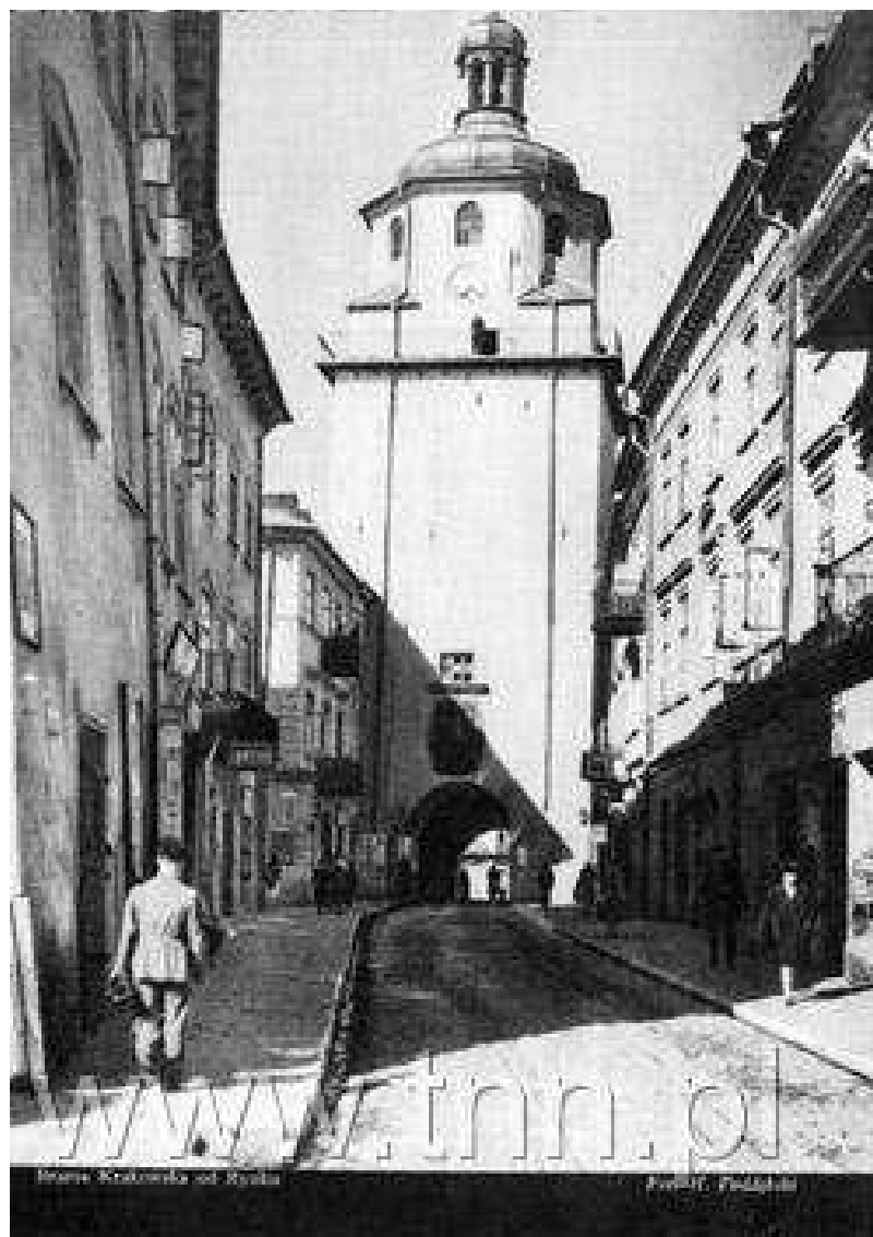
Brama Krakowska i ul. Bramowa od strony Starego Miasta, Bramowa 5 pierwsz kamienica od lewej strony, 1931