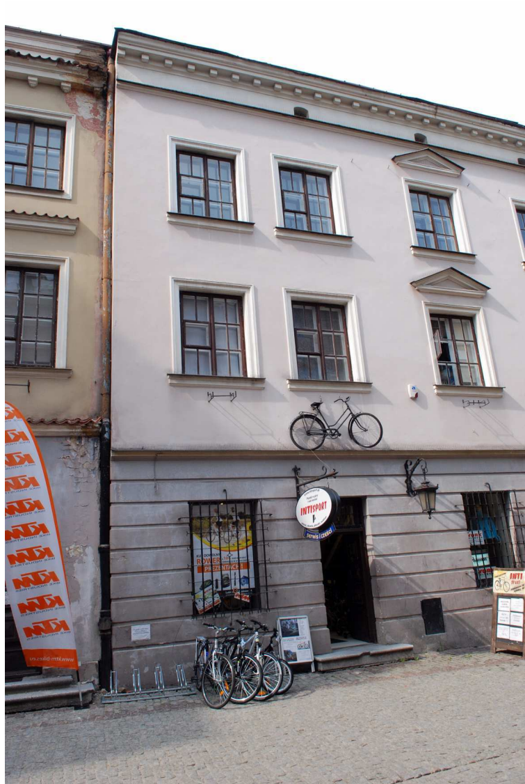
Fasada, Bramowa 6, fot. Marcin Moszyński, 2010.