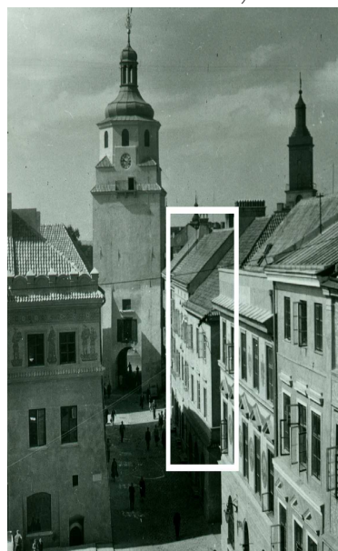
Fragment panoramy Lublina, lata 30., ul. Bramowa/A fragment of panorama of Lublin in the 1930s, Bramowa street,