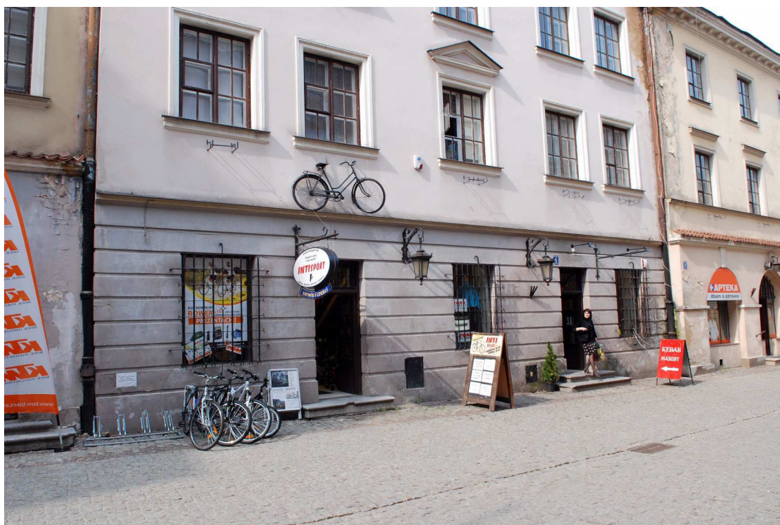
Fasada fragmenty, Bramowa 6, fot. Marcin Moszyński, 2010.