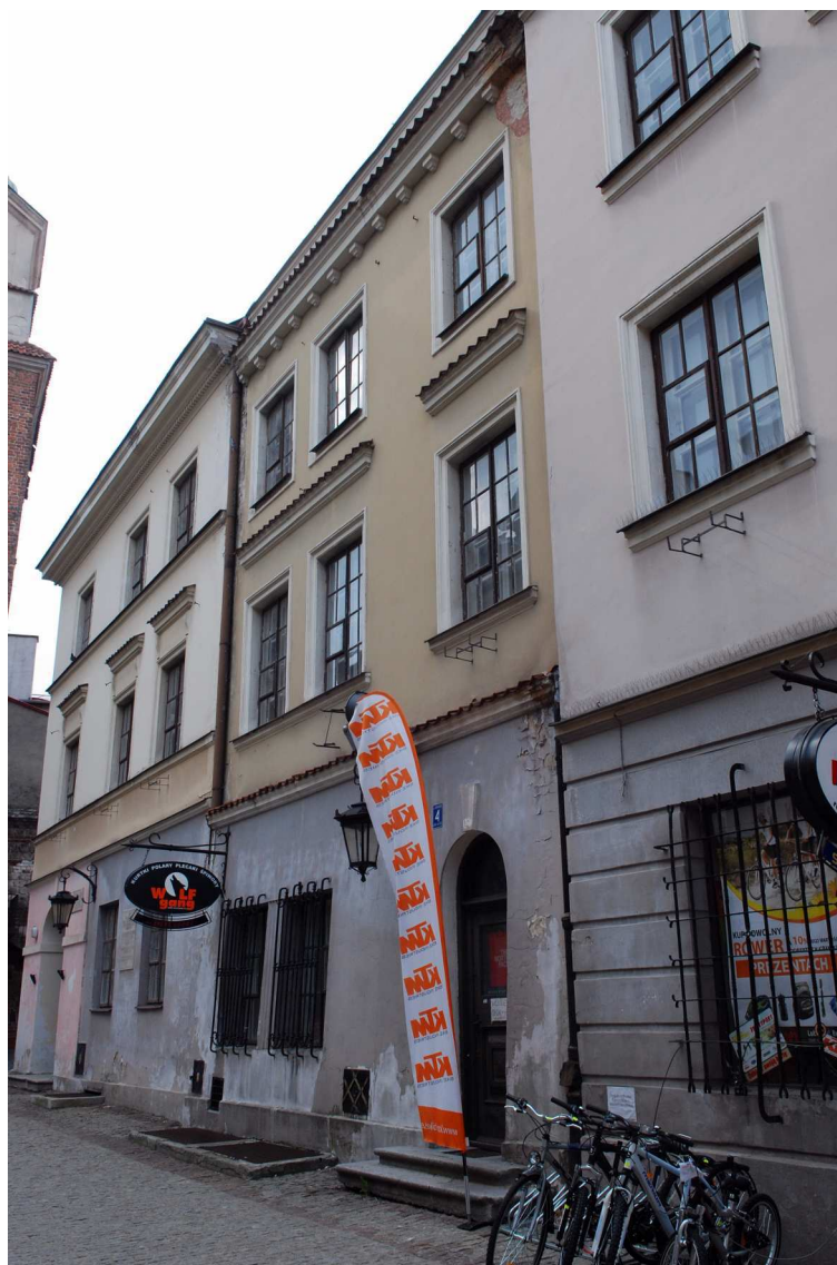
Fasada, Bramowa 6, fot. Marcin Moszyński, 2010.