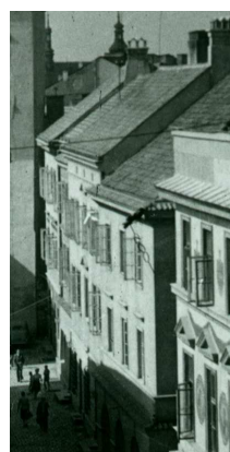
Fragment panoramy Lublina, lata 30., Bramowa 6/A fragment of panorama of Lublin in the 1930s, Bramowa 6,