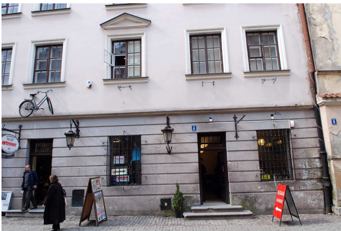
Fasada fragmenty, Bramowa 6, fot. Marcin Moszyński, 2010.