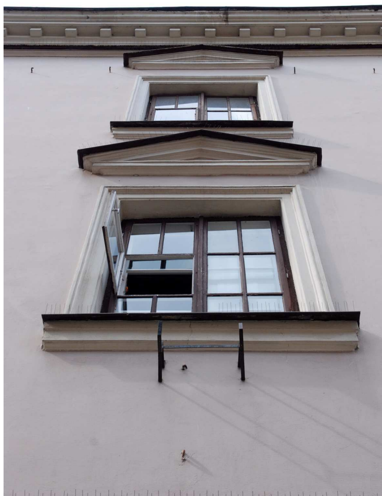
Detale, Bramowa 6, fot. Marcin Moszyński, 2010.