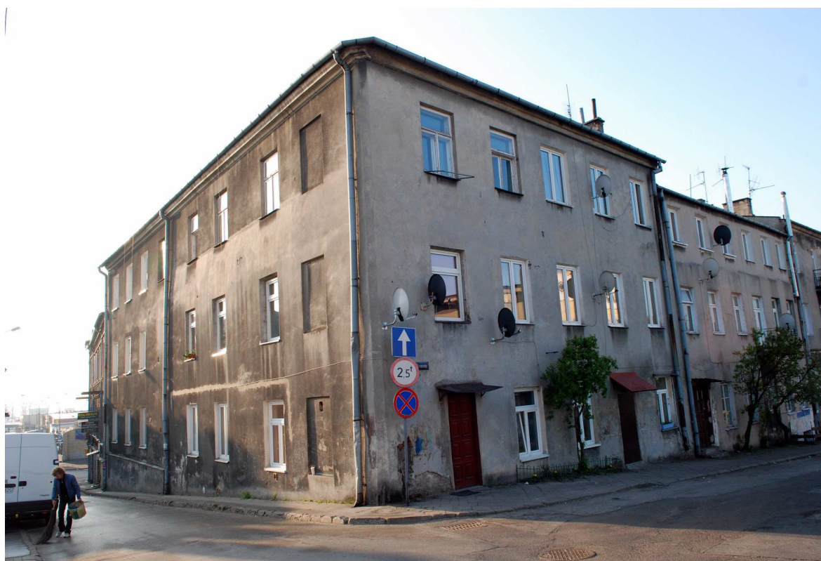
Elewacja główna i boczna, Browarna 1, fot. Marcin Moszyński, 2010.