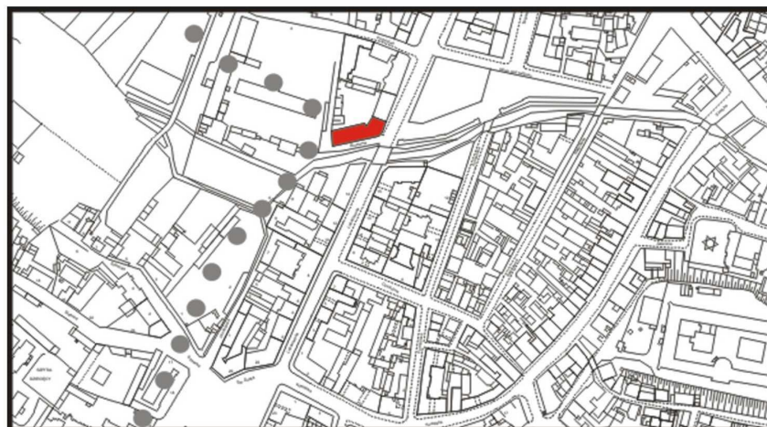
LOKALIZACJA NIERUCHOMOŚCI - Browarna 1 LOCATION OF THE PROPERTY - Browarna 1