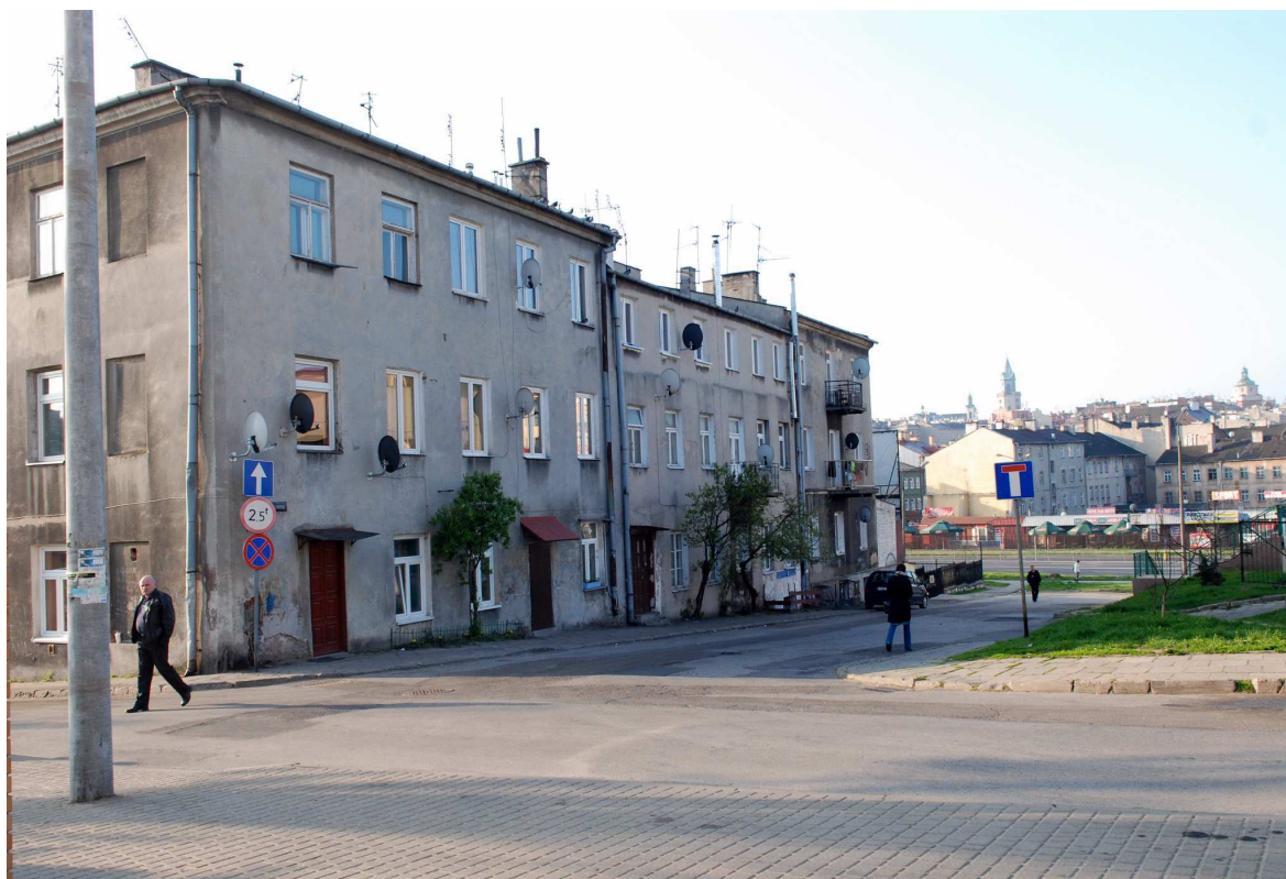
Elewacja główna, Browarna 1, fot. Marcin Moszyński, 2010.