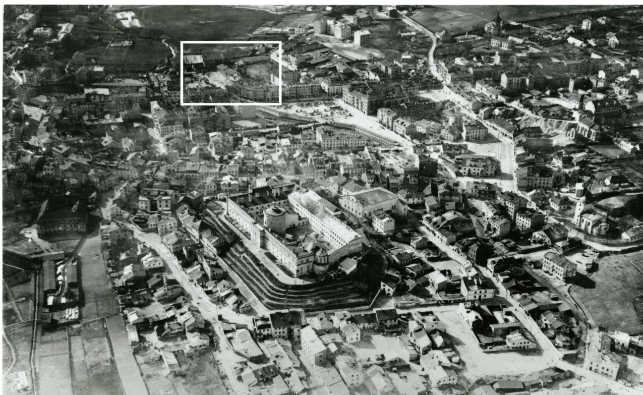
Panorama Lublina, lata 30./Panorama of Lublin in the 1930s,