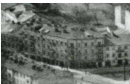
Fragment panoramy Lublina, lata 30., Browarna 1/A fragment of panorama of Lublin in the 1930s, Browarna 1,