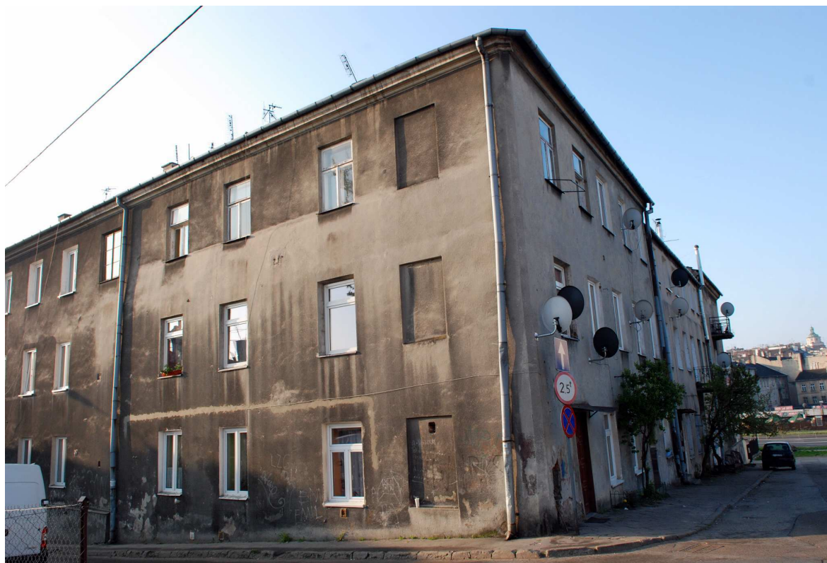
Elewacja główna i boczna, Browarna 1 , 2010.