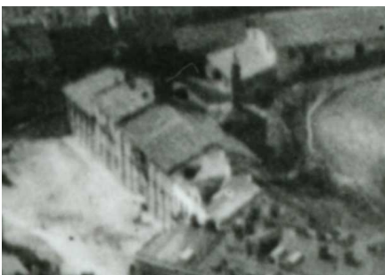
Fragment panoramy Lublina, lata 30., Browarna 2/A fragment of panorama of Lublin in the 1930s, Browarna 2,