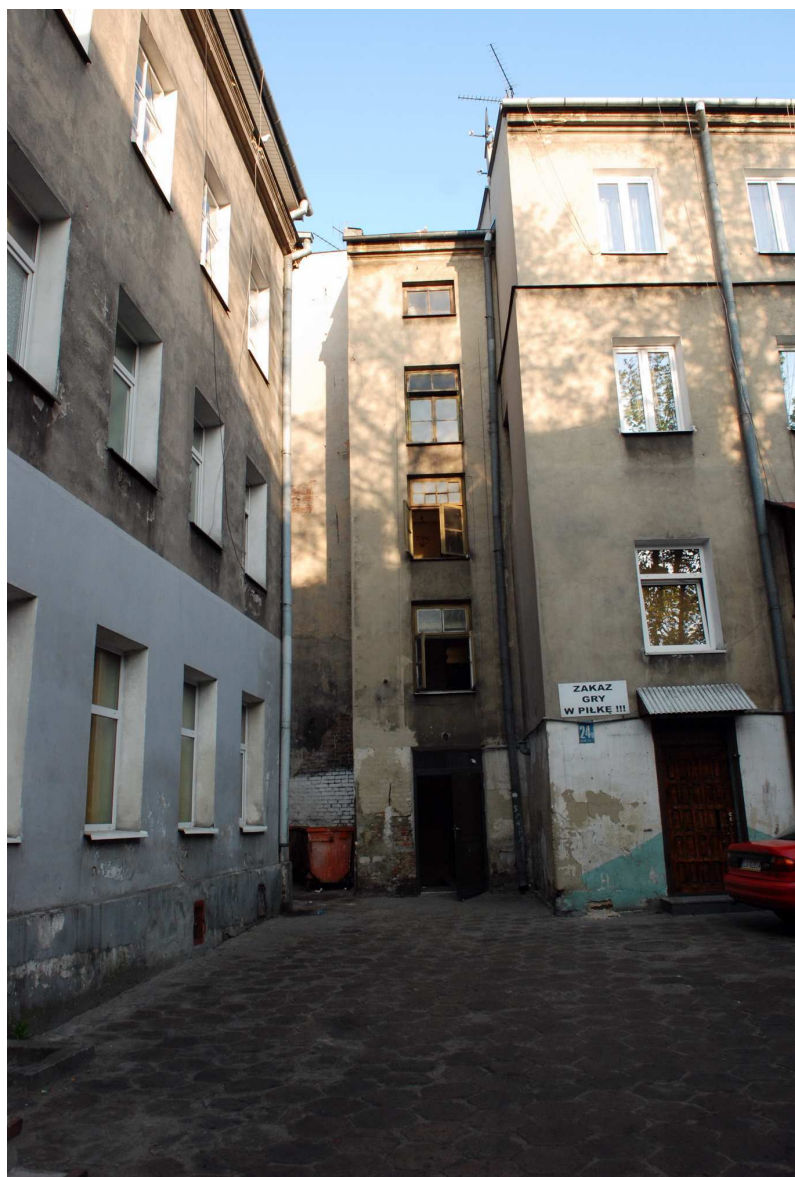
Elewacja główna, widok od podwórka, Browarna 2, fot. Marcin Moszyński , 2010.