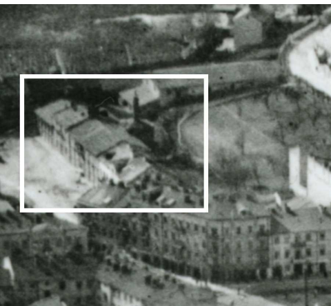
Fragment panoramy Lublina, lata 30., ul. Browarna/A fragment of panorama of Lublin in the 1930s, Browarna street,