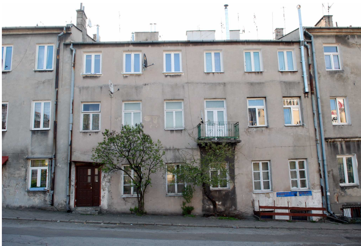
Elewacja główna, Browarna 2, fot. Marcin Moszyński, 2010.