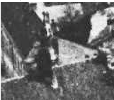
Fragment panoramy Lublina, lata 30., Dominikańska 1/A fragment of panorama of Lublin in the 1930s, Dominikańska 1,