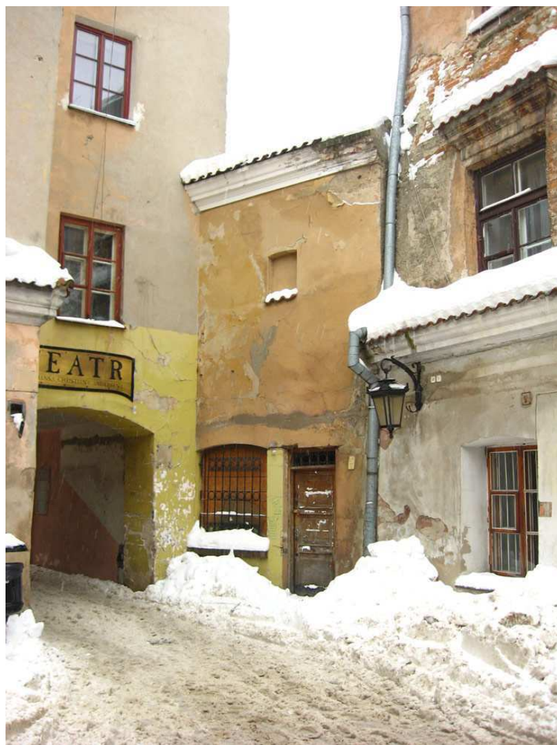
Elewacja, Dominikańska 1, 2010