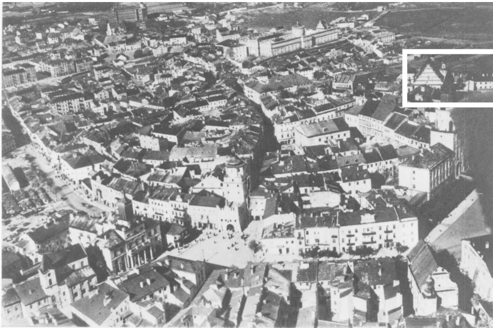
Panorama Lublina, lata 30./Panorama of Lublin in the 1930s,