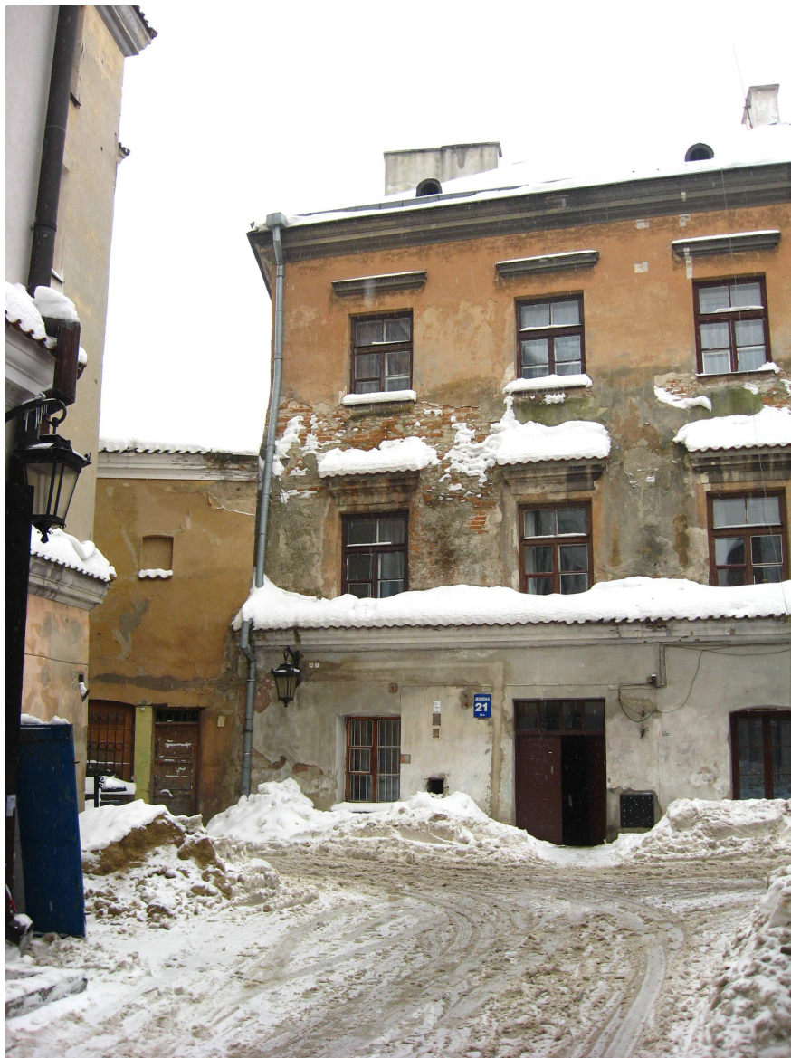
Dominikańska 1 pierwsza od lewej, fot Robert Sawa, 2010