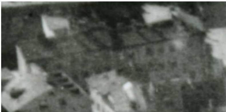
Fragment panoramy Lublina, lata 30., Cyrulicza 7/A fragment of panorama of Lublin in the 1930s, Cyrulicza 7,