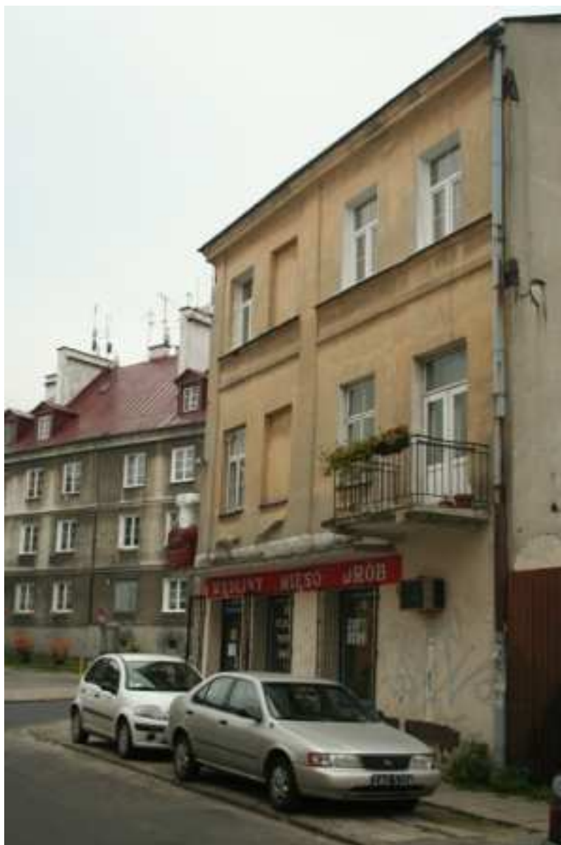
Elewacja frontowa, Cyrulicza 7, fot. Marcin Fedorowicz, 2010.