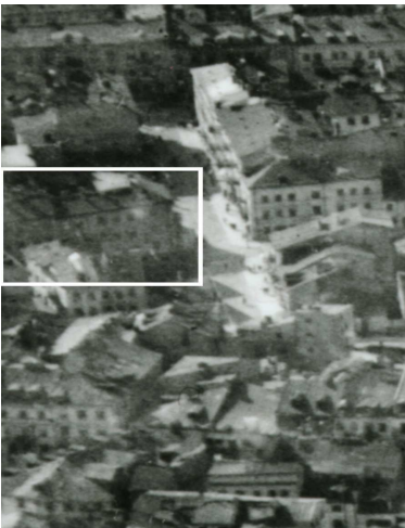
Fragment panoramy Lublina, lata 30., ul. Cyrulicza/A fragment of panorama of Lublin in the 1930s, Cyrulicza street,