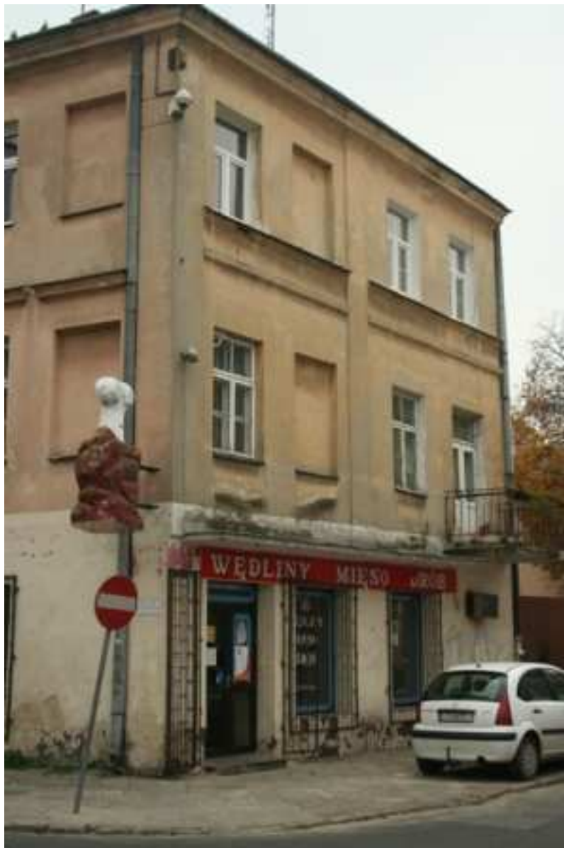
Elewacja frontowa, Cyrulicza 7, fot. Marcin Fedorowicz, 2010.