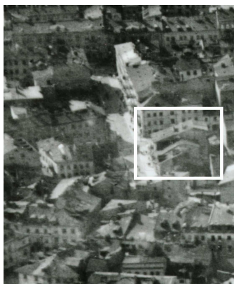
Fragment panoramy Lublina, lata 30., ul. Cyrulicza/A fragment of panorama of Lublin in the 1930s, Cyrulicza street,