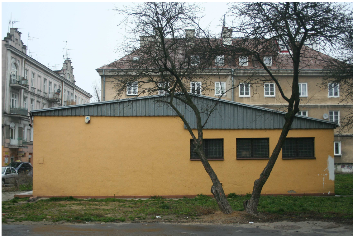
Elewacja frontowa, Cyrulicza 10, fot. Marcin Fedorowicz, 2010.