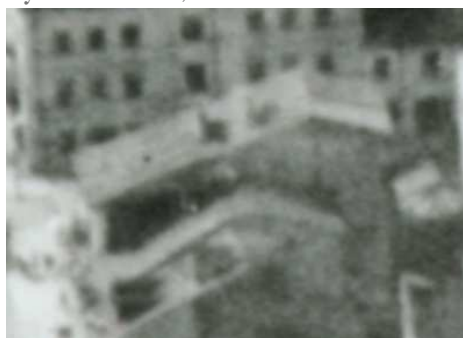
Fragment panoramy Lublina, lata 30., Cyrulicza 10/A fragment of panorama of Lublin in the 1930s, Cyrulicza 10,