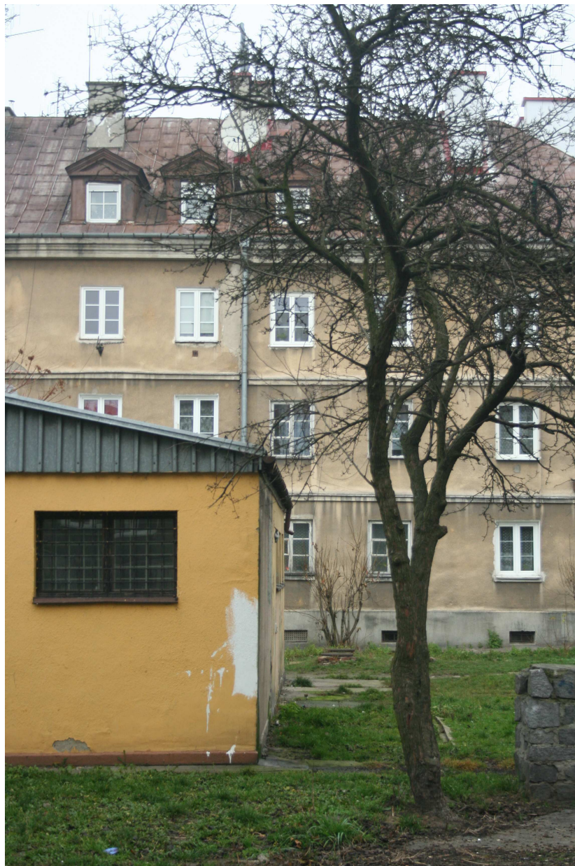
Elewacja frontowa, Cyrulicza 12, fot. Marcin Fedorowicz, 2010.