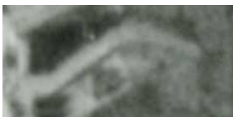
Fragment panoramy Lublina, lata 30., Cyrulicza 12/A fragment of panorama of Lublin in the 1930s, Cyrulicza 12,