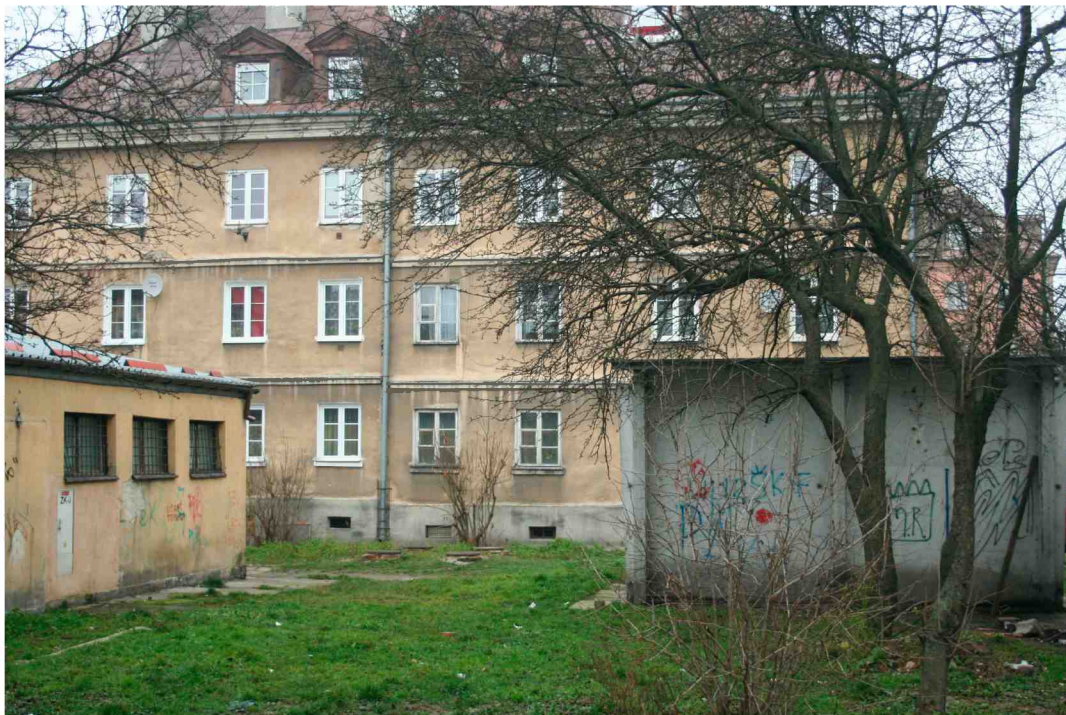
Elewacja frontowa, Cyrulicza 14, fot. Marcin Fedorowicz, 2010.