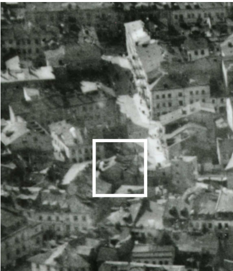
Fragment panoramy Lublina, lata 30., ul. Cyrulicza/A fragment of panorama of Lublin in the 1930s, Cyrulicza street,