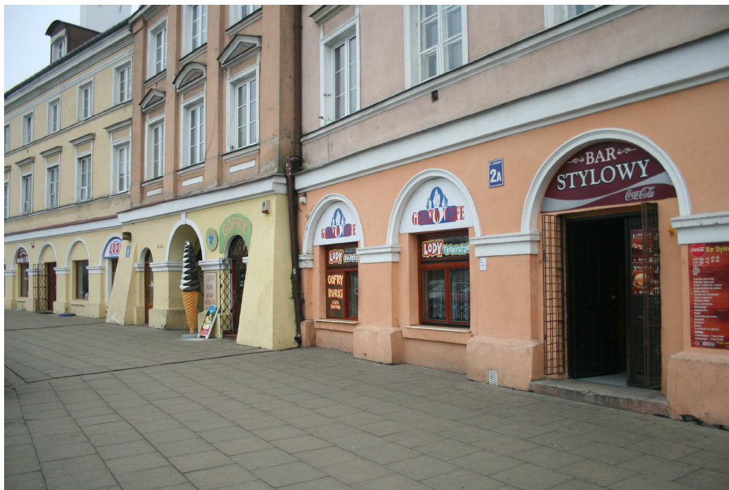
Elewacja frontowa, Cyrulicza 15, fot. Marcin Fedorowicz, 2010.