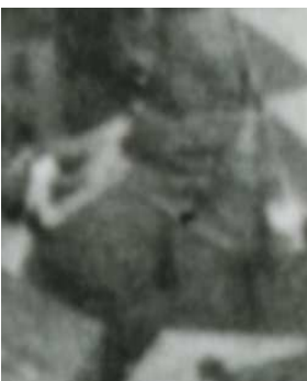
Fragment panoramy Lublina, lata 30., Cyrulicza 15/A fragment of panorama of Lublin in the 1930s, Cyrulicza 15,