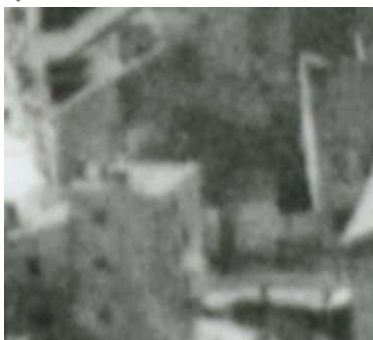
Fragment panoramy Lublina, lata 30., Cyrulicza 16/A fragment of panorama of Lublin in the 1930s, Cyrulicza 16,