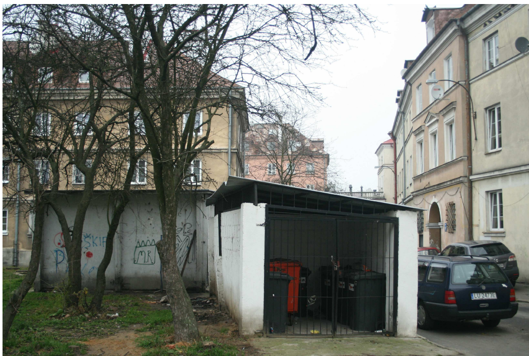
Elewacja frontowa, Cyrulicza 16, fot. Marcin Fedorowicz, 2010.