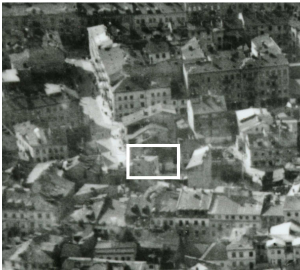
Fragment panoramy Lublina, lata 30., ul. Cyrulicza/A fragment of panorama of Lublin in the 1930s, Cyrulicza street,