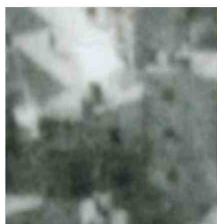
Fragment panoramy Lublina, lata 30., Cyrulicza 18/A fragment of panorama of Lublin in the 1930s, Cyrulicza 18,