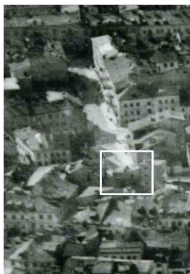
Fragment panoramy Lublina, lata 30., ul. Cyrulicza/A fragment of panorama of Lublin in the 1930s, Cyrulicza street,