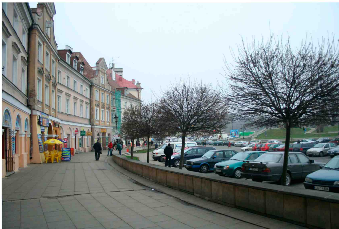
Elewacja frontowa, Cyrulicza 18, fot. Marcin Fedorowicz, 2010.