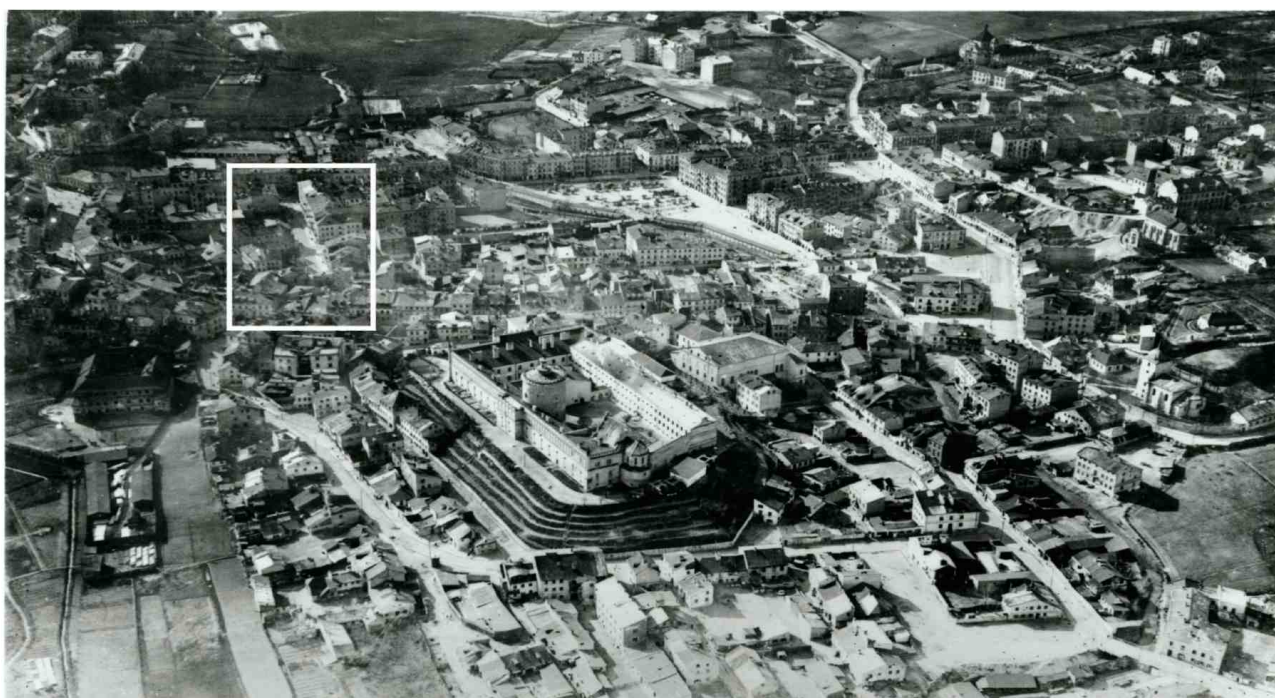
Panorama Lublina, lata 30./Panorama of Lublin in the 1930s,