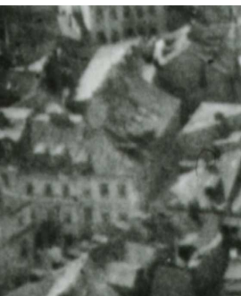
Fragment panoramy Lublina, lata 30., Cyrulicza 19/A fragment of panorama of Lublin in the 1930s, Cyrulicza 19,