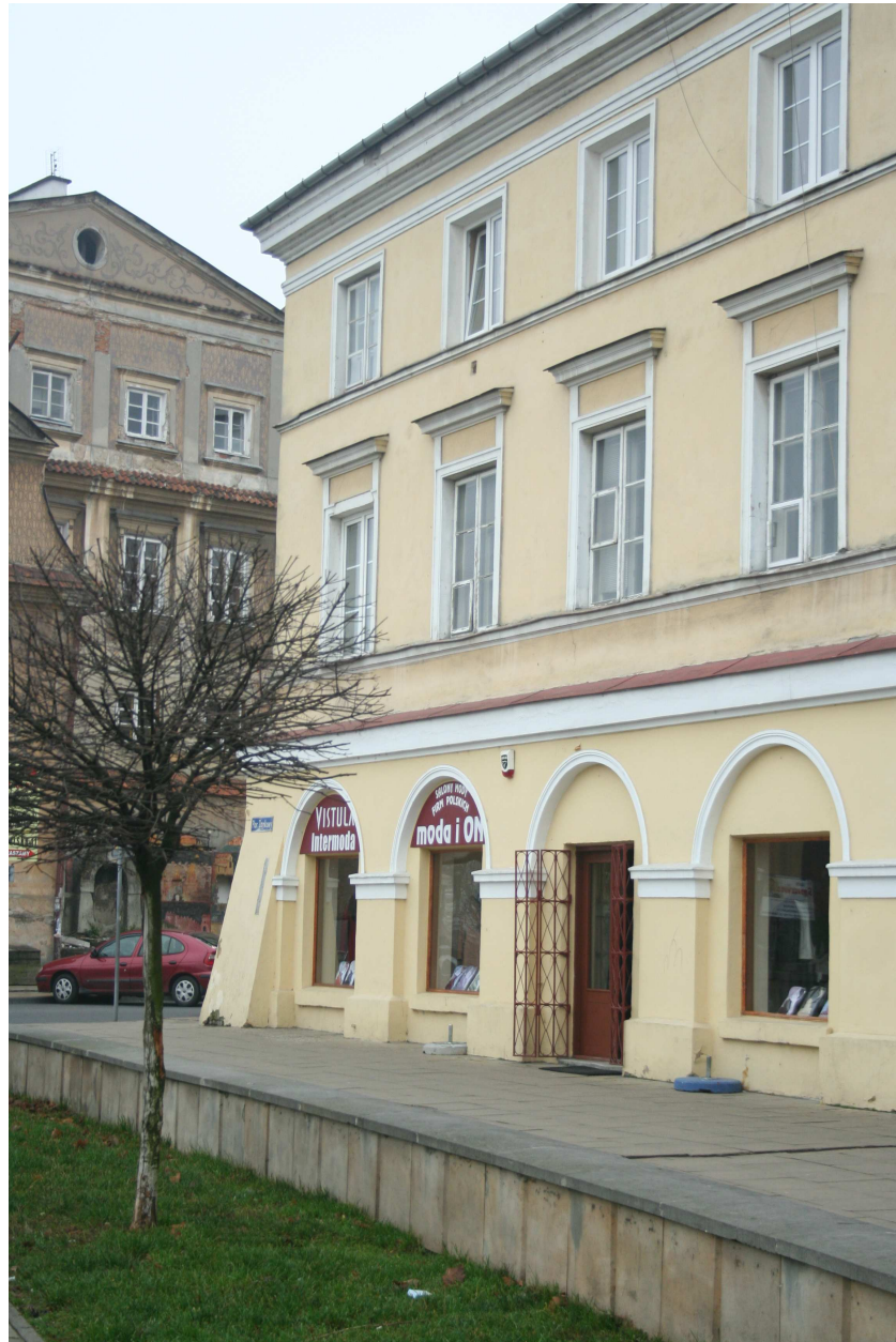
Elewacja frontowa, Cyrulicza 19, fot. Marcin Fedorowicz, 2010.