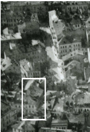
Fragment panoramy Lublina, lata 30., ul. Cyrulicza/A fragment of panorama of Lublin in the 1930s, Cyrulicza street,