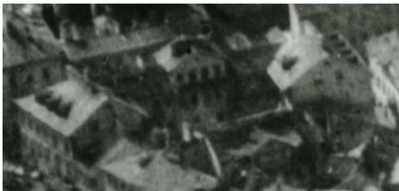
Fragment panoramy Lublina, lata 30., Furmańska 1/A fragment of panorama of Lublin in the 1930s, Furmańska 1,