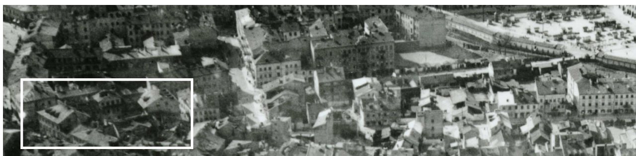
Fragment panoramy Lublina, lata 30., ul. Furmańska/A fragment of panorama of Lublin in the 1930s, Furmańska street,