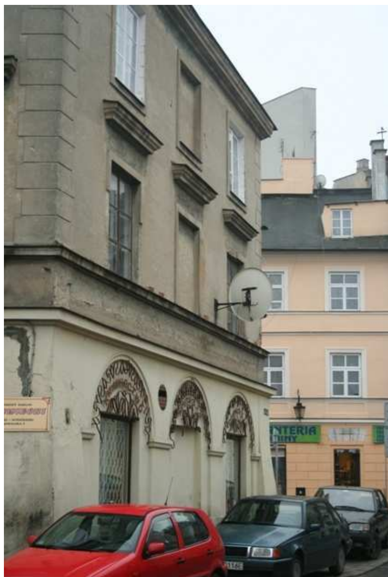
Furmańska 1, fot. Marcin Fedorowicz, 2010.