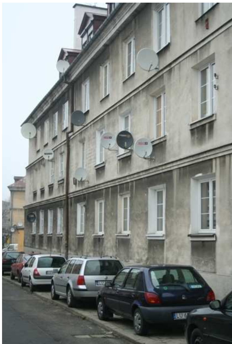
Furmańska 3, 2010.