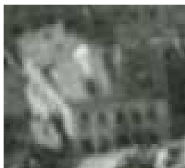
Fragment panoramy Lublina, lata 30., Furmańska 3/A fragment of panorama of Lublin in the 1930s, Furmańska 3,