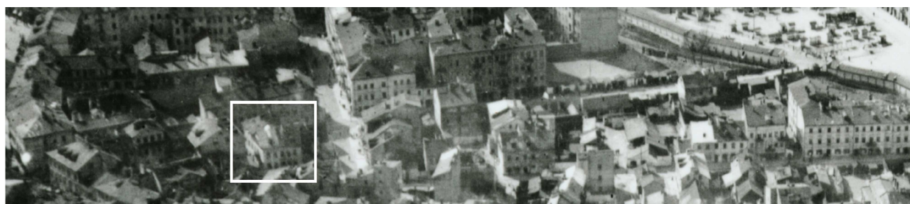
Fragment panoramy Lublina, lata 30., ul. Furmańska/A fragment of panorama of Lublin in the 1930s, Furmańska street,