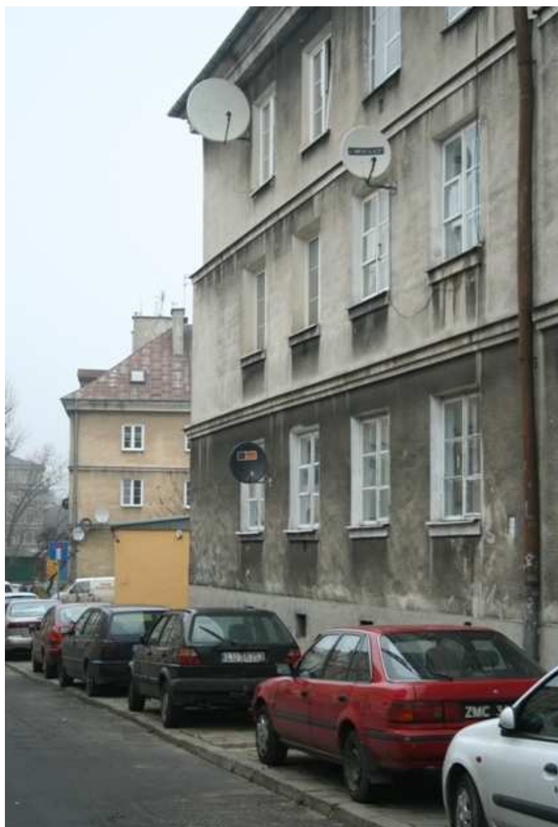
Furmańska 5, fot. Marcin Fedorowicz, 2010.