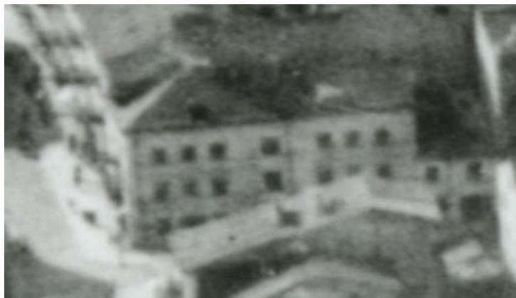
Fragment panoramy Lublina, lata 30., Furmańska 8/A fragment of panorama of Lublin in the 1930s, Furmańska 8,