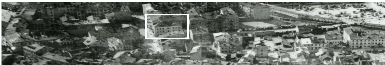
Fragment panoramy Lublina, lata 30., ul. Furmańska/A fragment of panorama of Lublin in the 1930s, Furmańska street,