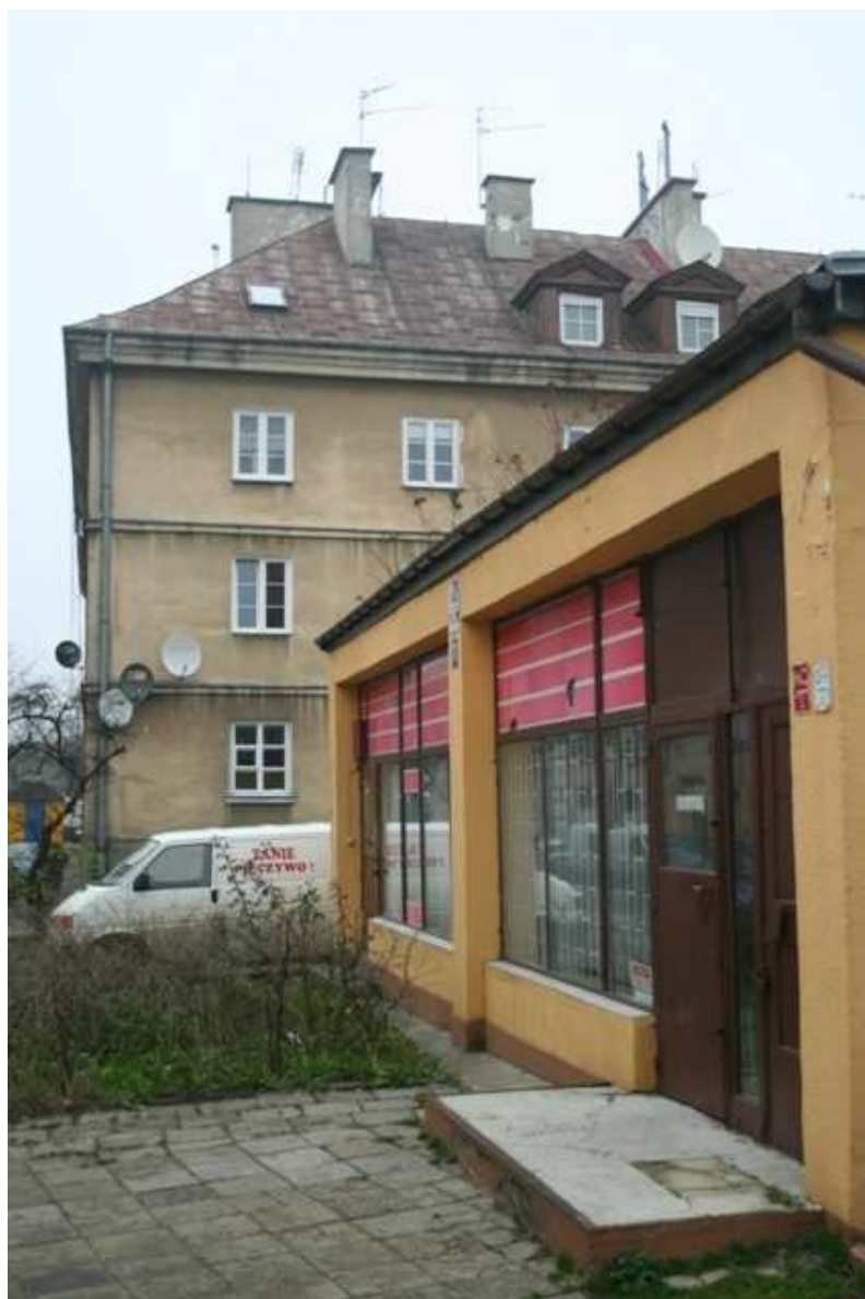
Furmańska 7, fot. Marcin Fedorowicz, 2010.