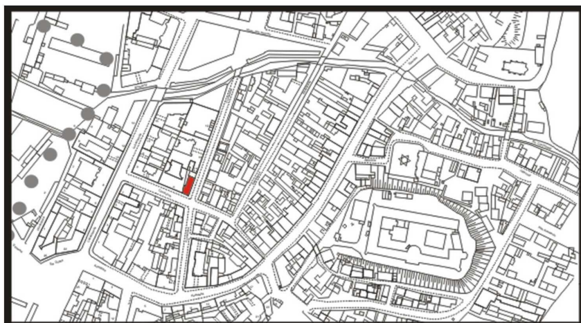
LOKALIZACJA NIERUCHOMOŚCI - Furmańska 8 LOCATION OF THE PROPERTY - Furmańska 8