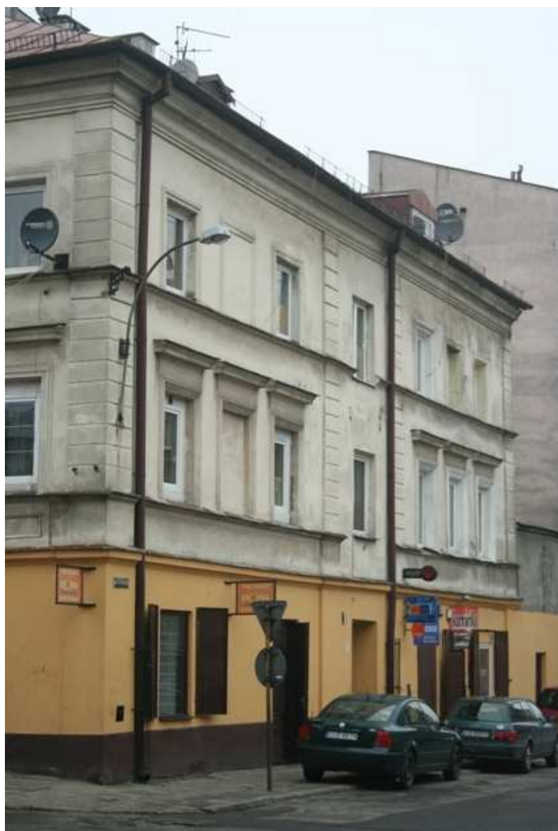
Furmańska 8, fot. Marcin Fedorowicz, 2010.