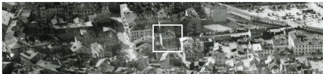
Fragment panoramy Lublina, lata 30., ul. Furmańska/A fragment of panorama of Lublin in the 1930s, Furmańska street,