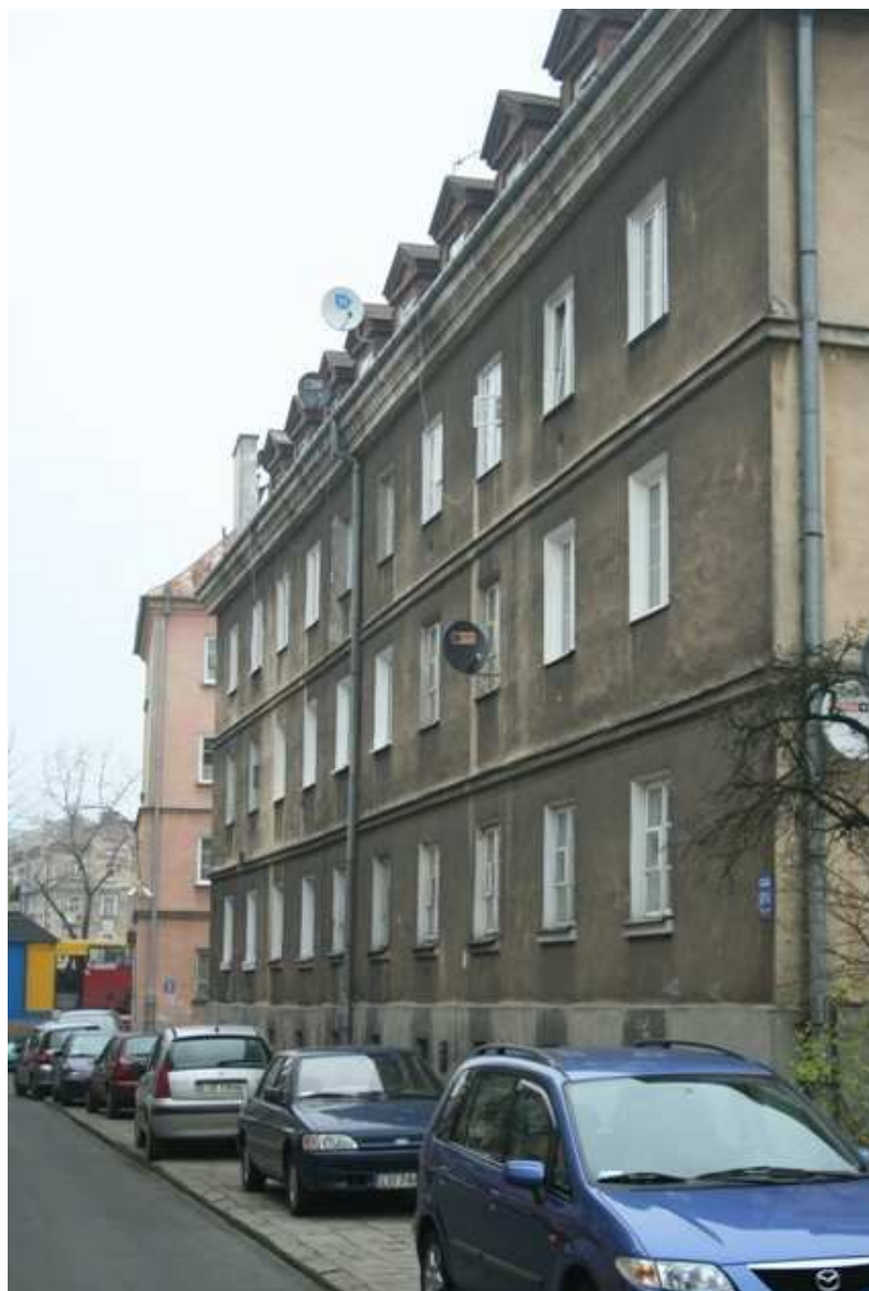
Furmańska 9, budynek powojenny, fot. Marcin Fedorowicz, 2010.