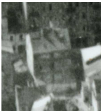
Fragment panoramy Lublina, lata 30., Furmańska 9/A fragment of panorama of Lublin in the 1930s, Furmańska 9,